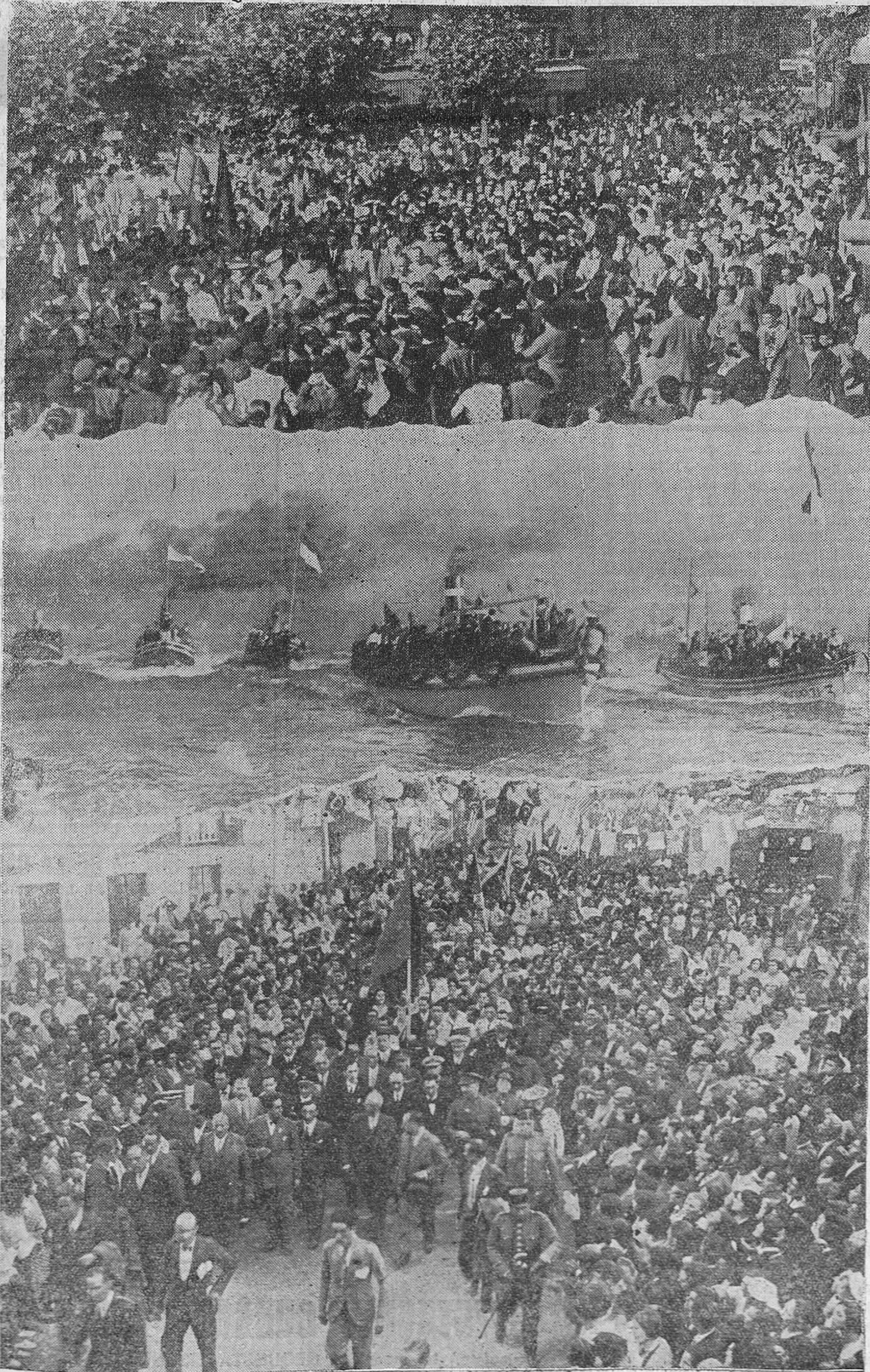
EL PRESIDENTE, EN LAREDO Y SANTOÑA. — En la parte superior, el pueblo de Laredo, manifestando su entusiasmo al presidente de la República en un acto cordial y sincero. — Al centro, los barcos que llevaron al señor Alcalá Zamora y a su séquito desde Laredo a Santoña, y abajo, el grandioso recibimiento que tributó el pueblo santónés al primer magistrado de la nación.

que se leía: "Colindres republicano saluda a su excelencia."