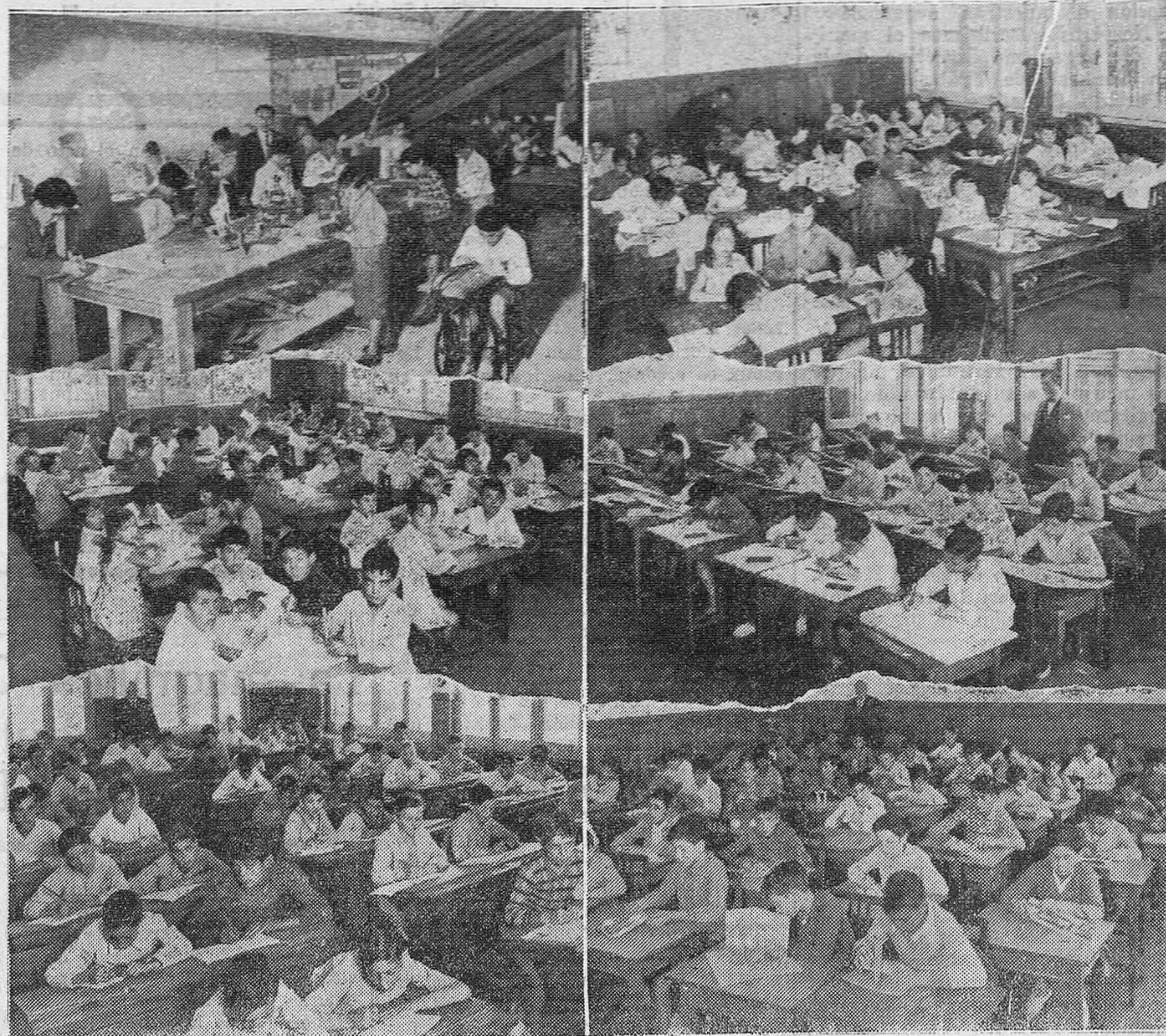
Los niños del grupo escolar Menéndez y Pelayo, preparando los trabajos que se exponen estos días en ese centro docente, y los álbumes que enviarán a otros colegios de diferentes regiones.

¿Quién está obligado a levantar el piso de la carretera, para poner la alcantarilla en las debidas condiciones? Unos dicen que la Jefatura de Obras Públicas. Otros, que el Patronato de Fiebre Especial. Y todos parece que saben, porque conocen los procedimientos de nuestra burocracia, que para hacer una cosa tan sencilla, se necesita una tramitación previa, más o menos complicada... ¿Tendrá que re-