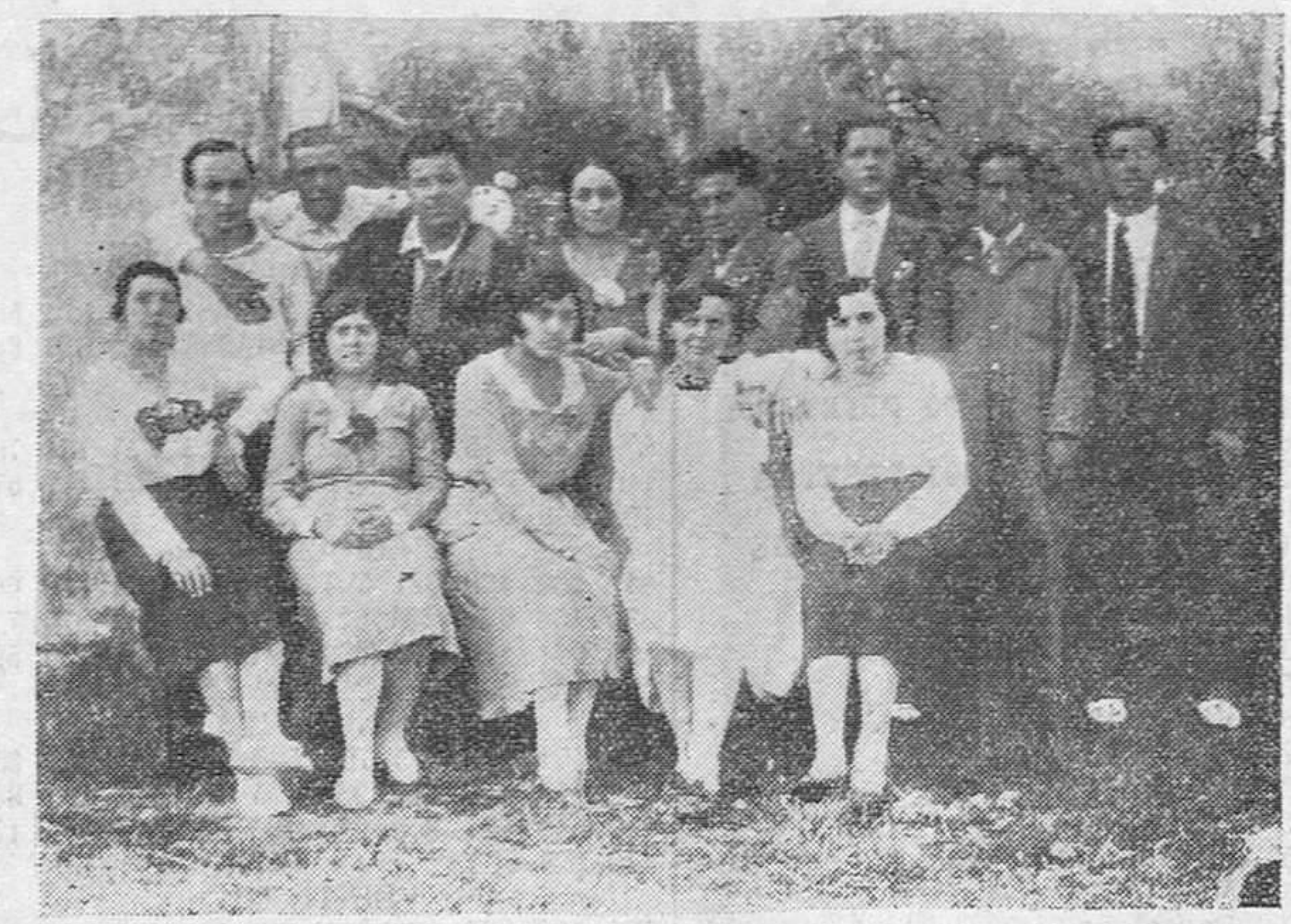
CABEZON DE LA SAL. -- Grupo de jóvenes de la localidad que hoy, sábado, pondrán en nuestro teatro la comedia en tres actos "¡Mi padre!".

Las botas de futbol mejores y más baratas las vende PACO CAYON, en su Zapatería de la calle de la Estrella, esquina a la plazuela del Sol. ¡No confundirse! Estrella, 4.--Teléfono, 180