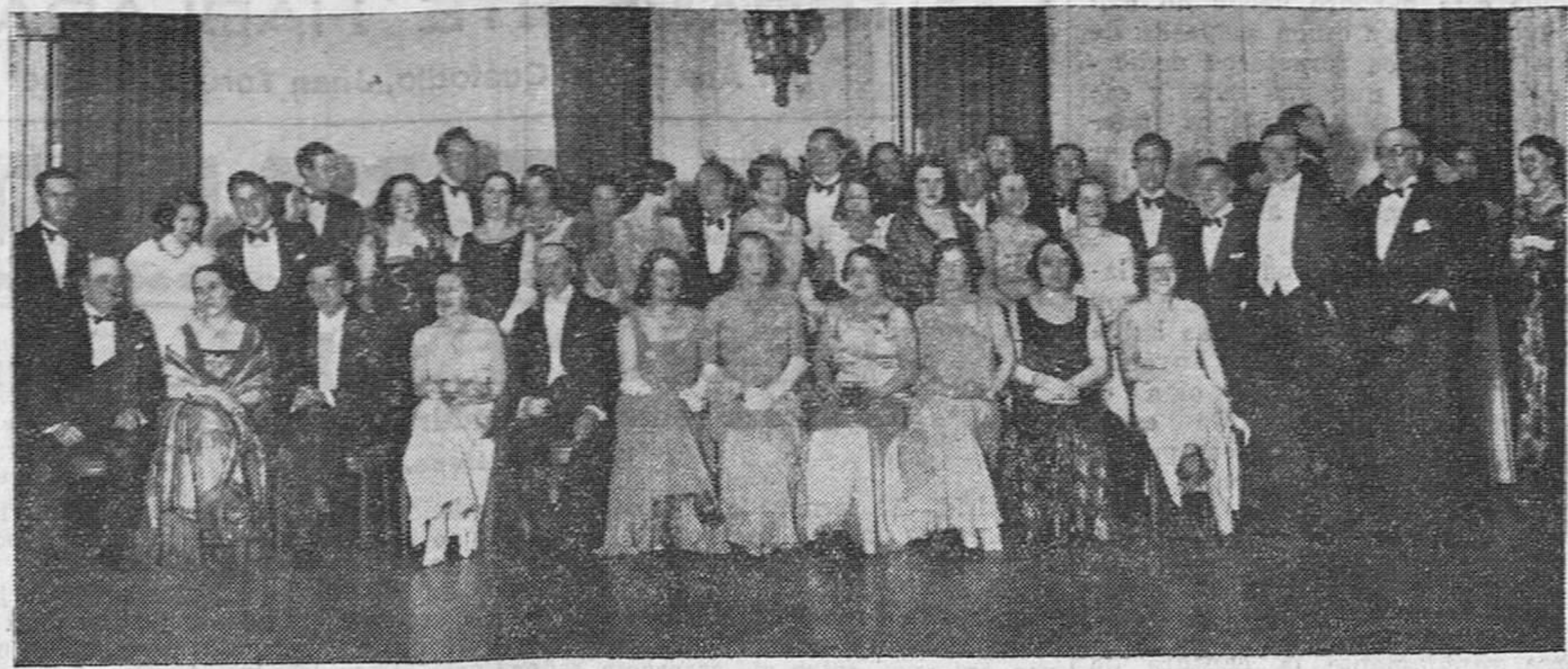
Fiesta en el Hotel Ritz, de Madrid, organizada por el Liceum Club Femenino, en honor de las Repúblicas Hispanoamericanas, con asistencia de sus respectivos representantes en España y el ministro de Estado.

ANTONIO ALBERDI VÍAS URINARIAS, PARTOS Y ENFERMEDADES DE LA MUJER Consulta de diez a una y de tres a cinco. Amós de Escalante, 10, 1.º - Tel. 2963.