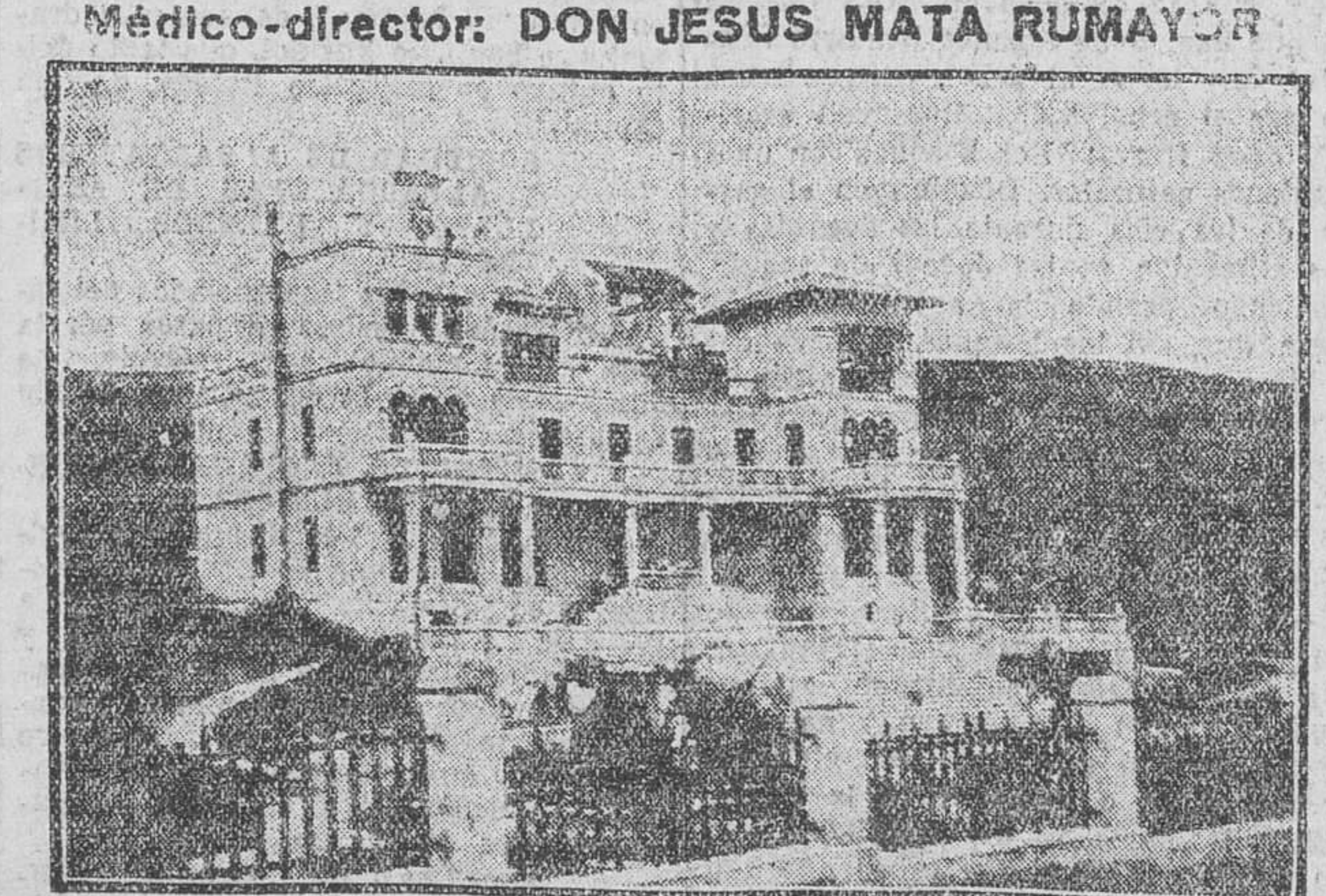
Este Sanatorio está principalmente destinado a las enfermedades de los huesos, músculos y articulaciones en sus afecciones tuberculosas, siendo de inmejorables resultados en los estados pre-tuberculosos, enfermedades de la nutrición, raquitismo, etc., etc. Su bella situación, hermosa instalación y confort le hacen ser uno de los mejores de España.