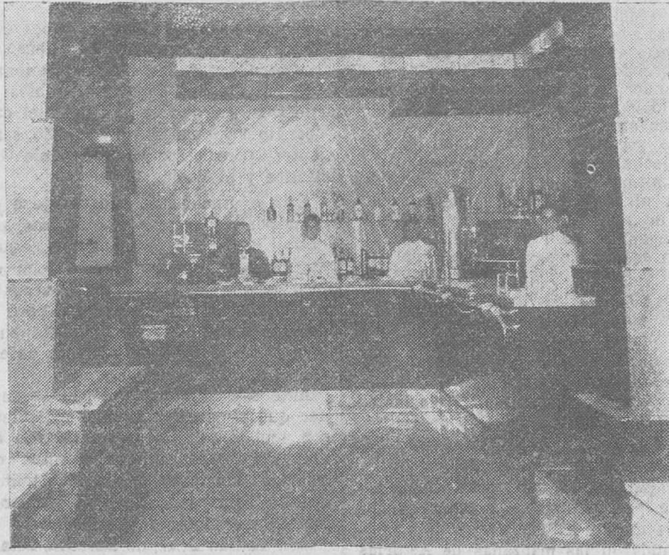
El magnífico mostrador, del más puro estilo americano.