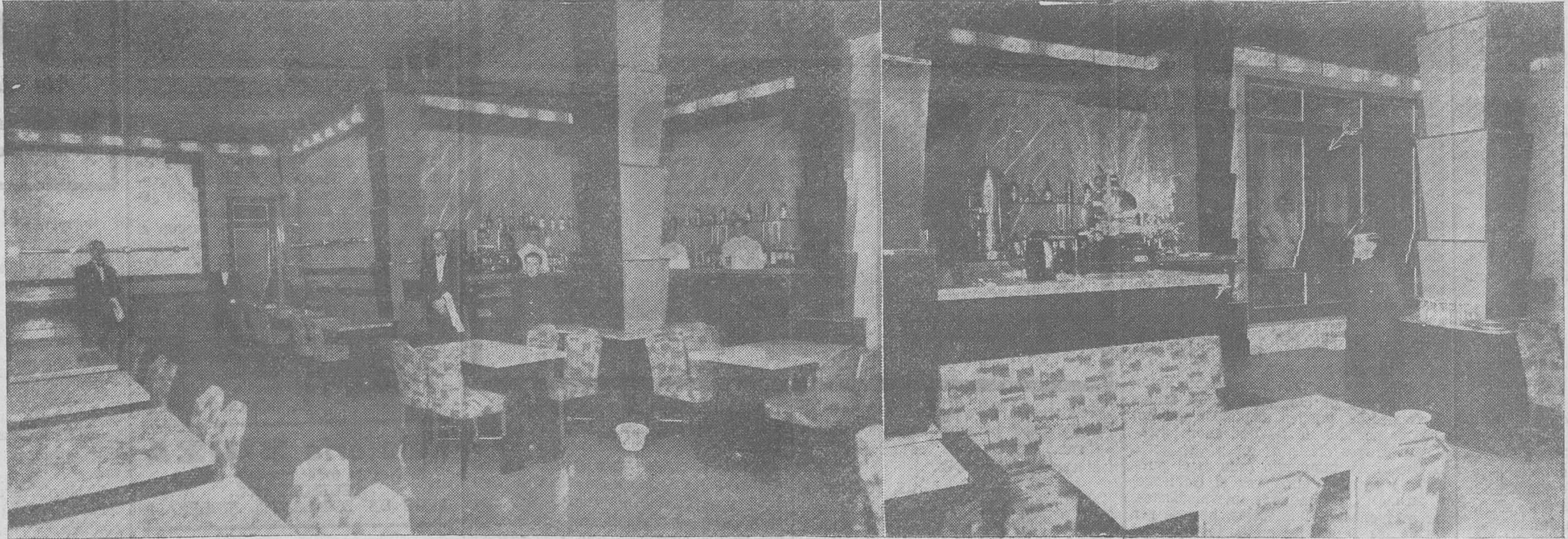
Dos aspectos del interior del elegante AMERICAN BAR CINEMA, cuyo precioso decorado llama justamente la atención de todos.