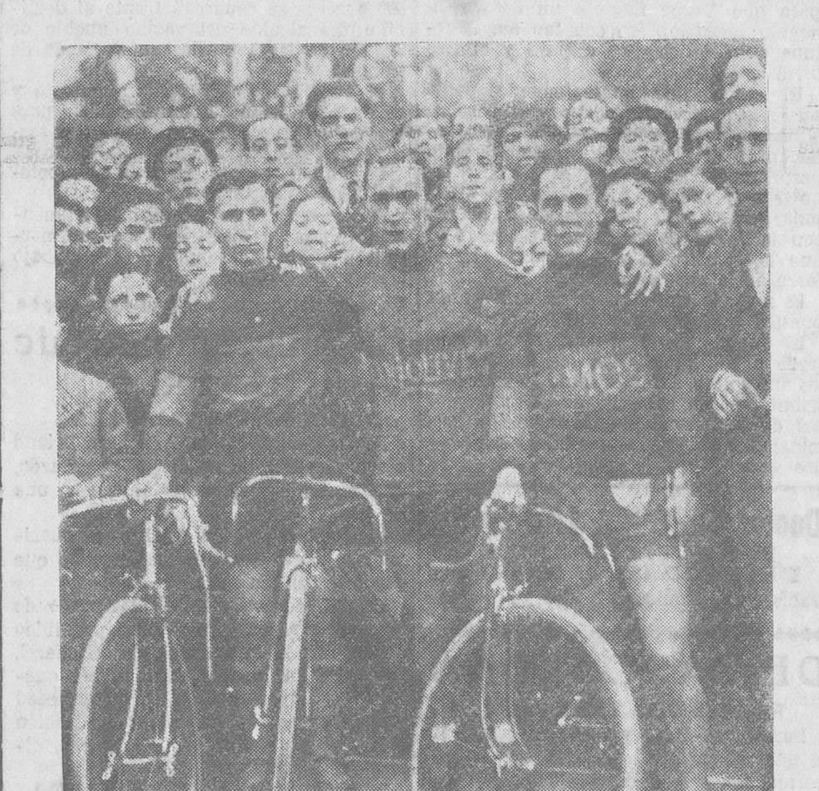
Los tres primeros clasificados en la carrera escolar celebrada el domingo, en el Sardinero. En el centro el vencedor de la prueba.

Así lo esperamos... Mds.—Angel Castro Rivero."