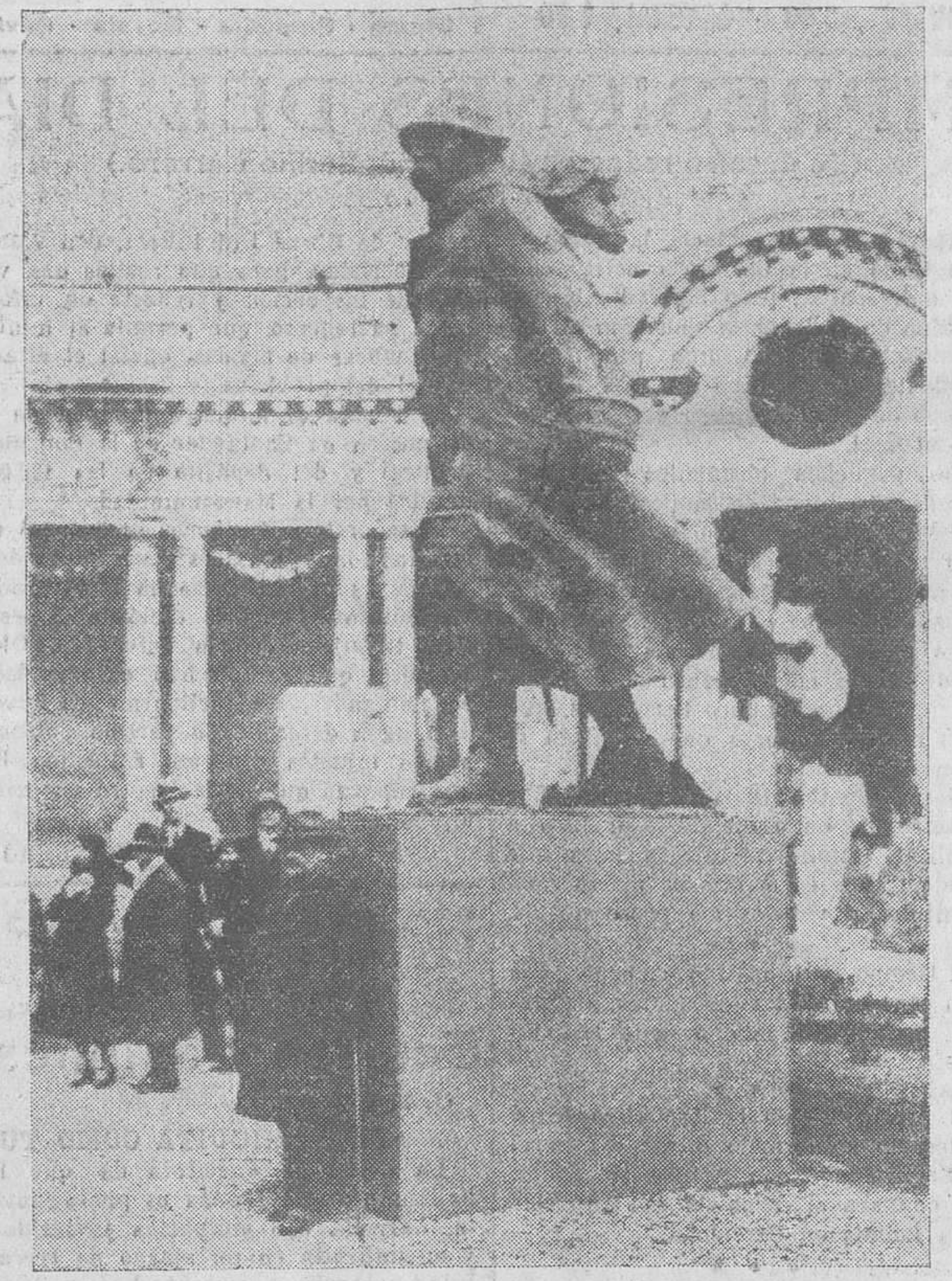
Estadua de Jorge Clémenceau, en el Petit Palais de París. Esta estatua, de la que es autor el famoso escultor francés Coigny, que está reostado en el pedestal, se va a inaugurar dentro de poco, para inmortalizar las glorias del "tigre".