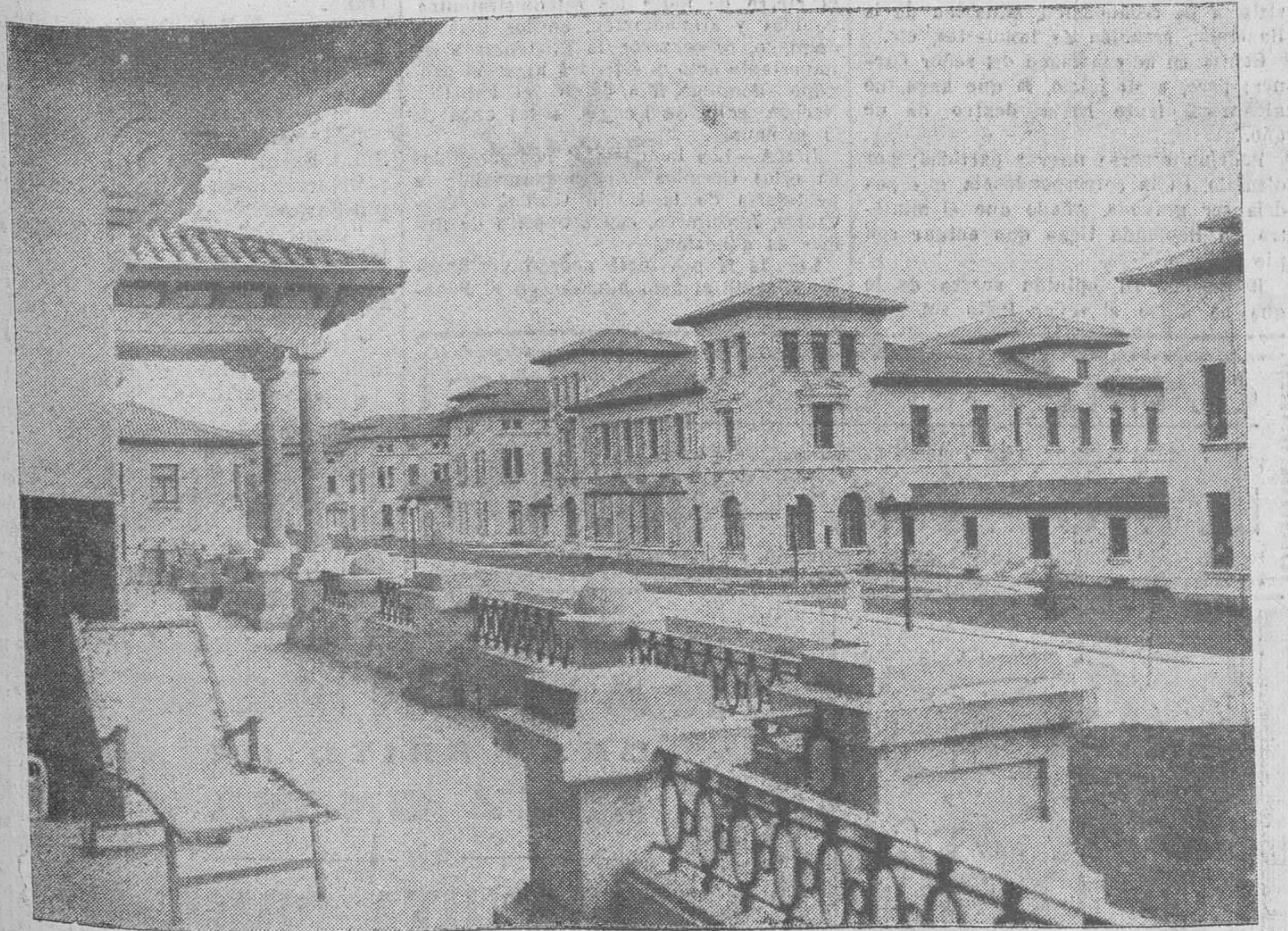
Uno de los "solariums" de la espléndida Casa de Salud Valdecilla, en estos hermosos días del invierno.