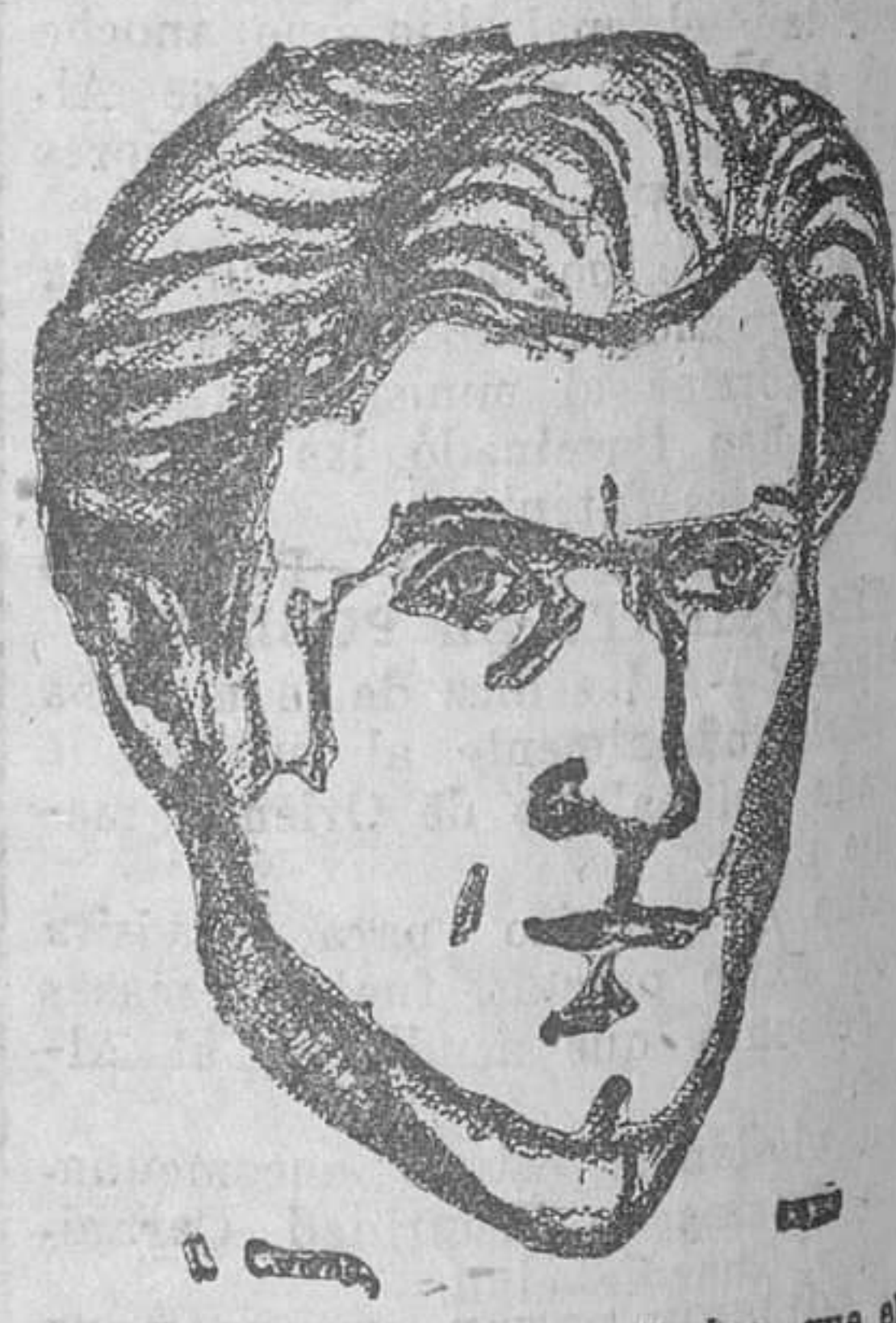
El notable artista santanderino, que el próximo viernes dará un esbozo de un esbozo poético en la Sala Narbón...