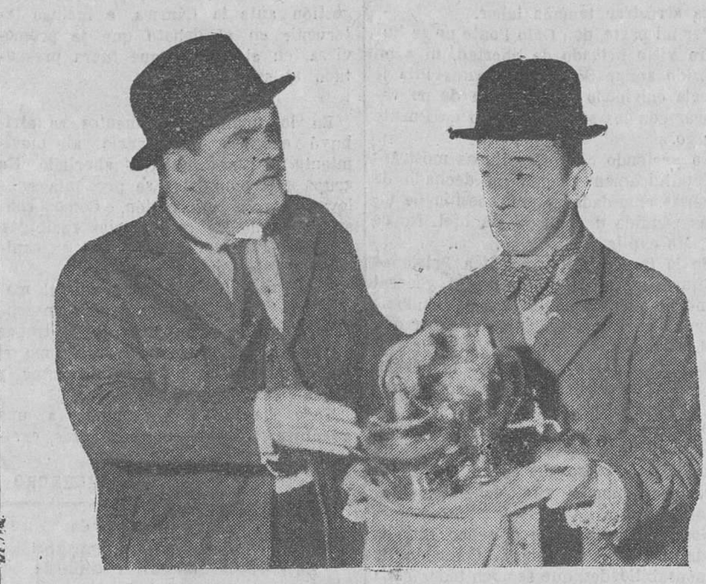
STAN LAUREL y OLIVER HARDY

Es motivo de satisfacción esa sobriedad montañesa exenta de gestos dramáticos; pero en cambio, es de lamentar que tal condición—y hasta si se quiere virtud—traspase límites de prudencia hasta el extremo exagerado de convertirla en falta de tesón para solicitar constantemente lo que sea de justicia.