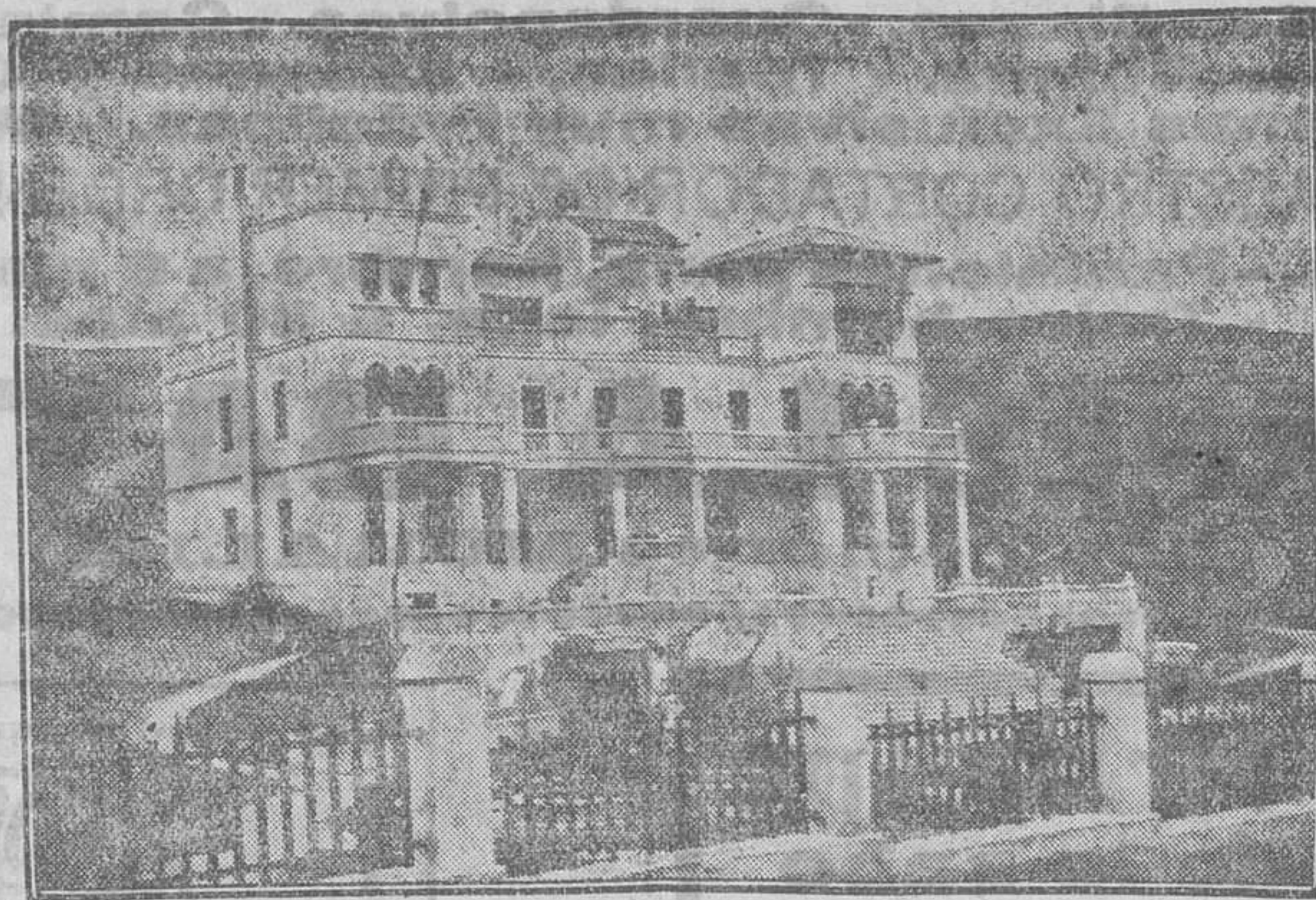
Este Sanatorio está principalmente destinado a las enfermedades de los huesos, músculos y articulaciones en sus afecciones tuberculosas, siendo de inmejorables resultados en los estados pre-tuberculosos, enfermedades de la nutrición, raquitismo, etc., etc. Su bella situación, hermosa instalación y confort le hacen ser uno de los mejores de España.