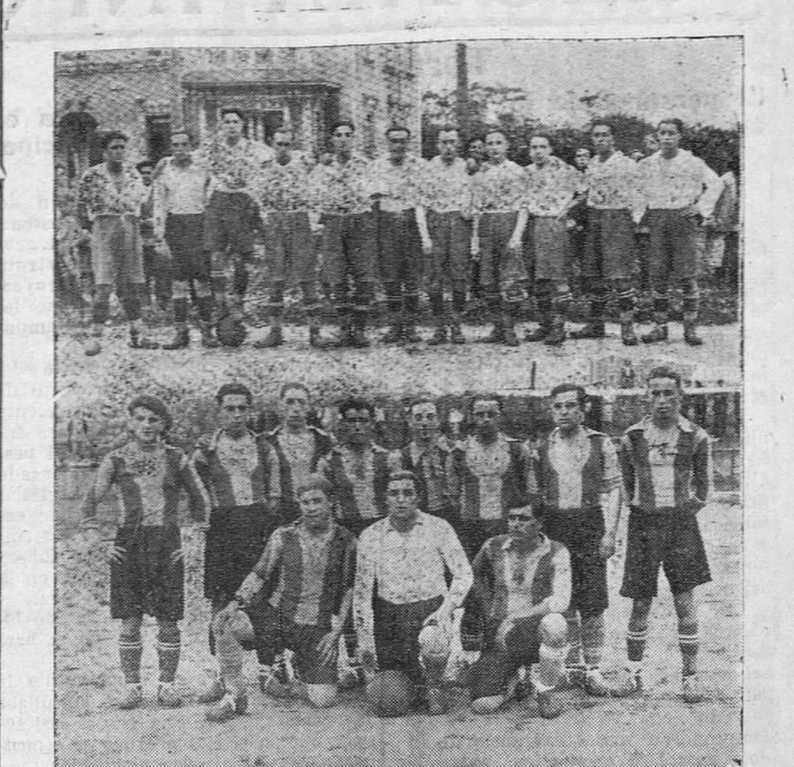
Arriba, el equipo del Madrid F. C., que con el Tetuán se disputó la final de la serie C. obteniendo el triunfo...