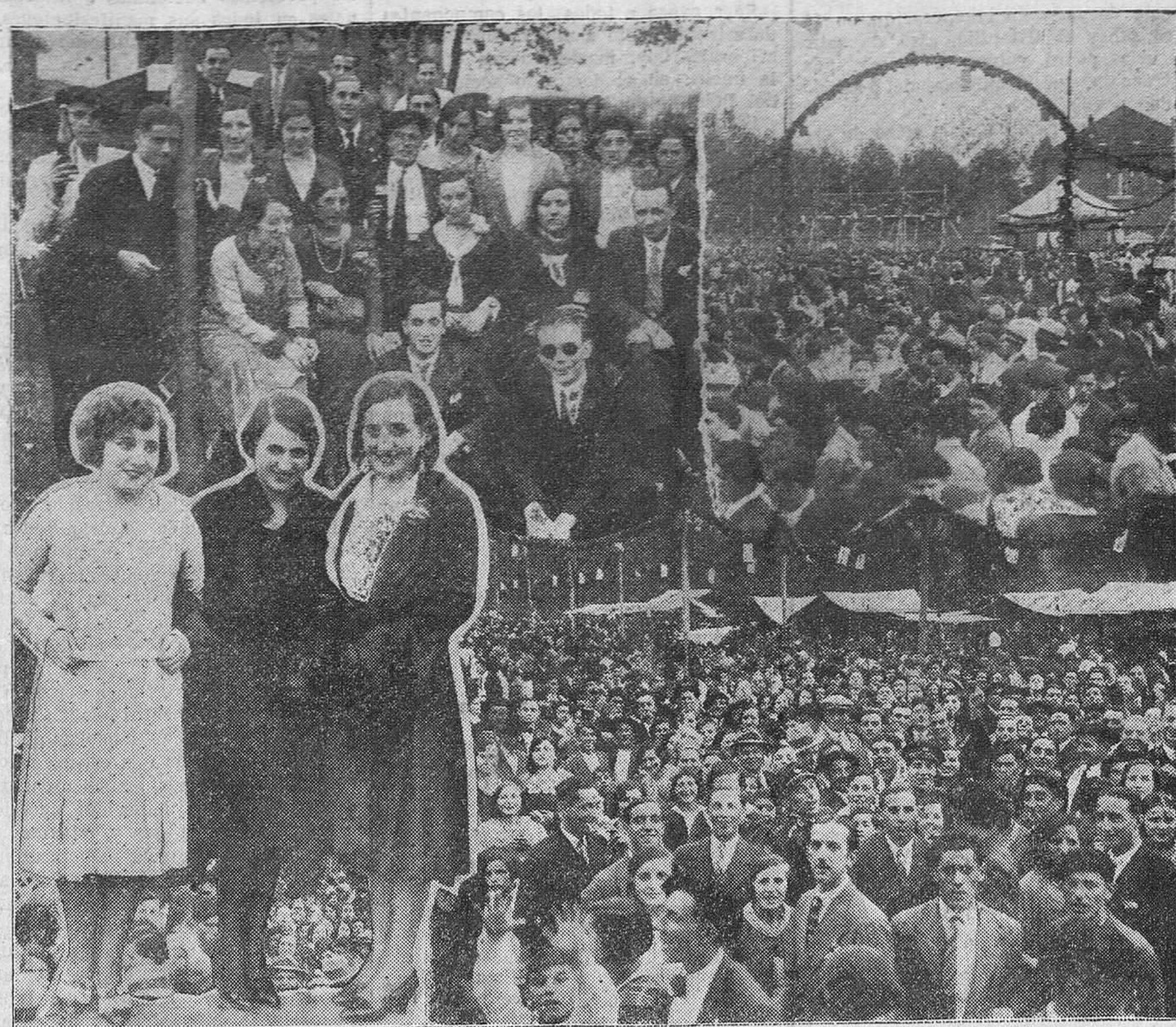
LAS ROMERIAS EN LA PROVINCIA.—Esta de Santa María, de Barreda, no es de las más clásicas; pero sí de las más animadas, por las mujeres bonitas. Véanse las tres muchachas que aparecen en el primer plano y la animación de la fiesta, para convencerse de que España es un país muy grande, al que no le afectan ni la libra alta ni los cambios de régimen para divertirse en todas partes y dentro de la mayor armonía. Aquí podíamos cantar un himno a la juventud; pero no tenemos espacio. Otro día lo haremos...