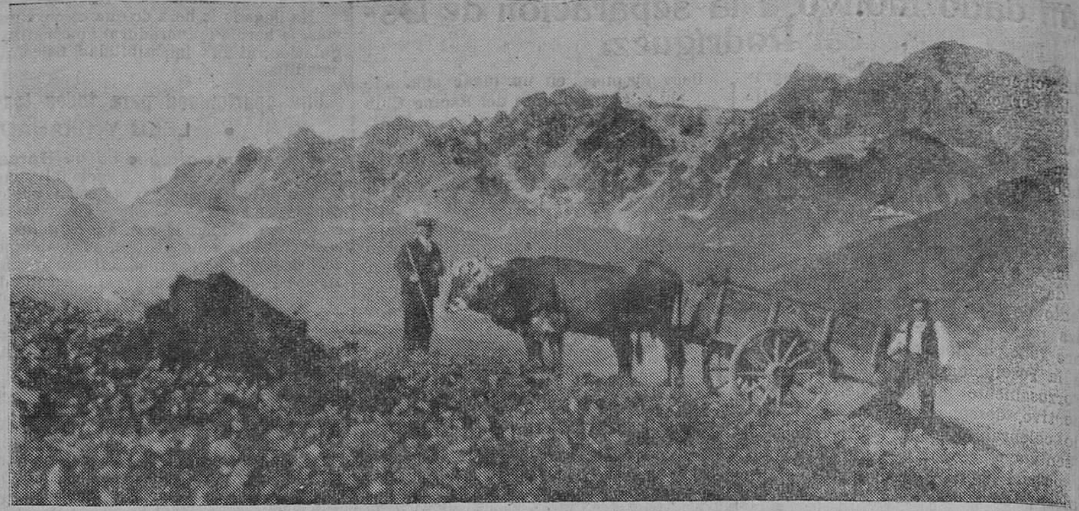
POTES. -- Los labradores lebaniegos preparan la tierra en las propias estribaciones de los Picos de Europa, para efectuar la siembra y recoger más tarde los selectos frutos del país, tan codiciados en otras regiones.