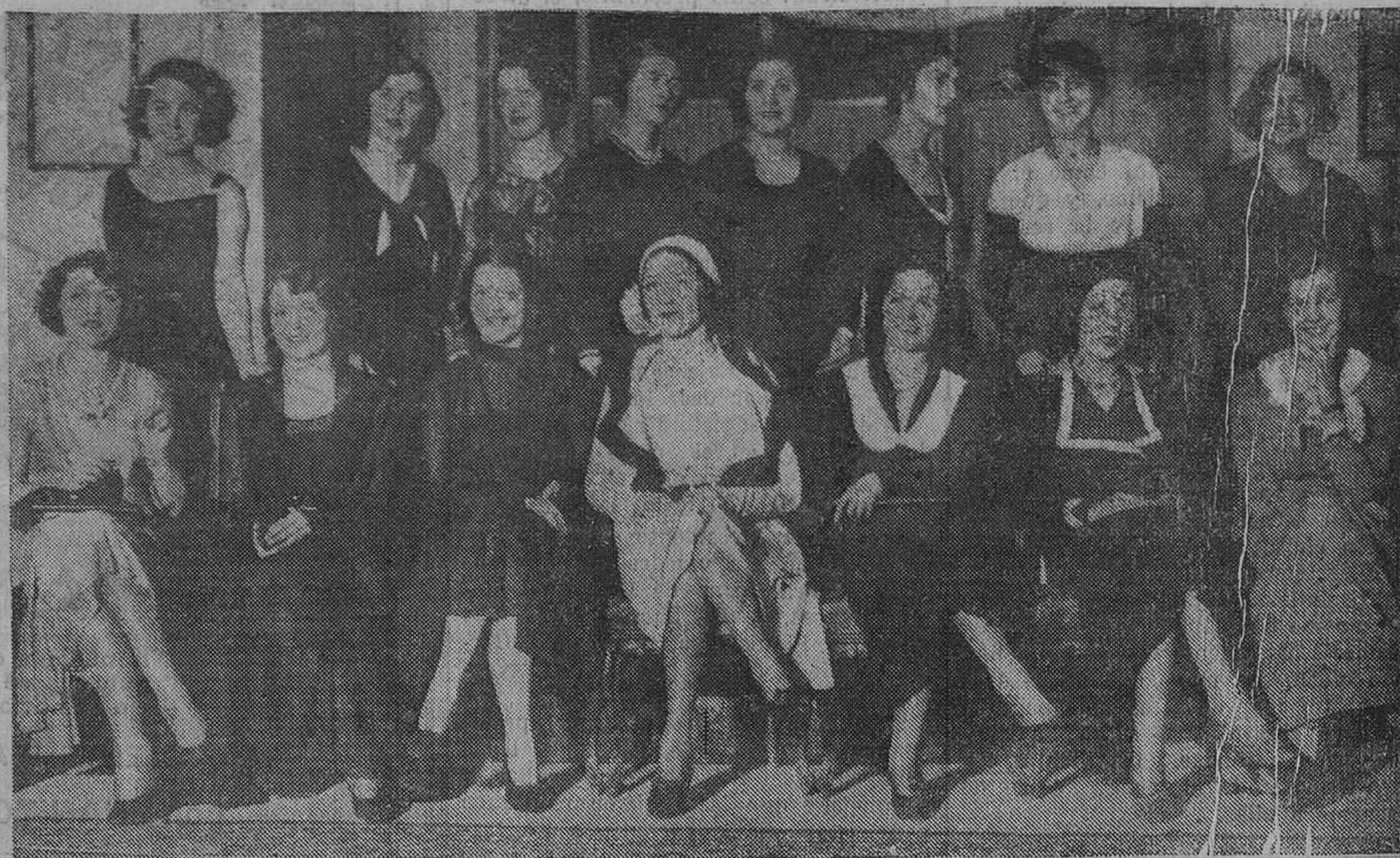
He aquí la primera foto en la que aparecen reunidas las reinas de la belleza de todos los países, por el siguiente orden: sentadas, de izquierda a derecha, Italia, Estonia, Bélgica, Francia, Hungría, Inglaterra y Dinamarca; en pie, de izquierda a derecha también, Yugoslavia, Austria, Rumania, Alemania, Turquía, Grecia, Holanda, y allí, en un rincón, España, con alegría bastante para iluminar toda la foto.

Una Comisión de carteros rurales y de peatones se ha encargado de dirigir las gestiones encaminadas a recabar de la Dirección general de Comunicaciones una solución favorable de la crítica situación que se les ha creado a estos modestísimos funcionarios, por consecuencia de la supresión de los derechos de distribución de la correspondencia. Y esta Comisión ha redactado una nota que ha sido repartida entre todos los interesados, y en la que se marca lo que se ha de hacer en estos momentos tan críticos para los carteros rurales y para los peatones. La Prensa dice—y lo mismo pensarán todas las personas de buena voluntad—