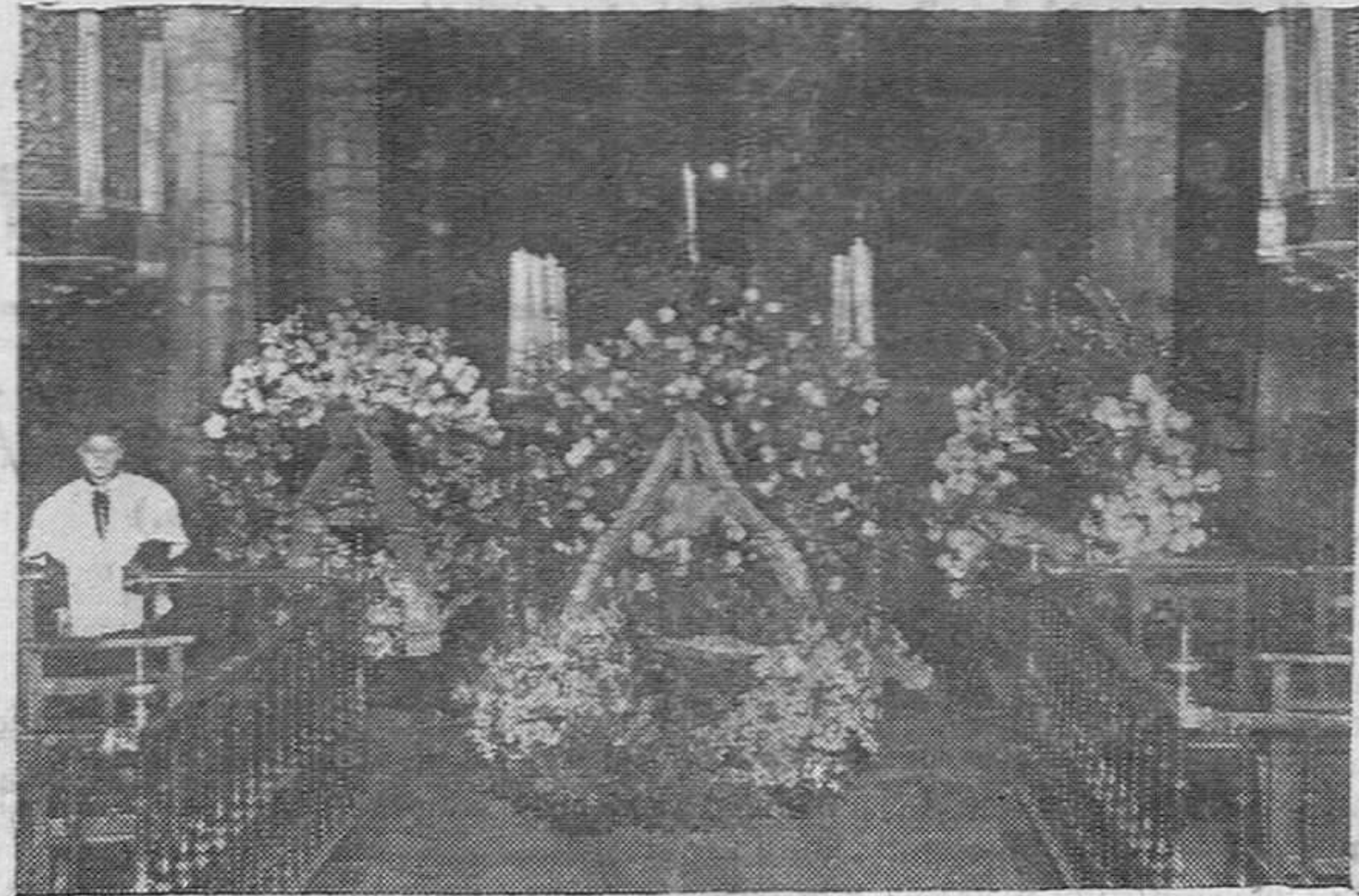
Aspecto del catafalco levantado en la iglesia Catedral para los funerales con motivo del centenario de Simón Bolívar, cubierto de preciosas coronas, confeccionadas en la Casa de la señora Viuda de Rebolledo.