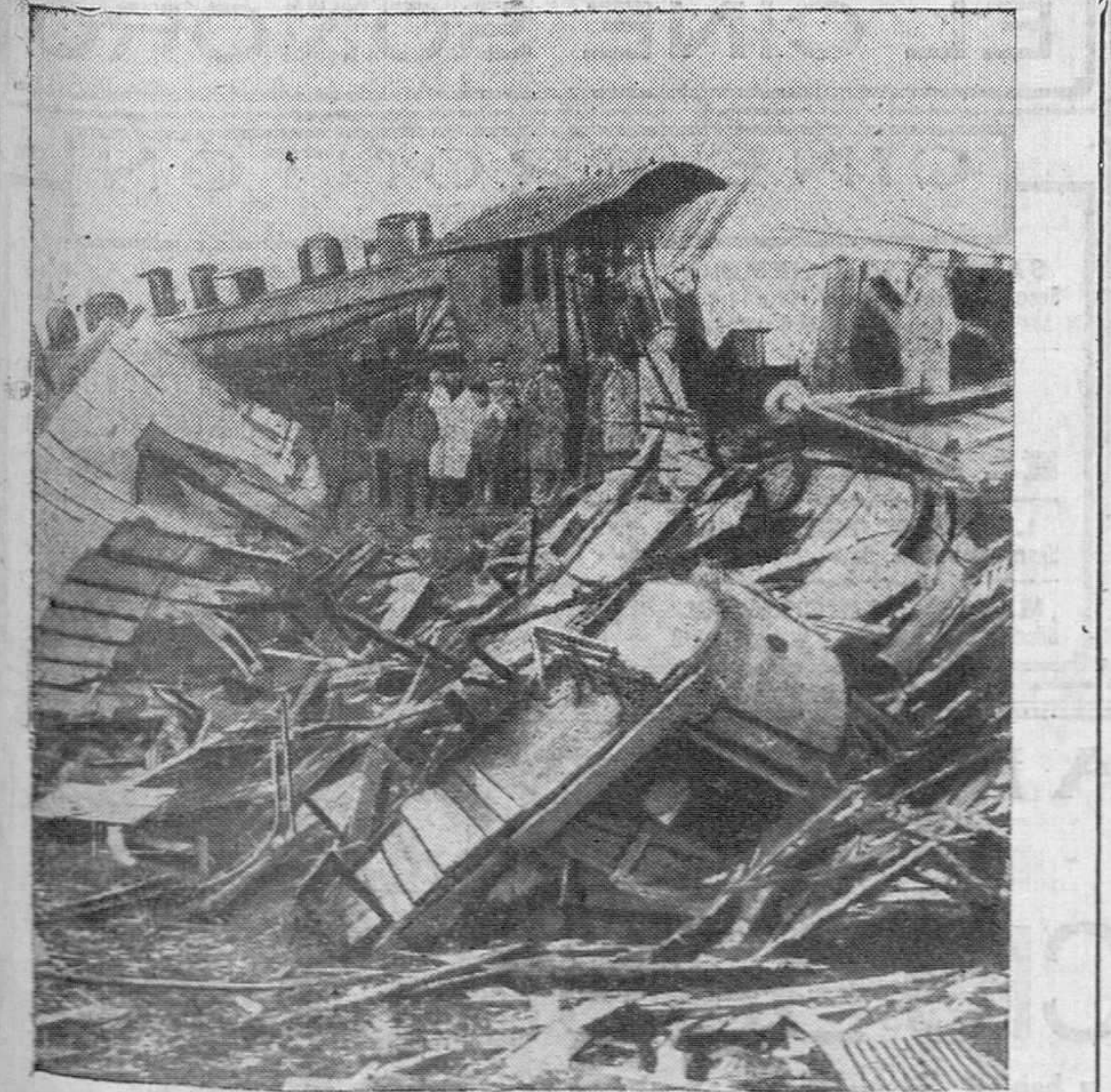
LEON.—CATASTROFE FERROVIARIA. — El informe montón que formaban los restos de los vagones del expreso de Asturias, que chocó con un mercancías en el apartadero de Cuadros. (Foto "A B C").