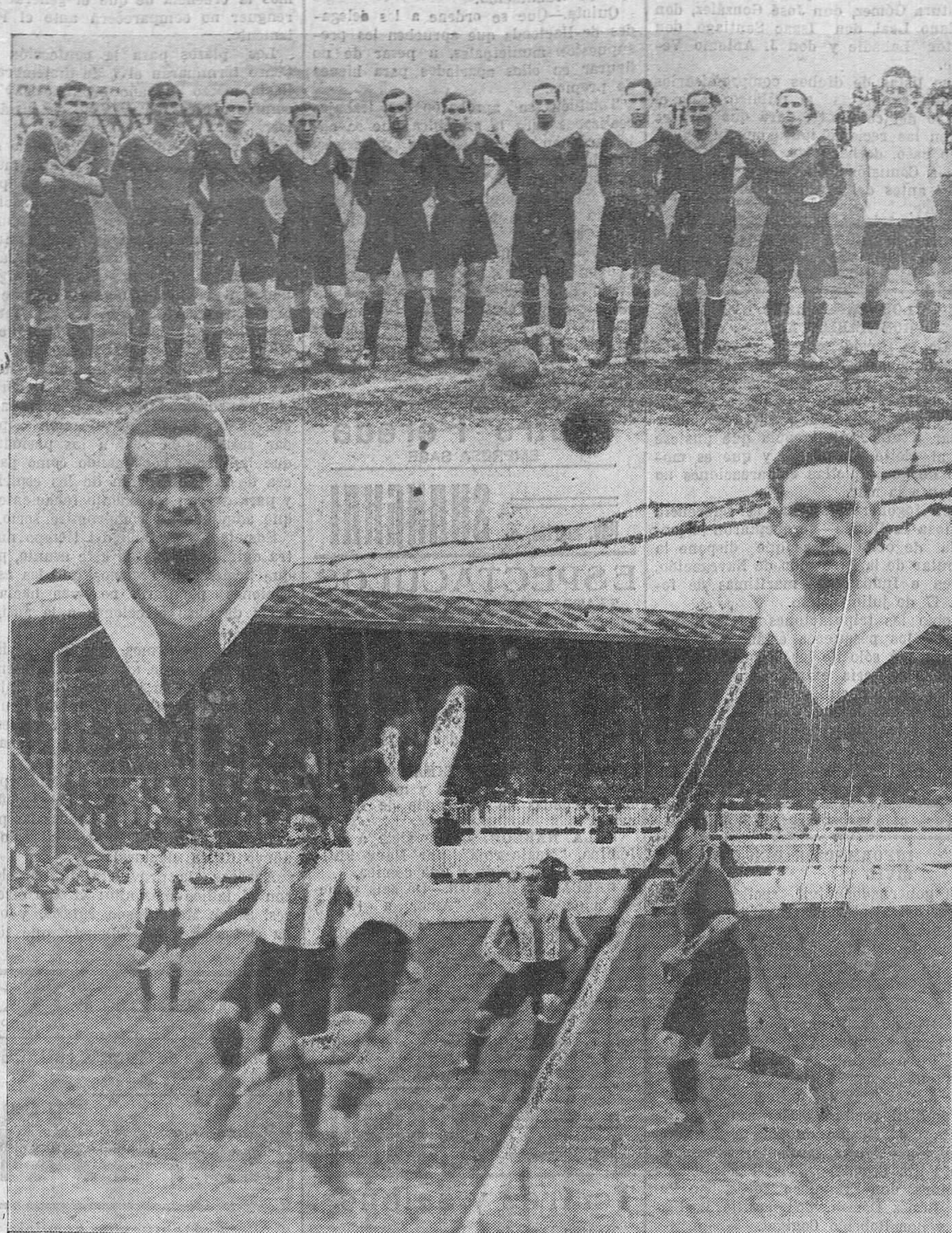
DEL PARTIDO RACING-ECLIPSE, EN LOS CAMPOS DE SPORT. — El once o'clipsista, que el domingo, frente al club campeón, hizo una actuación muy honrosa. — Los jugadores Telete y Cisco, autores de los dos tantos que se marcaron. — Una difícil parada de la s, muchas que hizo Crespo, que actuó tan intensa como acertadamente.

Santiago García Quintanilla Medicina general. Especialista en huesos, músculos y articulaciones. Consulta de 11 a 1 — Burgos, 8, 2.º dcha.