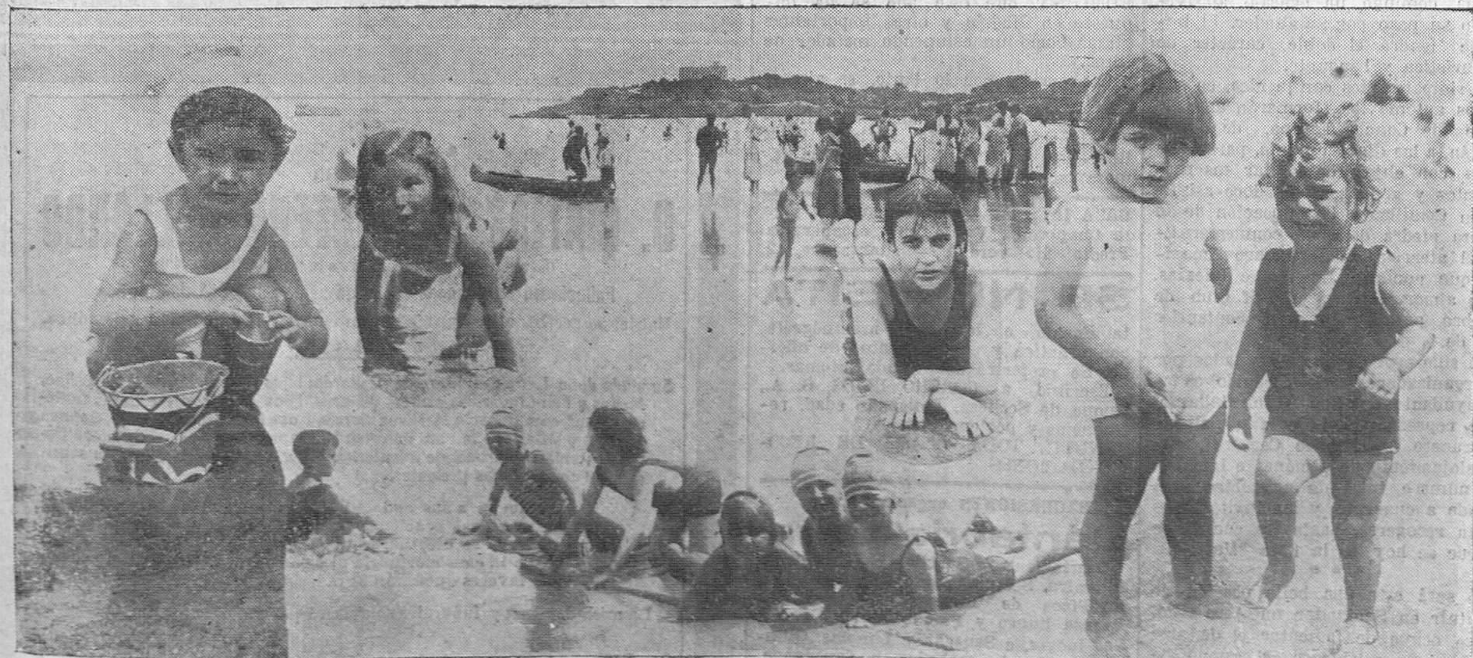
Las playas del Sardinero, animadimasas estos días, se ven llenas de pequeños bañistas, que con sus juegos y risas dan un tono simpaticísimo a aquesto incomparable lugar.

DENTISTA PASEO MENENDEZ Y PELAYO, 30. 2.º