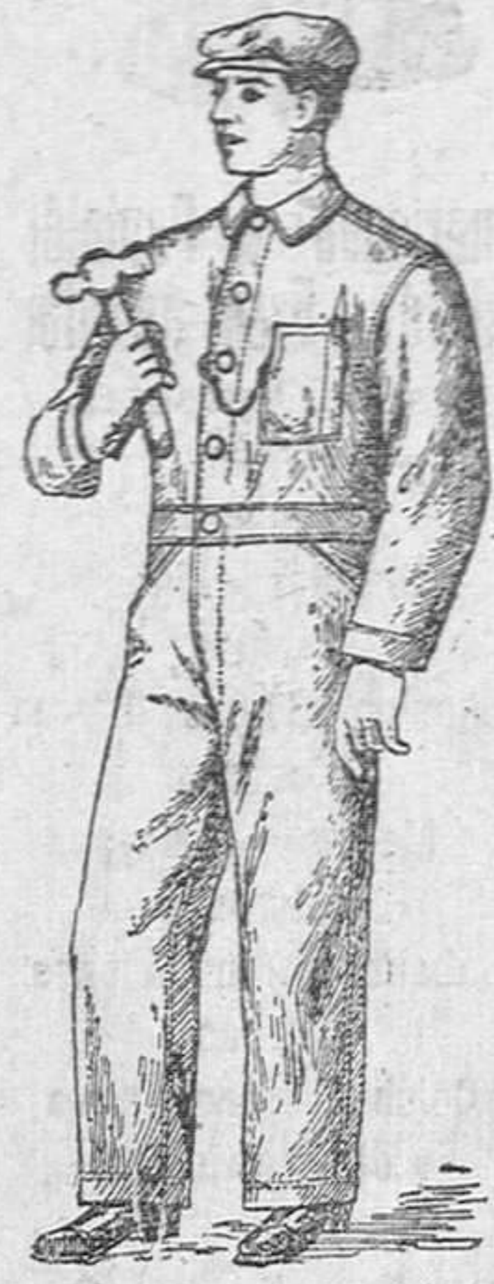
Precio: 18 pesetas.

Deben llevarlos todos los mecánicos, carpinteros y obreros en general, por ser el traje mejor para trabajo.