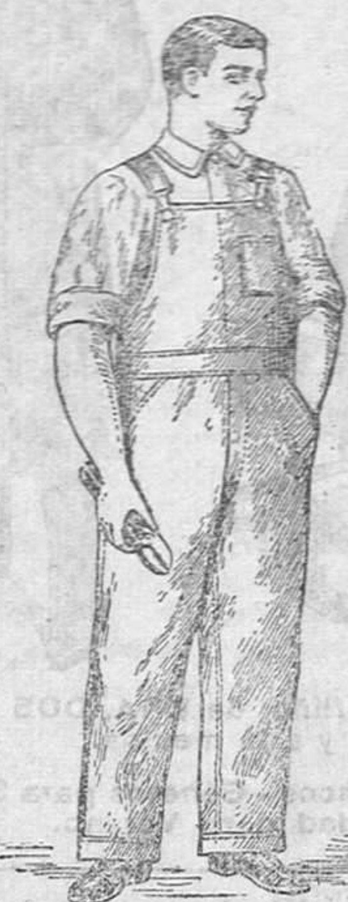
Precio: 12'50 pesetas.

Los más prácticos. Los más económicos, por ser su duración cuatro veces mayor que cualquier otro.