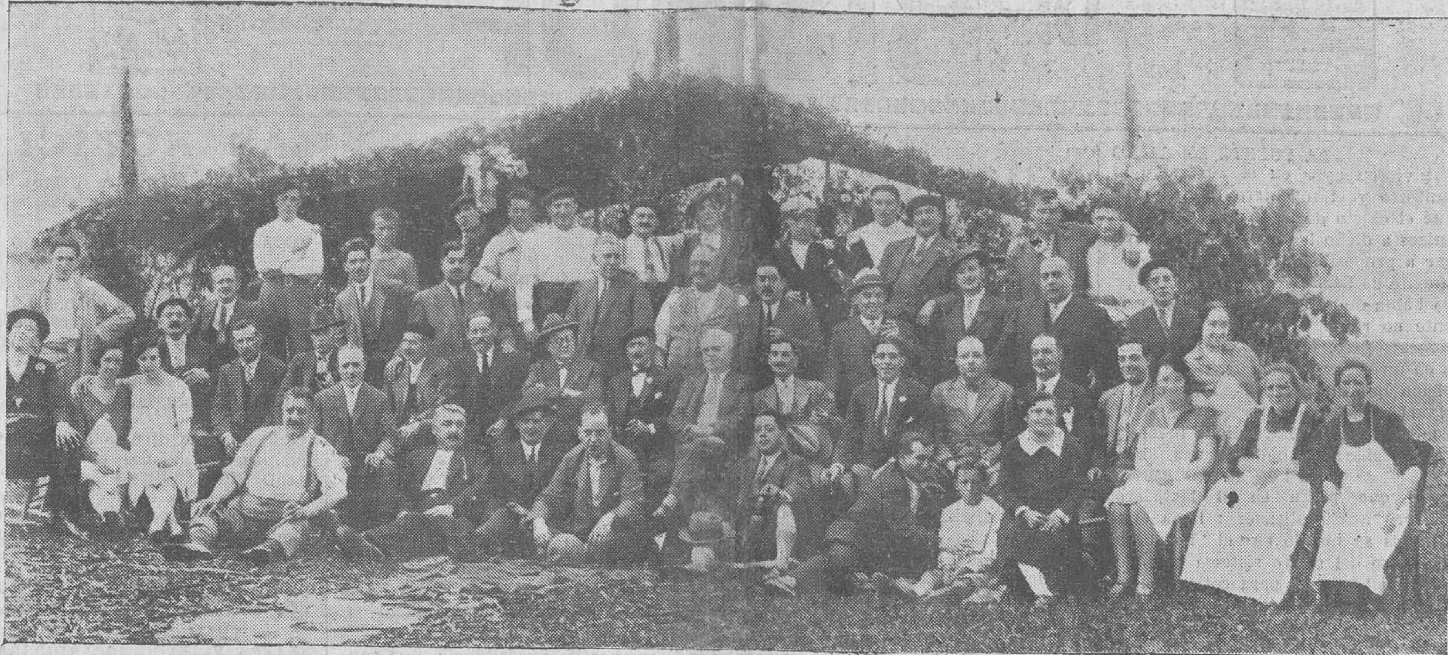
GRUPO DE ESTIMADOS Y CONOCIDOS CONVECINOS, REUNIDOS EL PASADO DOMINGO EN EL PINTORESCO PUEBLO DE BEZANA, EN UNA FIESTA INTIMA Y CORDIAL

¿Vendió la máquina? Sí, hombre, sí; claro que la vendió. ¿Qué menos ha de hacer un varón prudente, en