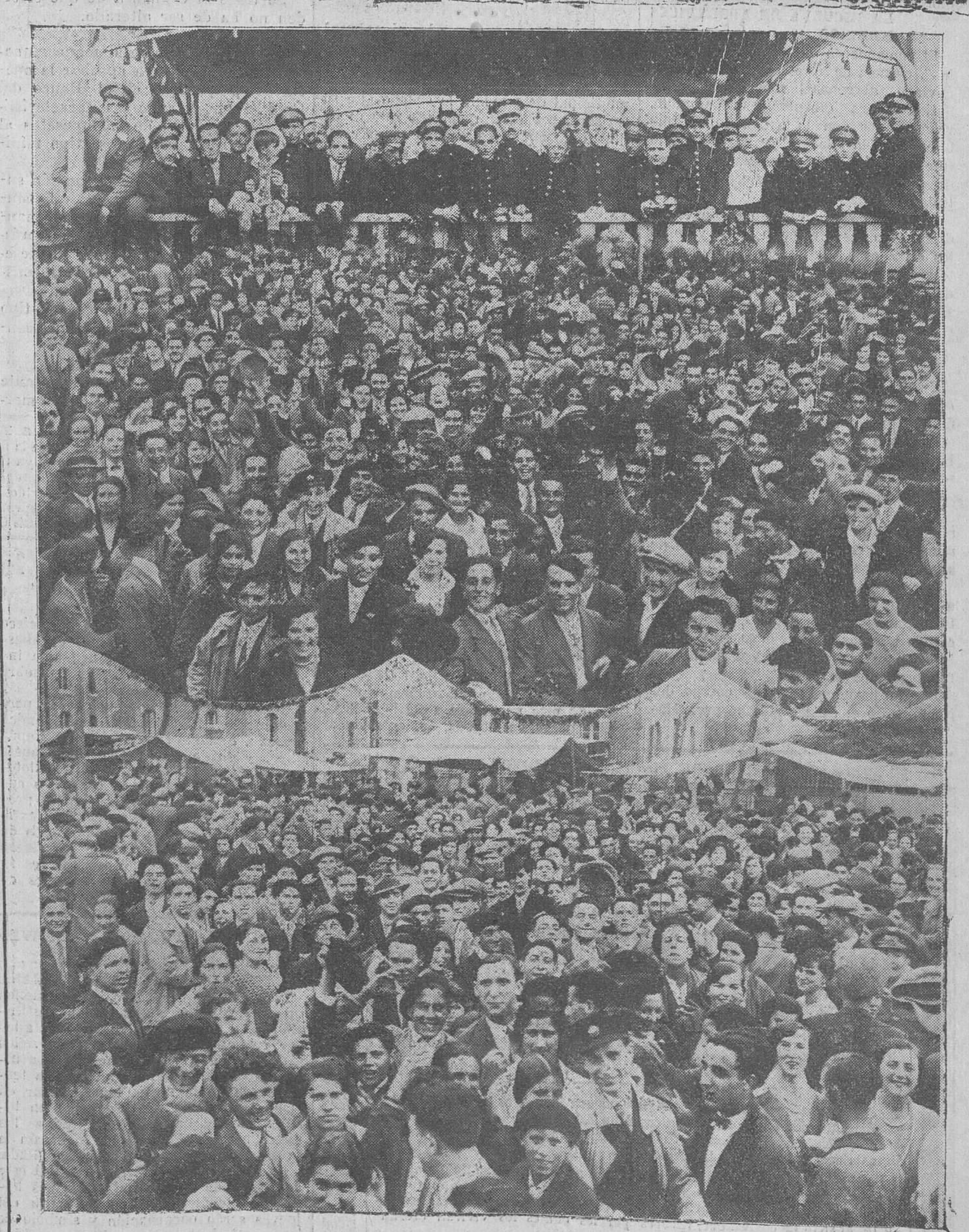
LA ROMERIA DE BARREDA.—LA BANDA DE TORREAVEGA, QUE INTERPRETA PRECIOSOS BAILABLES, Y UN GRUPO DE ASISTENTES A ESTA IMPORTANTE ROMERIA.

Por momentos, sobrepasando los límites calculados, crece la animación.