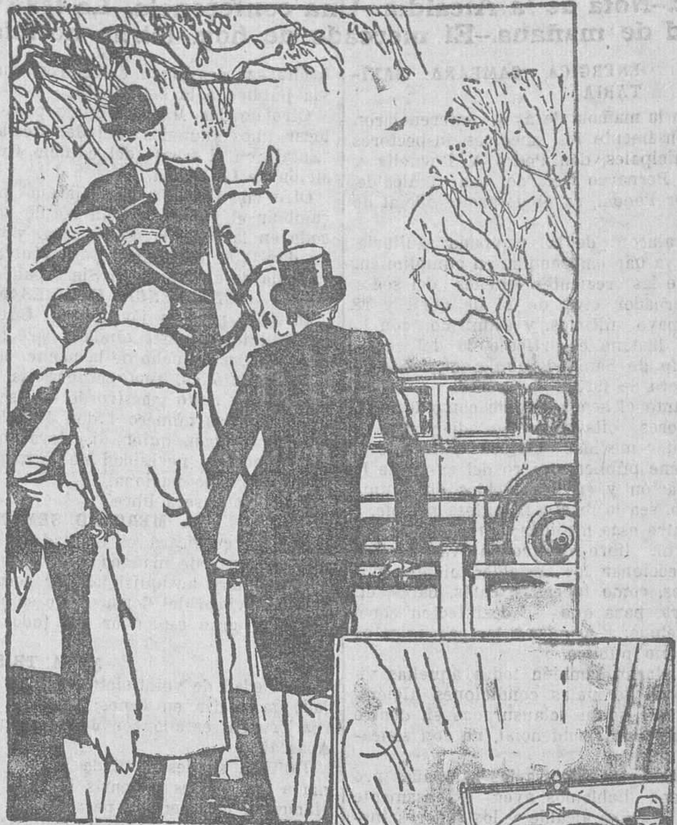
Allí donde se encuentre to gente distinguida se encuentra siempre el Buick