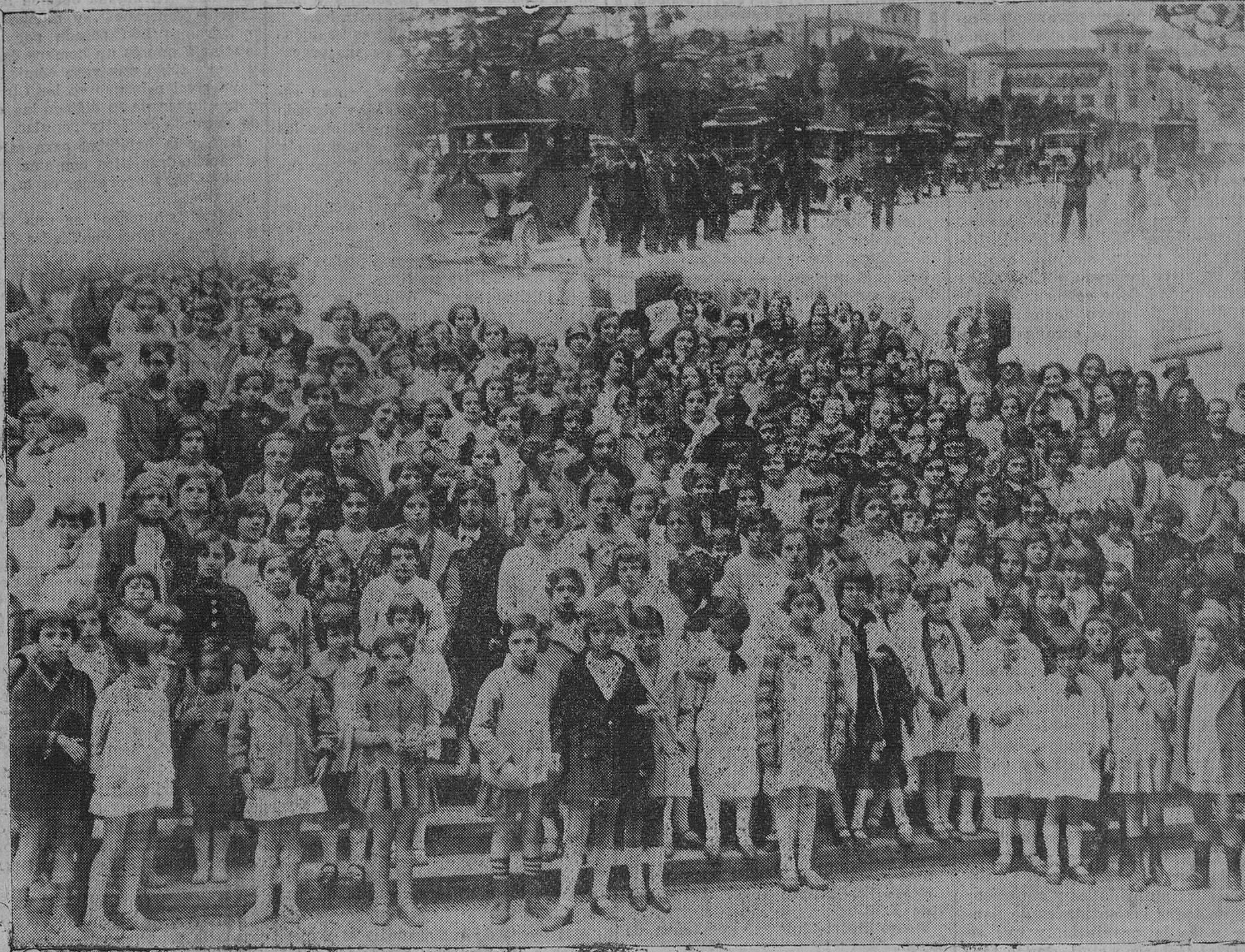
En la mañana de ayer llegaron a nuestra ciudad, en varios autocars, numerosos niños, acompañados de sus maestros, de los colegios del Valle de Igüña, Villafuente, Alceda, San Vicente, Los Corrales, etc., y, después de visitar la población y comer en el Sardinero, regresaron en caravana a sus respectivos pueblos.

Recogiendo el espíritu unánime de los reunidos, partidarios de darse de baja del servicio telefónico, así se acuerda, conviniéndose también en que, una vez así realizado, no se usen los servicios de dicha Compañía más que en casos de absoluta precisión, dándose preferencia a los demás servicios rápidos de comunicaciones.