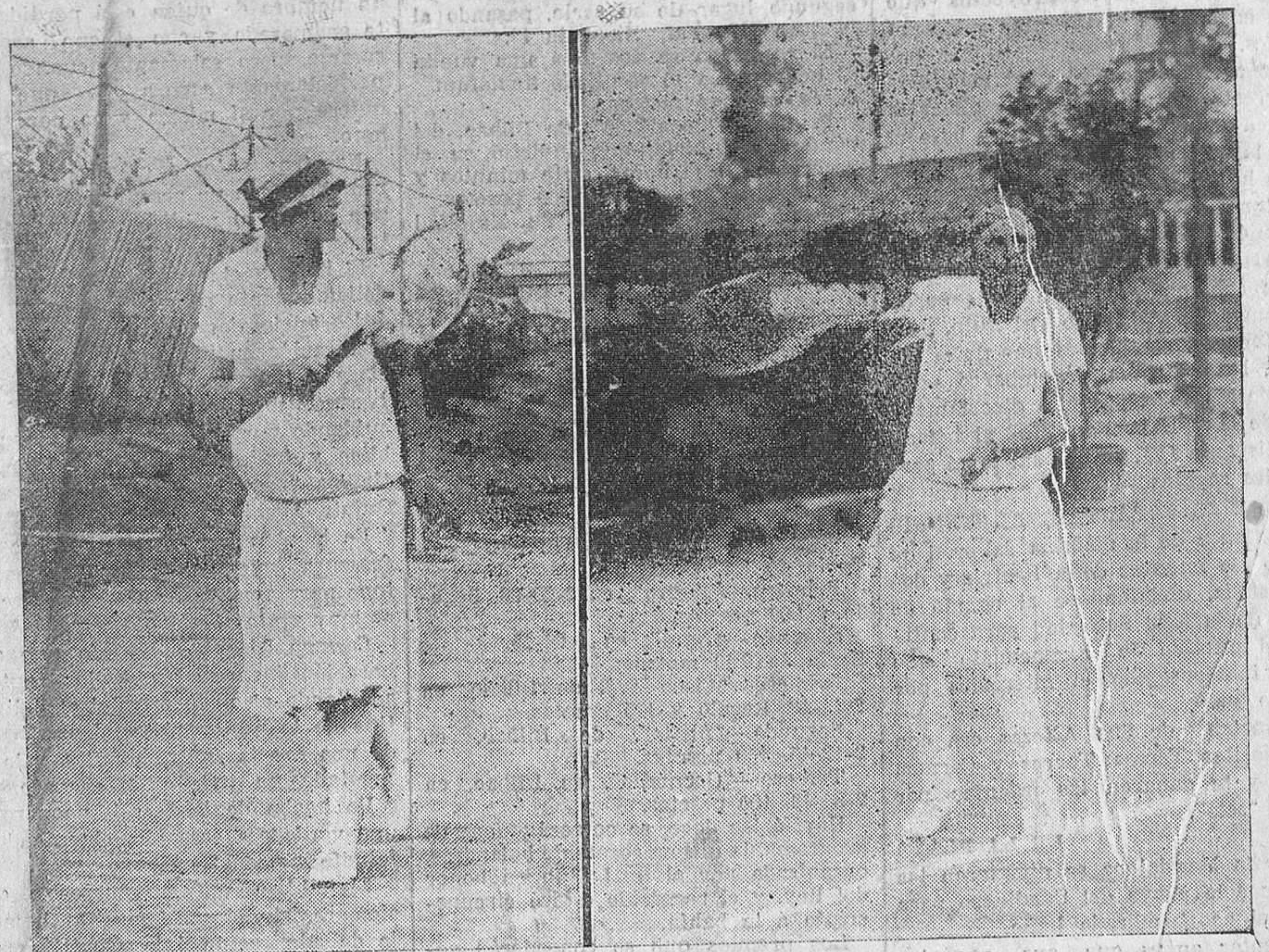
Las infantas doña Beatriz y doña Cristina, inteligentísimas tenniswomen, que se han distinguido mucho en los partidos de campeonato, en dos "poses" características de su estilo, en que predominan la serenidad para la defensa y el vigor y la acometividad en el ataque.

Nuestra enhorabuena cordialísima al feliz matrimonio.