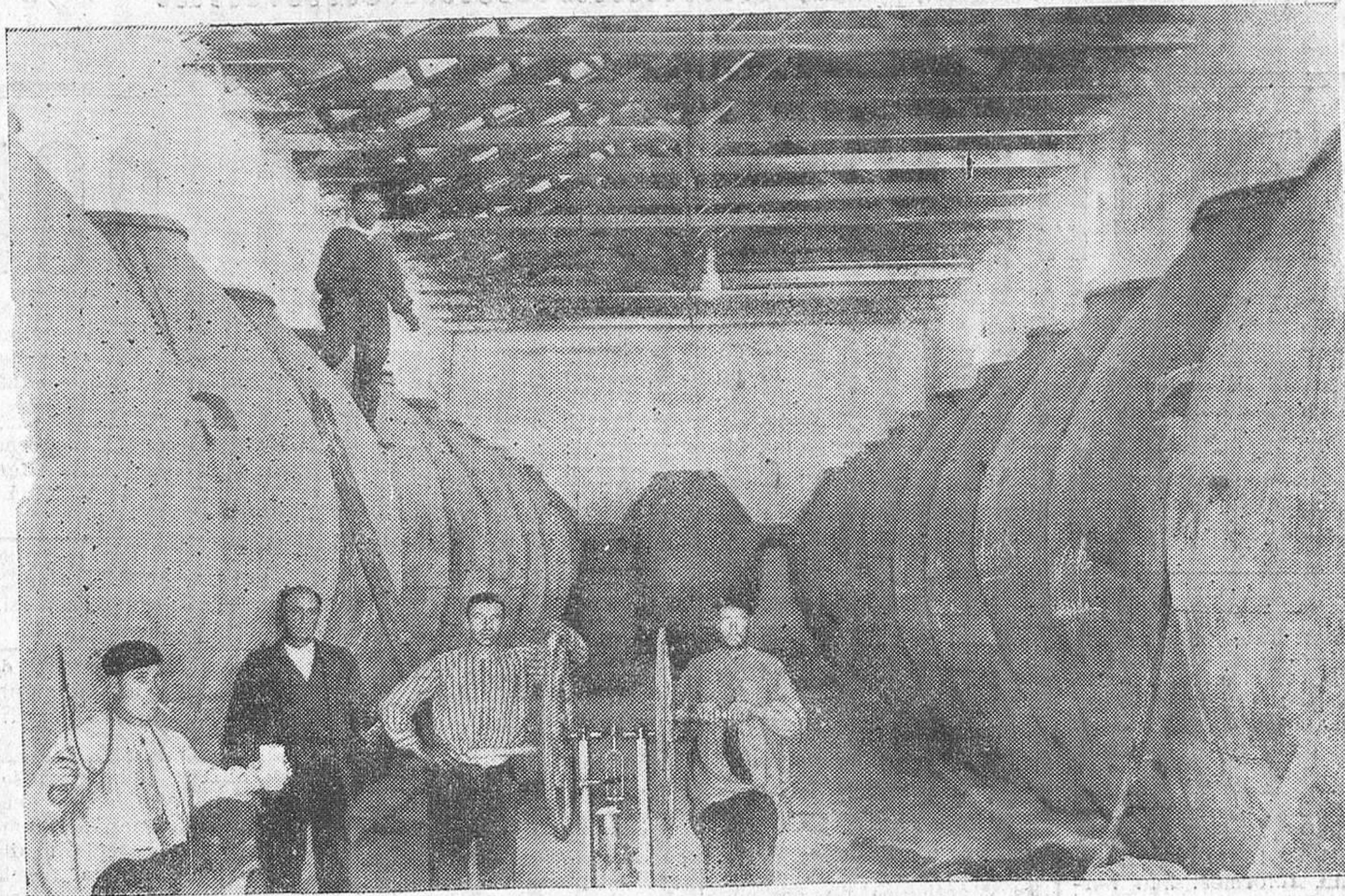
VISTA DE UNA DE LAS BODEGAS DE TOMELLOSC

Ningún industrial debe hacer sus compras sin consultar antes precios y muestras á esta Casa, donde encontrará una gran economía.