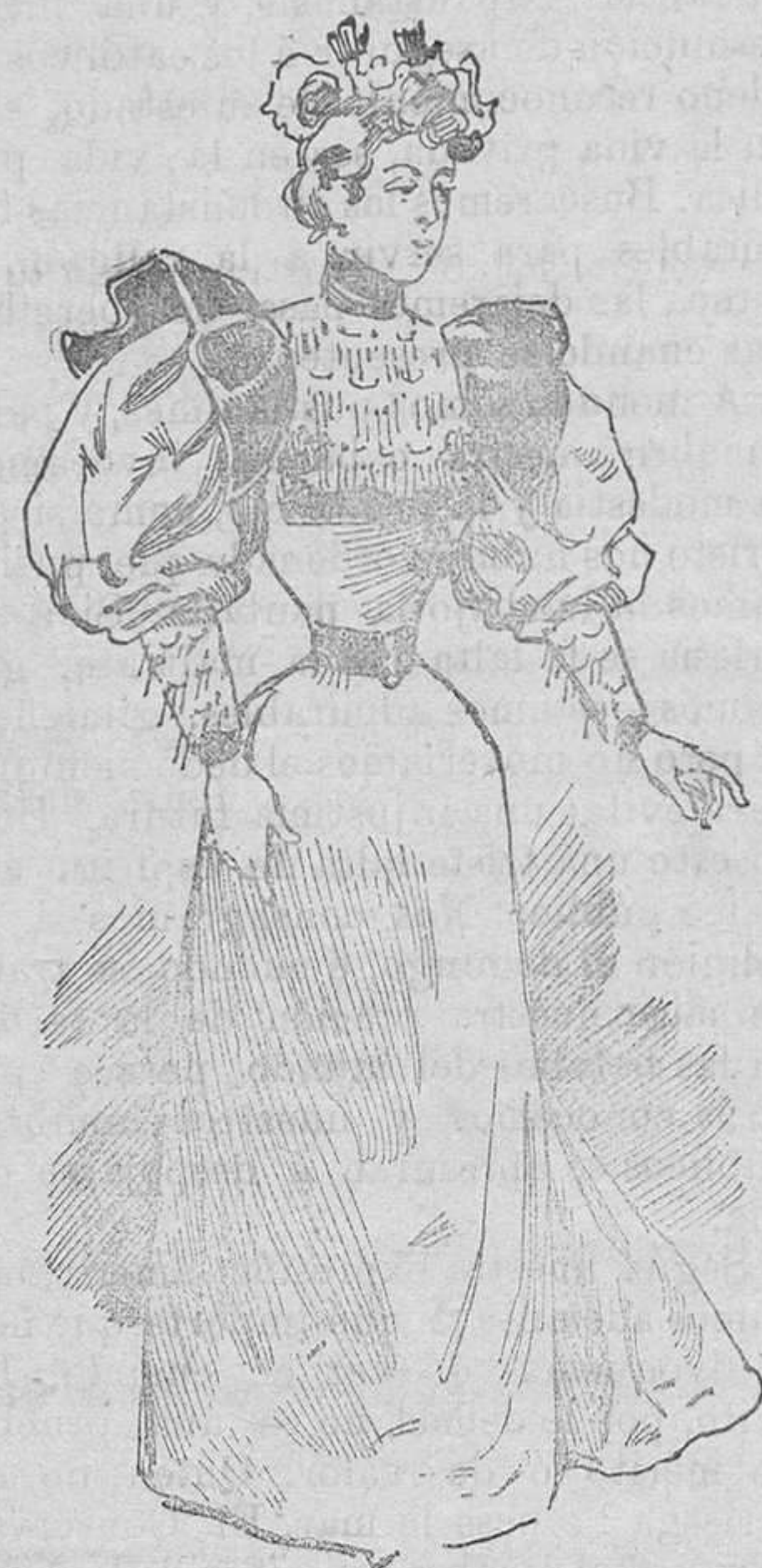
Vestido para paseo

Nada más airoso, más elegante y más sencillo, que este precioso traje duquesa con adornos de encaje y terciopelo, puesto en boga por las jóvenes casadas y solteras de cierta edad y representación.