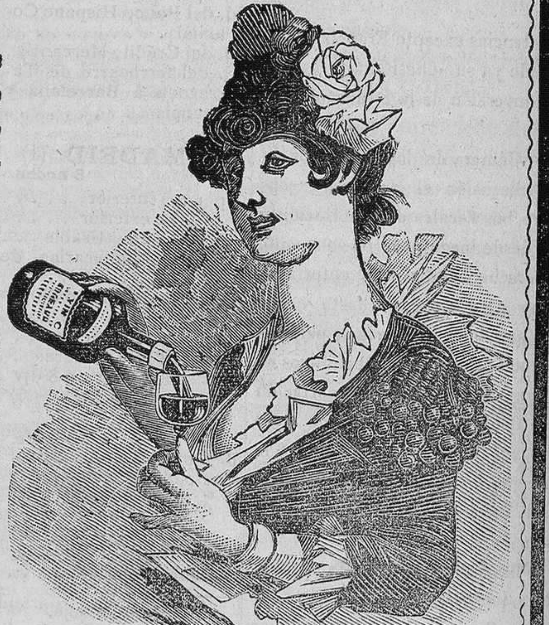
El VINO de BUGEAUD, ha obtenido la recompensa más alta en la Exposición de Higiene de la Infancia de Paris (1887)

El VINO de BUGEAUD se halla en las princip. Farmacias. UNICO DEPOSITO AL POR MENOR en Paris, F.º LEBEAULT, 53, r. Réaumur. Venta al por Mayor: P. LEBEAULT & C.ª, 5, Rue Bourg-l'Abbé, PARIS