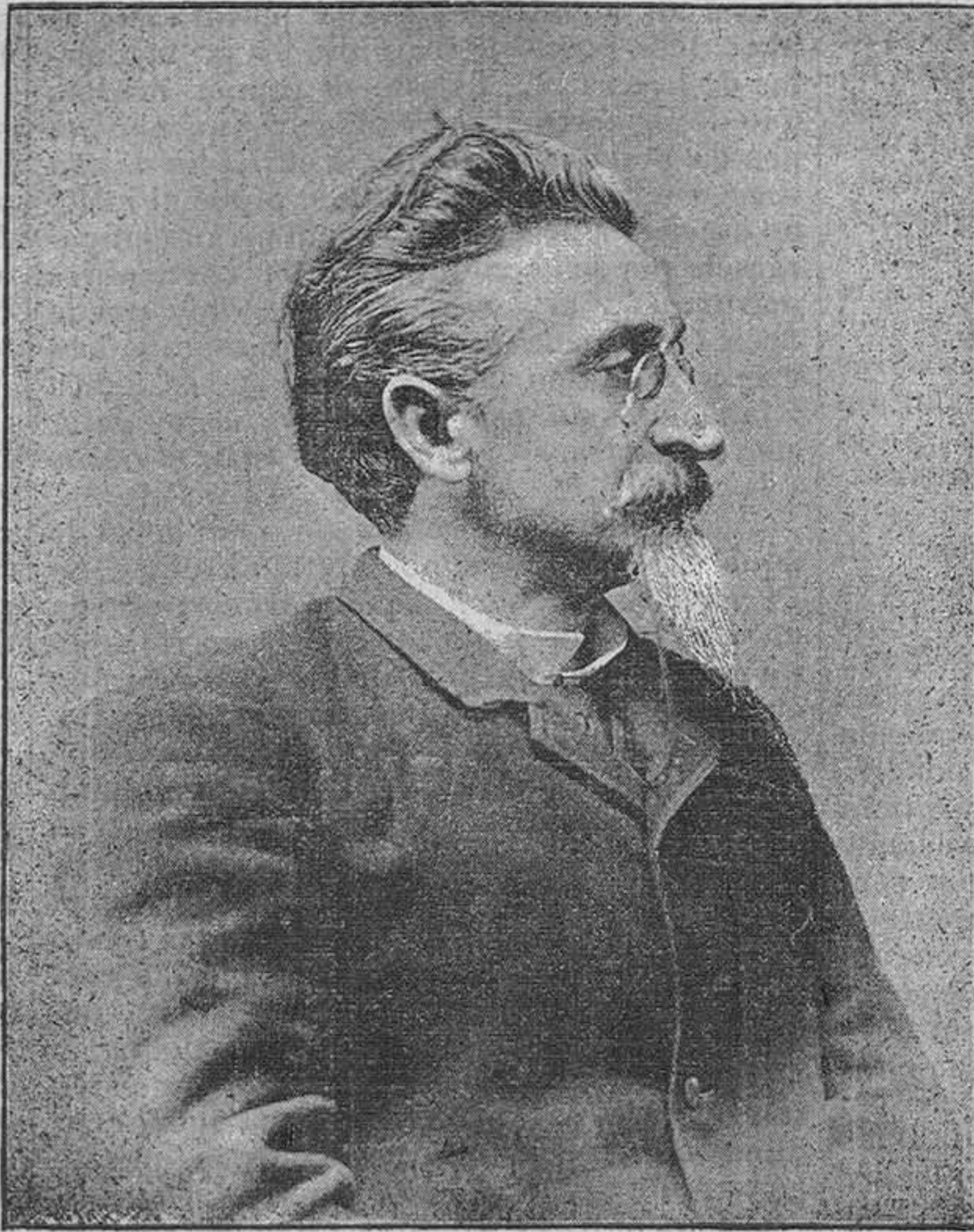
D. JOSÉ MARÍA DE PEREDA.

En la página 41 se presenta por primera vez, sucia, despreciada, mal vestida, despreciada,