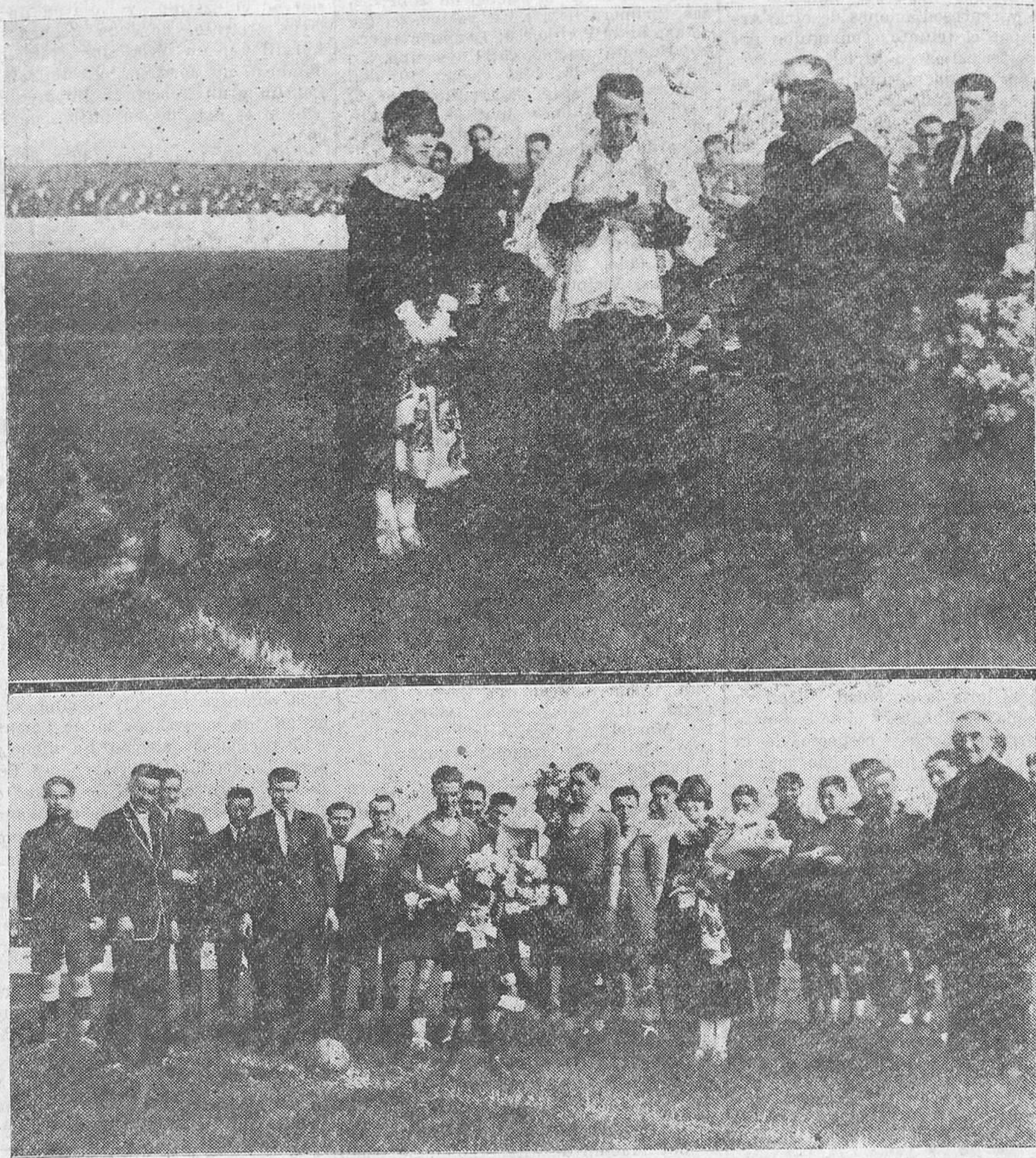
Los interesantes momentos de la bendición é inauguración del magnífico campo del Eclipse, construido en los Arenales.

Accesorios, grasas, neumáticos, gasolina. Automóviles RUGBY, DURANT, CHENARD ET WALKER, CADILLAC CABINAS INDEPENDIENTES Estancias desde 0,50 pesetas diarias. - Servicio permanente.