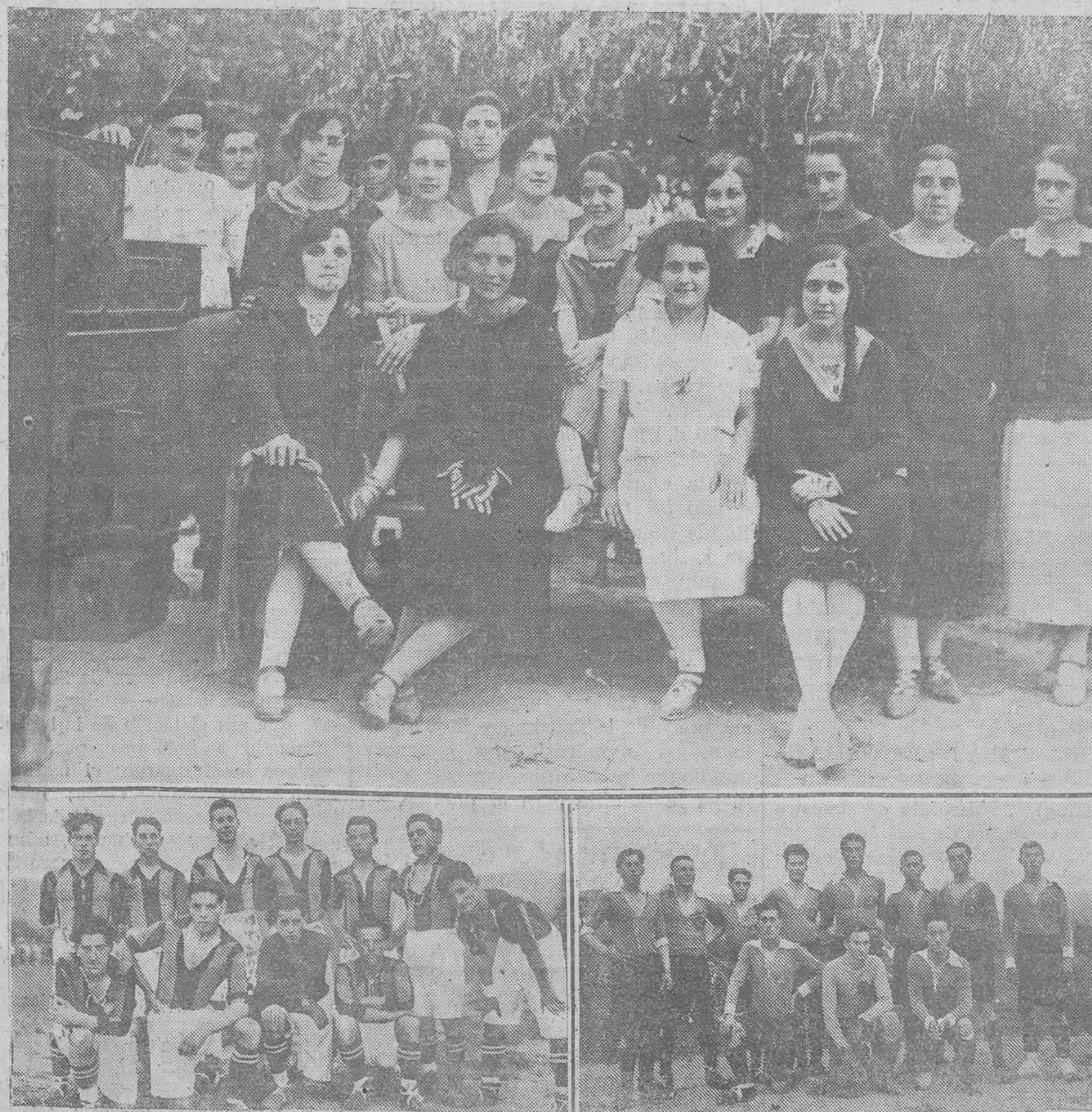
PARBAYON. -- Grupo de hermosas jóvenes que asistieron á las fiestas de San Lorenzo. -- Equipos de Unión Club, de Astillero, y del Muriedas F. C., que jugaron un partido amistoso en el campo de la Unión Deportiva.

EXPOSITORAS!!! Los labores se recibirán el lunes de diez de la mañana á una de la tarde, cerrándose la admisión el jueves á la una de la tarde. Martes y miércoles se recibirán de once de la mañana á una de la tarde y de cuatro á seis. MAS DE CIEN PREMIOS EN OBJETOS Y METÁLICOS!!!