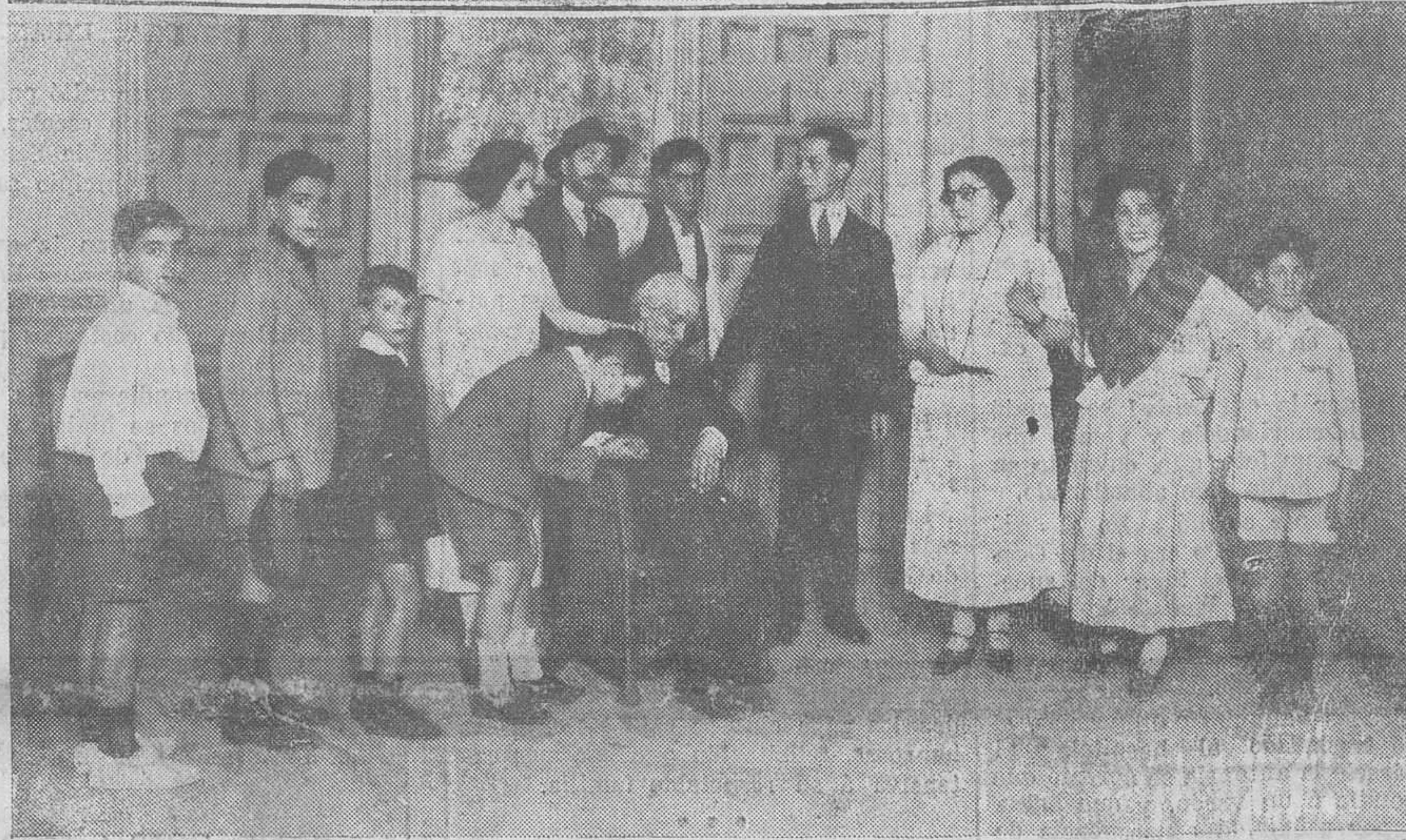
FUNCION BENEFICA EN EL CINEMA. — Los coros de la "Coral de Santander", que interpretaron "La romería de Miéra". — Una escena de "La leyenda del maestro".

Sonó ese timbre que mi oído hierre y alguien me habló desde el Mediterráneo diciéndome: "¡Ojalá! Espere ¡a que se instale el cable subterráneo!" Para hablar a distancia con la gente, con los vecinos ó con las vecinas, ¡es mejor que se monte un excelente servicio de bocinas! Ya verá cómo no hay quien se disguste si este proyecto el Municipio aprueba. Y cuando una bocina nos asuste nos dirán: "¡Para prueba!"