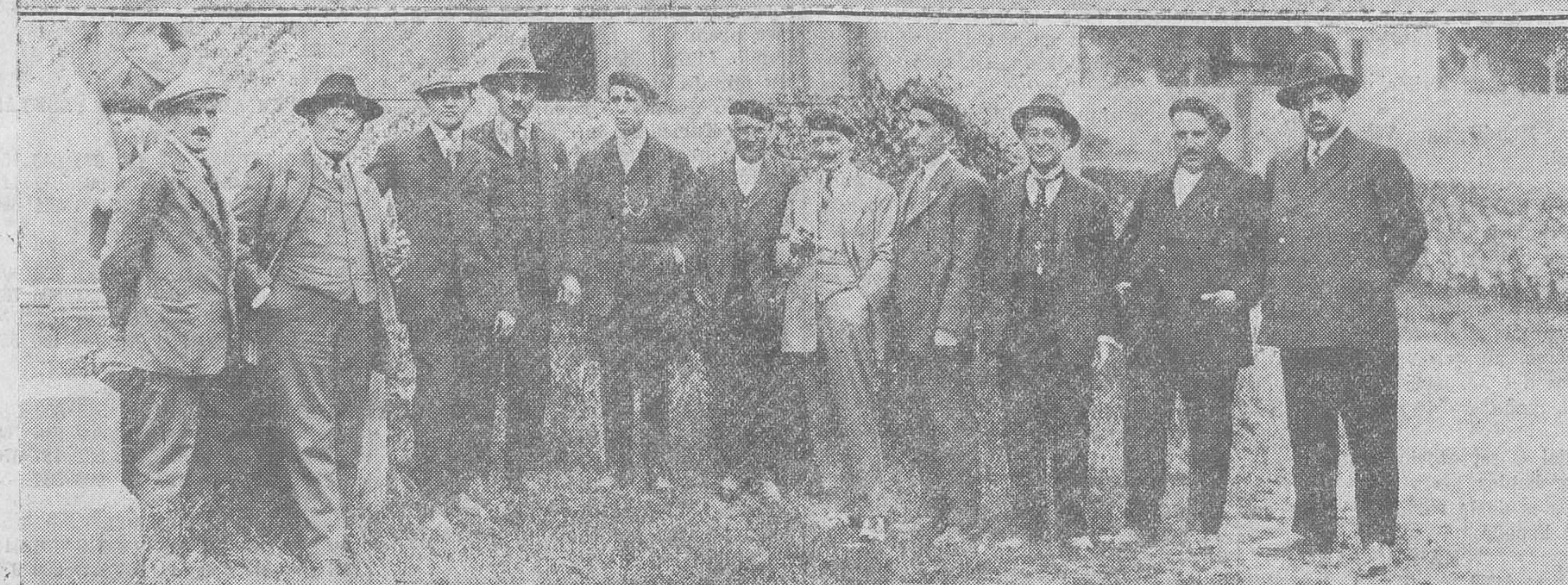
UNA FIESTA EN VALDECILLA. — El orfeón de Solares, que obsequió el domingo con un concierto al señor marqués de Valdecilla. — El alcalde de Medio Cudeyo con la Junta directiva del orfeón.