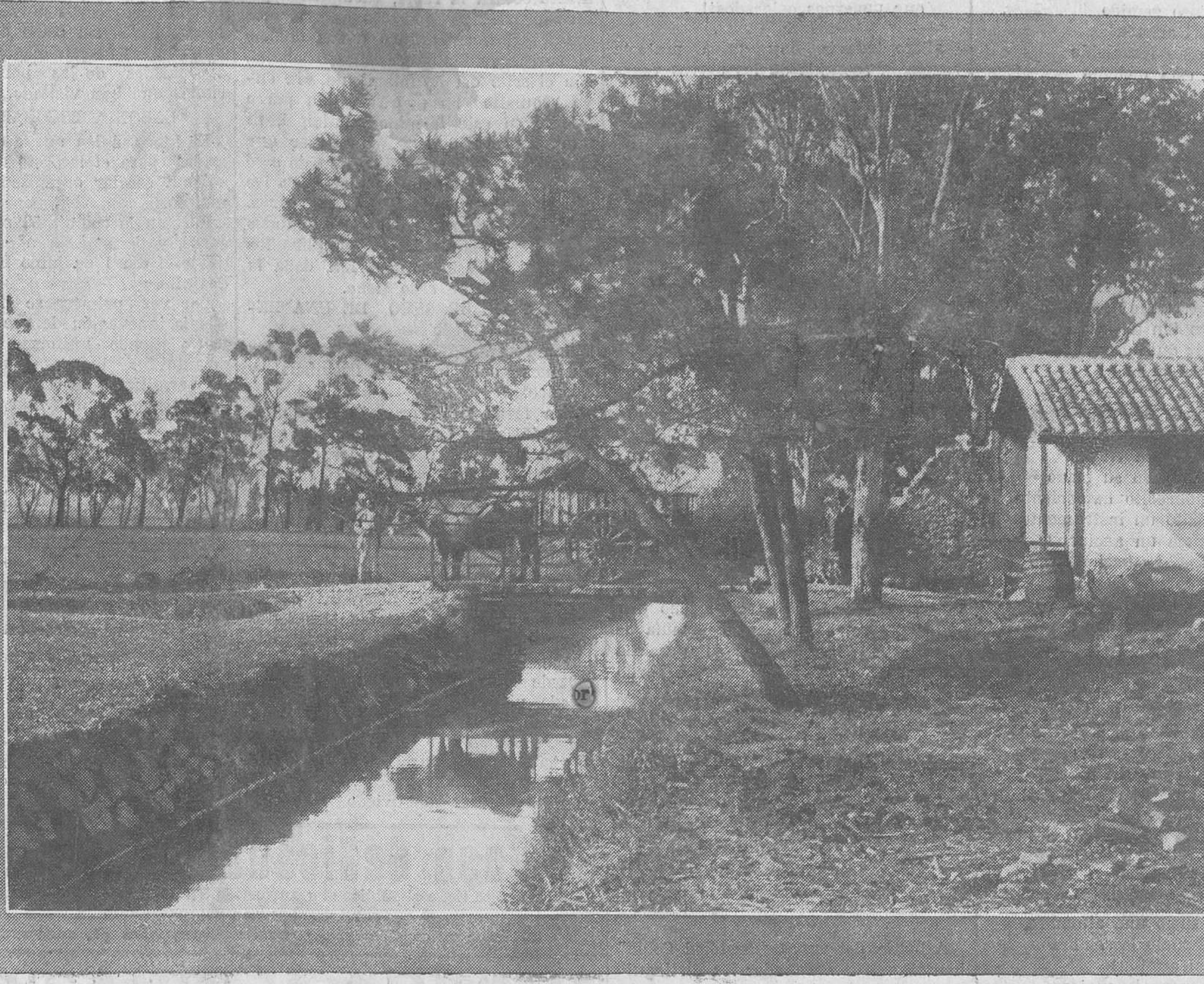
PAISAJES MONTAÑESES. -- Un detalle de la "Granja Aiday", en Maliaño.

"Otro ejemplo: Egipto necesitó cinco locomotoras. Siete países ofrecieron condiciones: Alemania, Inglaterra, Austria, Bélgica, Holanda y Suiza. Francia estuvo ausente del concurso. Una Casa alemana se ofreció á construir las lo-