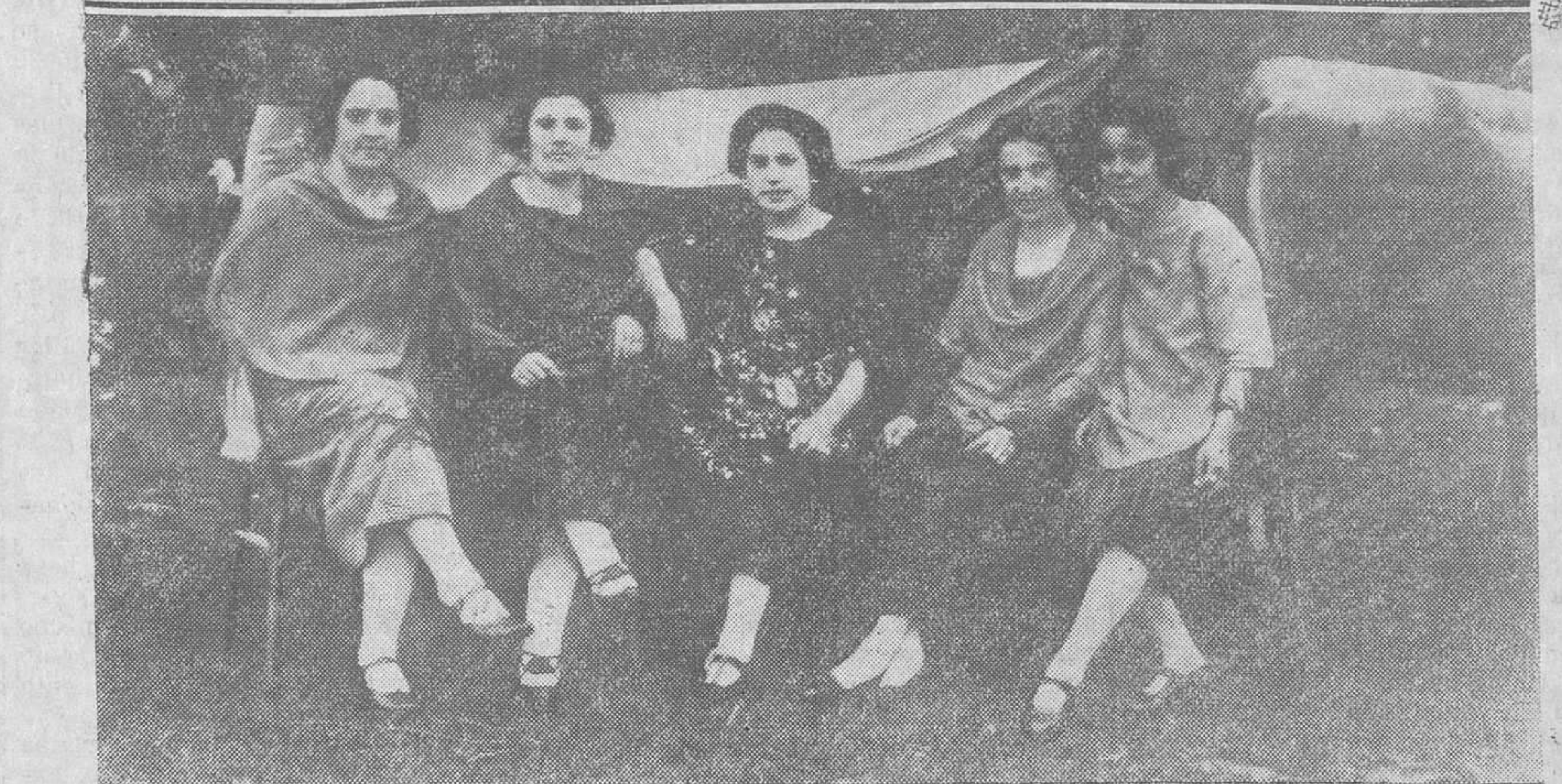
LAS FIESTAS DE SAN ISIDRO, EN HERAS. — El Athletic Club. — El capitán del equipo después de entregar un ramo de flores a la señora del director de las minas. — Grupo de bellas señoritas que animaron con su presencia la romería del Santo.

mente, puesto que son varios los que quedan abiertos toda la noche.