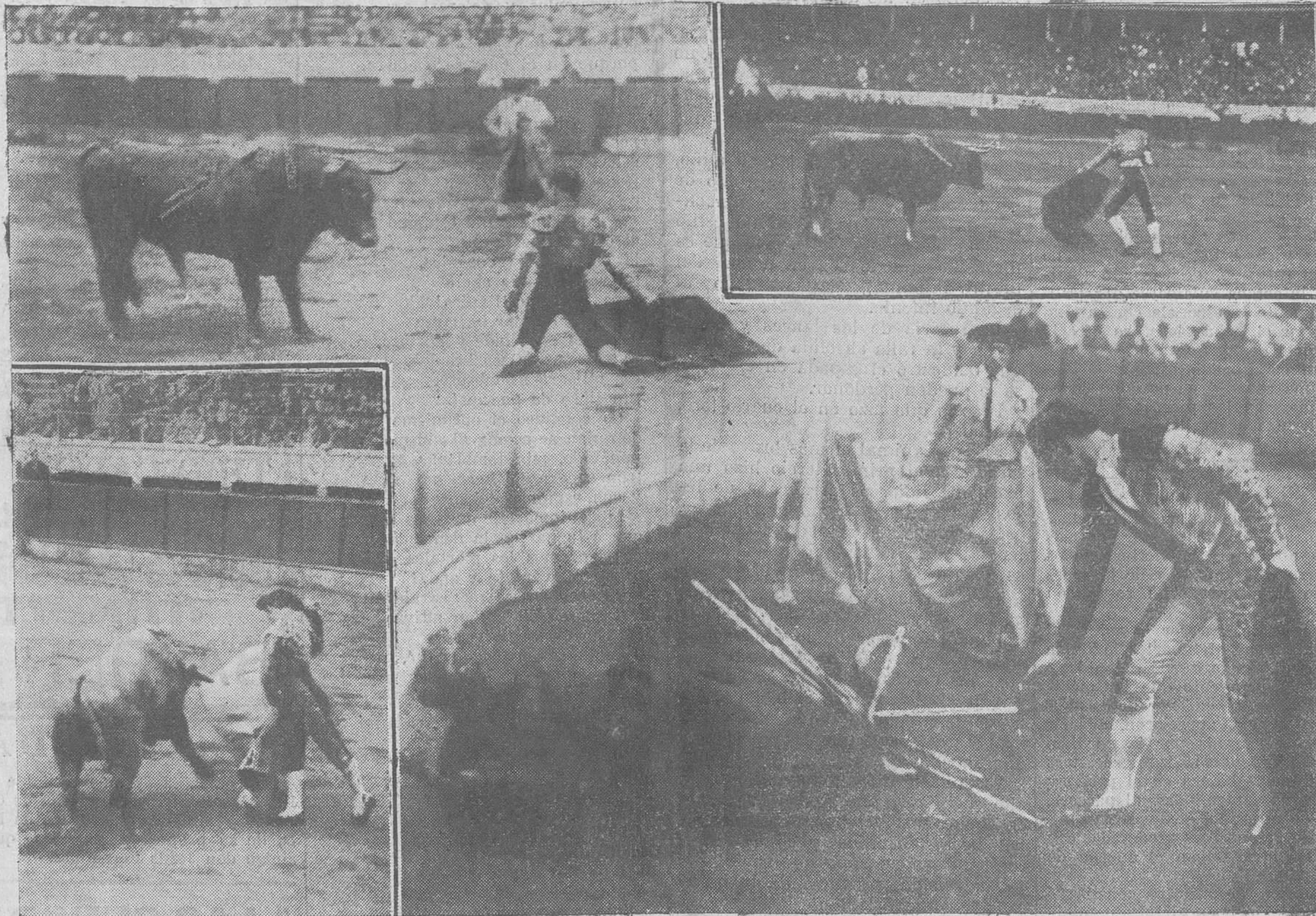
LA NOVILLADA DEL DOMINGO. -- Cuatro interesantes detalles de las faenas que realizaron Torquillo III, Belmonte y Félix Rodríguez.

La abundancia de dinero que produce la falta de una emisión de Tesoros ha determinado a muchas en-