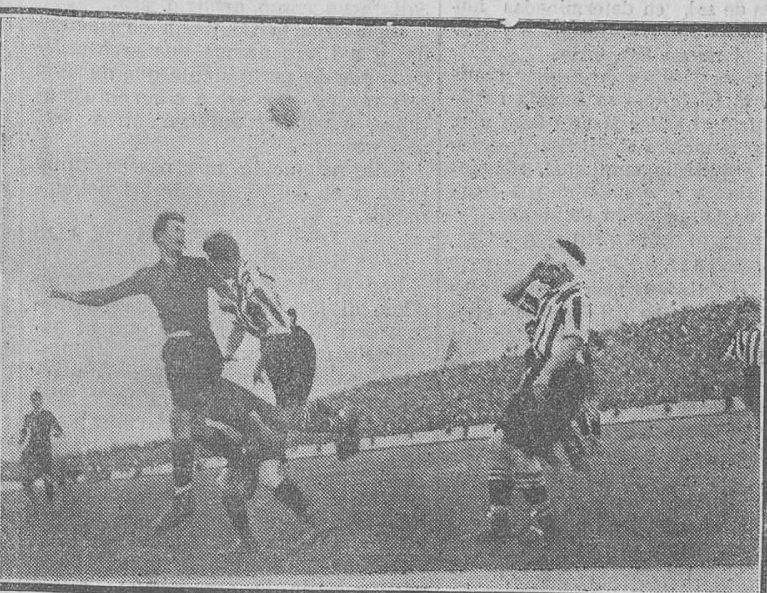
Dos interesantes jugadas del partido Athletic-Arenas, en San Mamés.

gan al estudio y á la reflexión, á algunos hombres de valía, que pueden gobernar bien al país, pero que jamás saldrán á la calle á llamar al elector, con el ruido de unas castañuelas. Ellas y las sonajas de la pandereta deben perder toda su influencia en las horas en que exprese su santa voluntad el pueblo soberano.