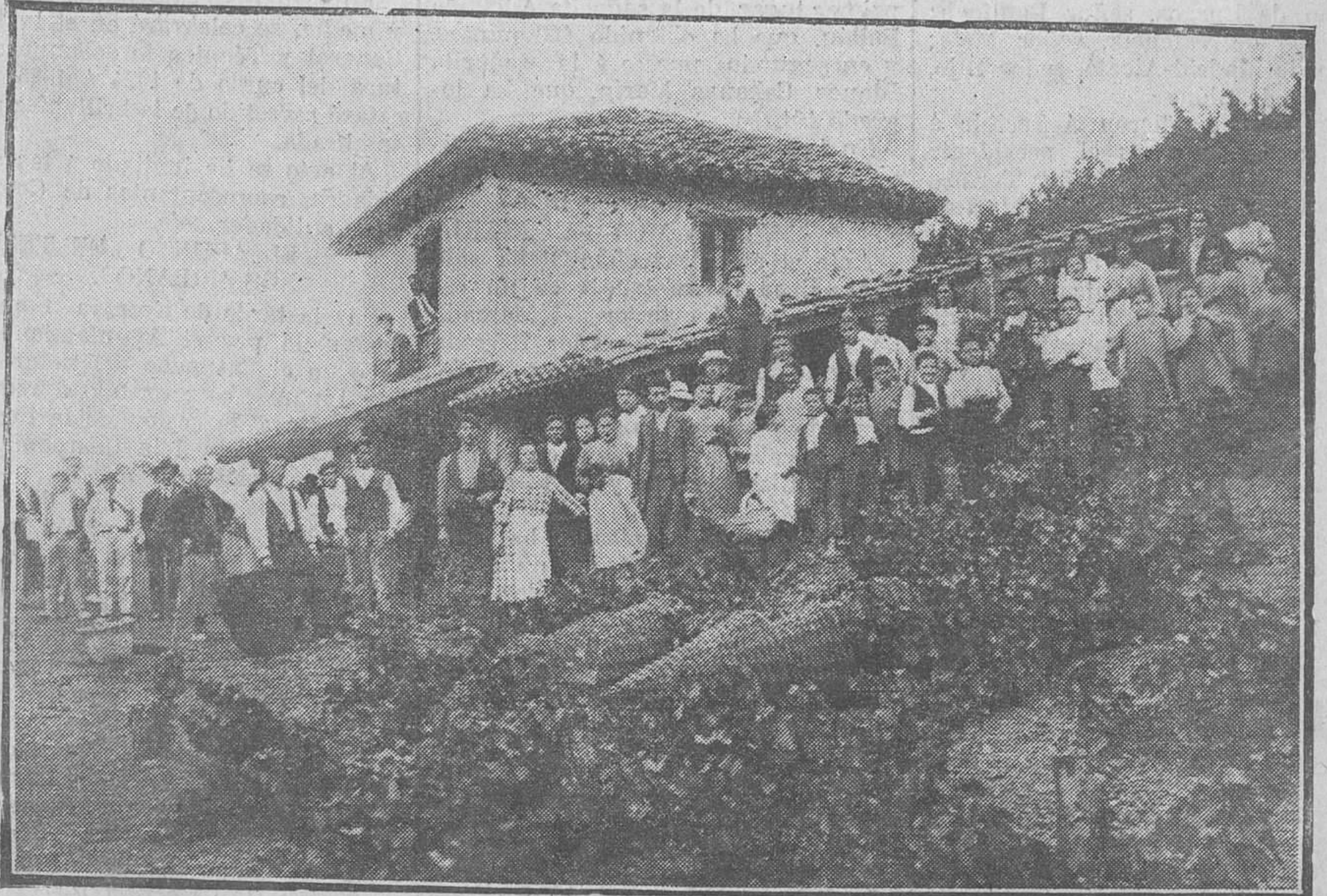
Un año en la vendimia del viñedo Serratana, en Trilayo (Potes.)

Otra gran riqueza, que hasta ahora no se explota en gran escala, es la minera.