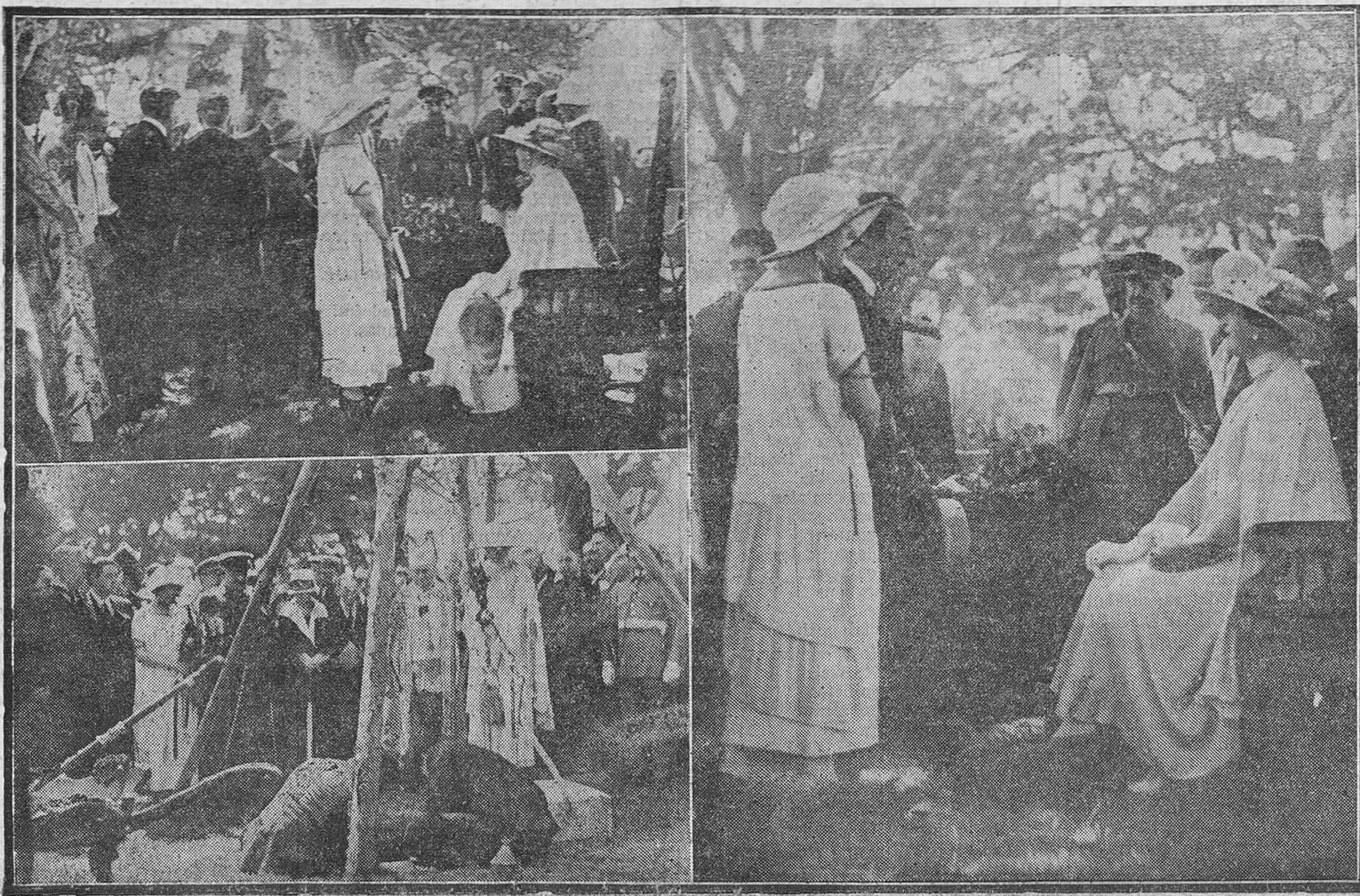
HOMENAJE A CONCHA ESPINA.—1. Su Majestad la Reina conversando con la ilustre escritora.—2. Momento de la colocación de la primera piedra de la "Fuente de Concha Espina".—3. La Reina doña Victoria hablando con el escultor Victorio Macho.

Fué un homenaje unánime y sincero y en cuantos actos se celebraron brilló claramente el sentimiento