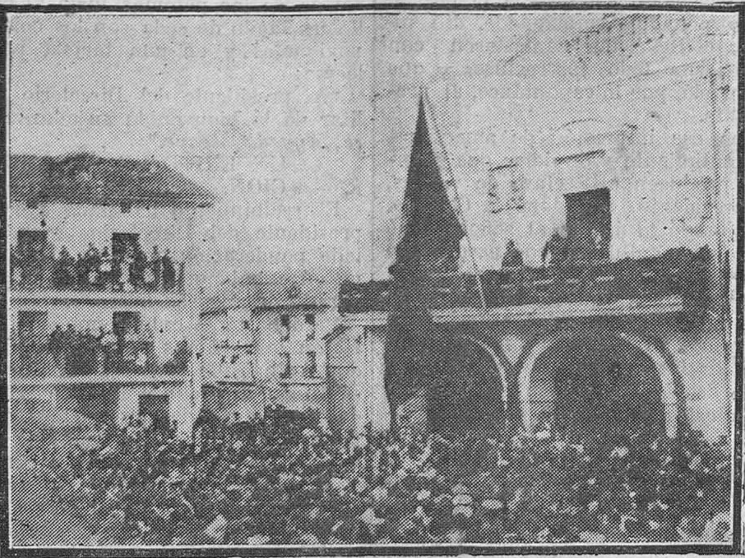
El general Primo de Rivera, entrando en Santoña, acompañado del alcalde y de las autoridades militares. El marqués de Estella, asomado al balcón del Ayuntamiento, ovacionado por el pueblo.