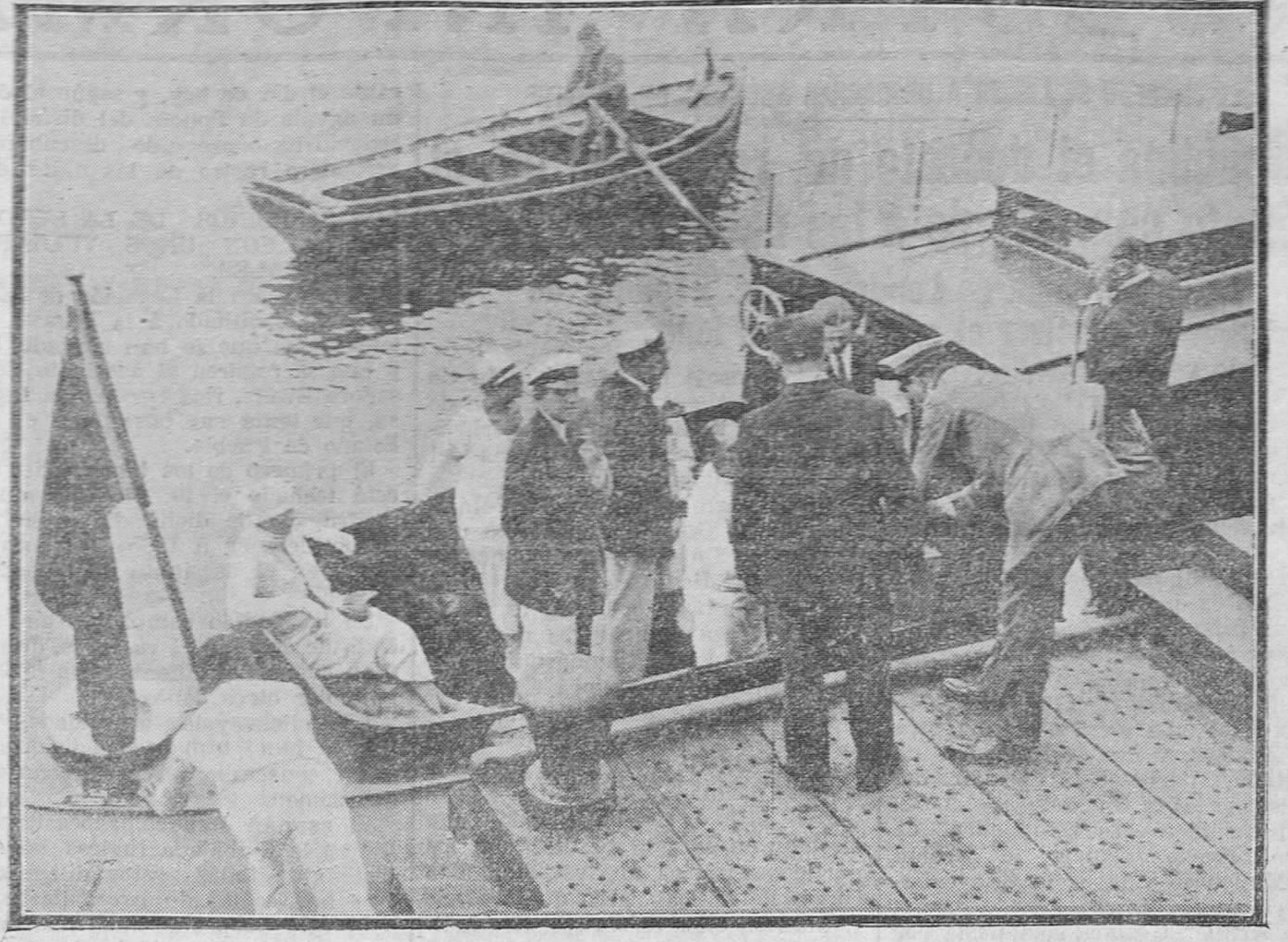
Los Reyes é Infantes embarcando en la "Fakun-Tu-Zin" para dirigirse á los balandros.

A modo de sección de noticias apuntaré más casos y más cosas de la plúmbea tercera corrida de feria. "Los Reyes y el presidente del Directorio presenciaron pacientemente todo el festejo, y fueron ovacionados."