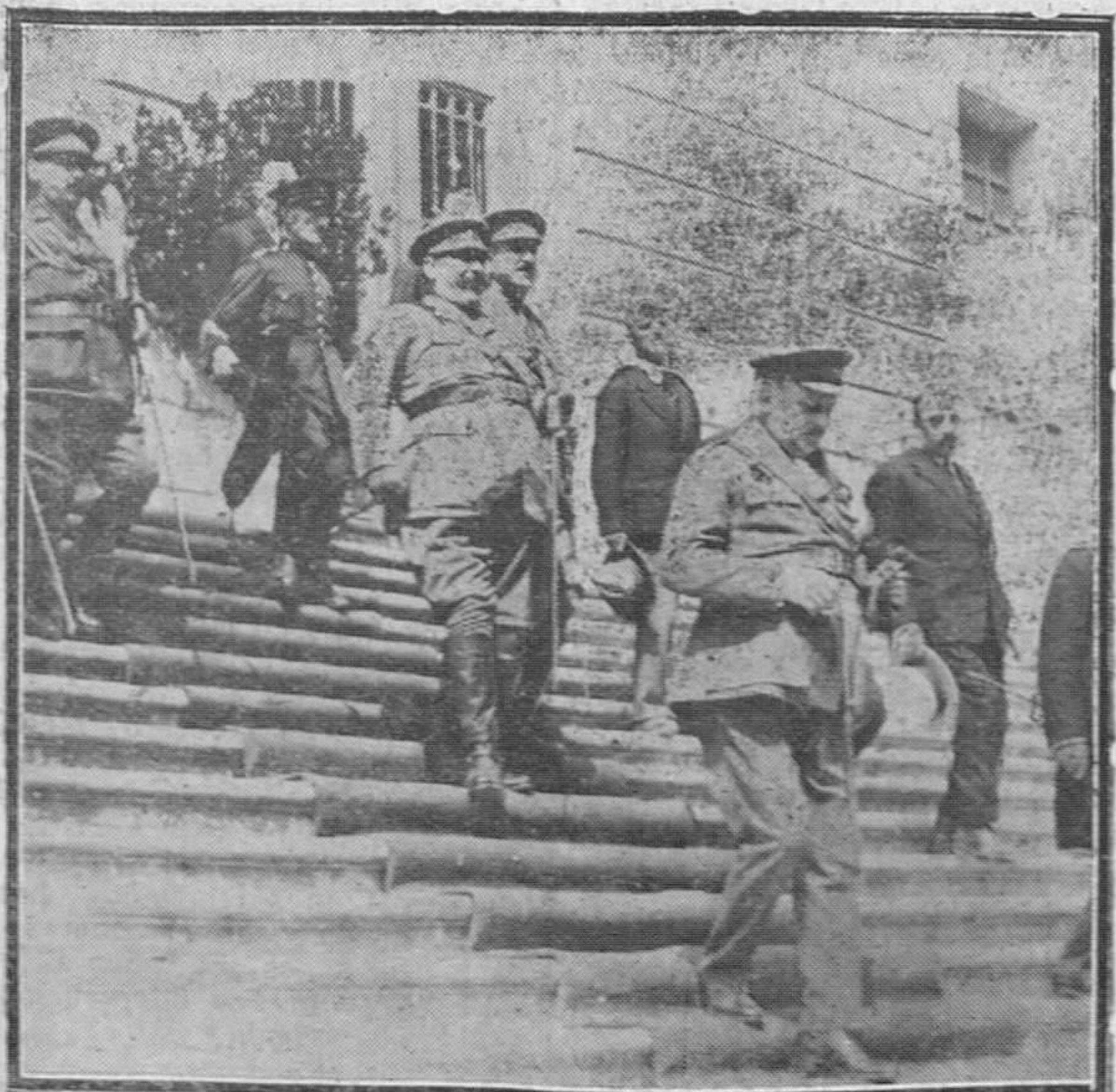
El general Primo de Rivera saliendo del Instituto después de presidir la sesión inaugural del Congreso de arquitectos.

R. Prosmans DENTISTA Puente, 1, duplicado, principal.