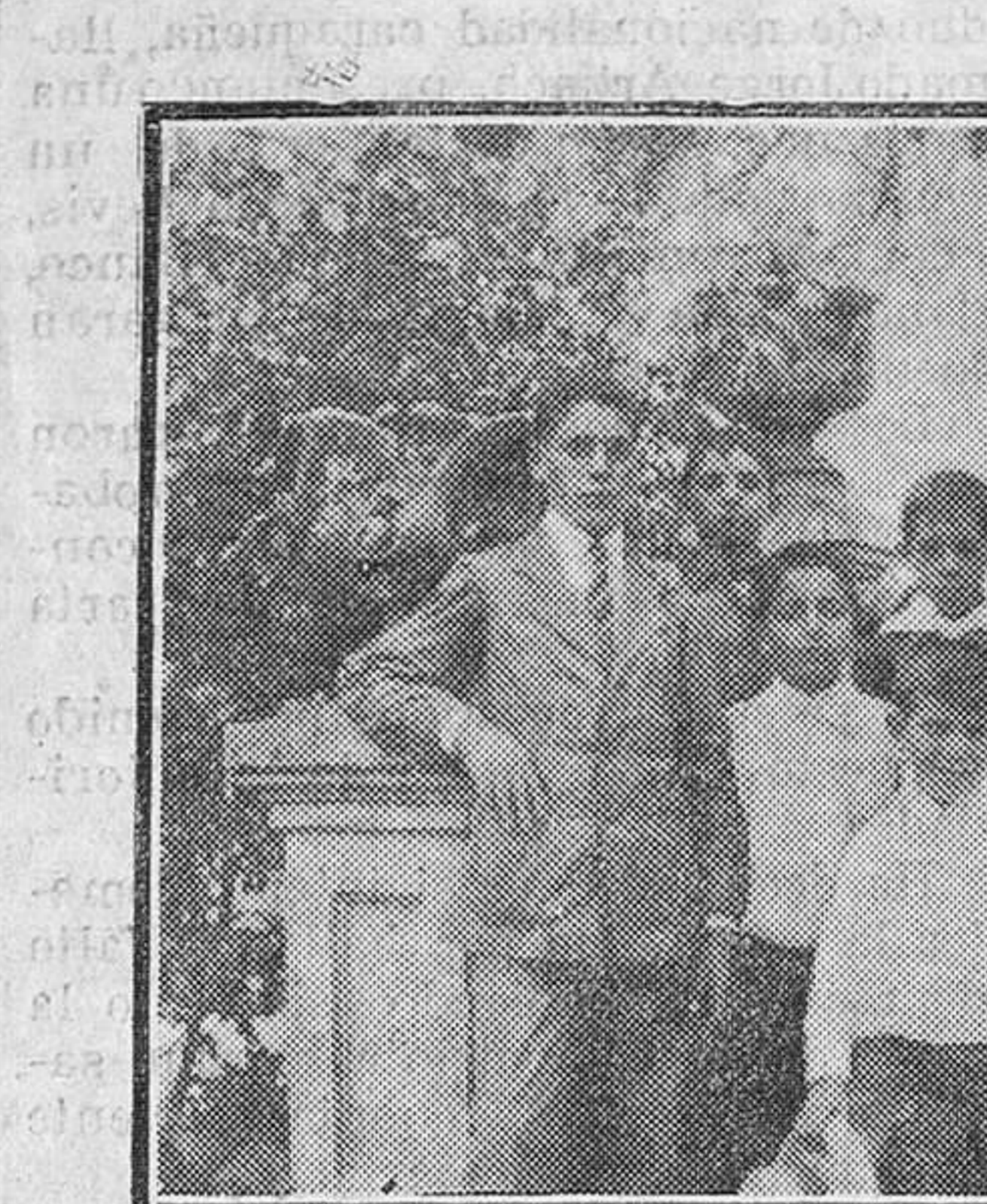
Si los aplicados escolares encontraron en los señores de la casa sentimientos de bondad y benevolencia, también éstos tuvieron ocasión de admirar el porte y los modales que tanto dicen en favor del niño.

Terminada la primera parte de la fiesta, señoras é invitados salieron al jardín de la posesión, donde se hicieron algunas fotografías, una de las cuales reproducimos. Poco después embarcaron el señor Albo y los repetidos camaradas en la bonita canoa "Pipiola", propiedad de aquél, haciendo rumbo a Treto, de donde regresaron a las ocho de la tarde, encantados de las horas que habían pasado. Con estos cuidados, observando esta conducta, es como se conquista la confianza de los niños. Enhorabuena a todos y que una nueva y superior calificación en el estudio sea motivo para que el caso se repita. LA PLAZA DE SAN ANTONIO Tanto el espacio que comprende