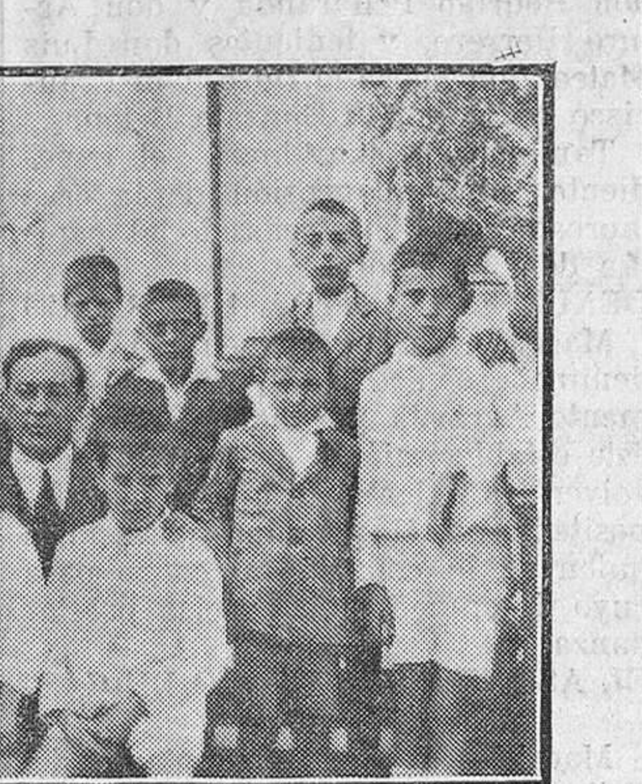
Si los aplicados escolares encontraron en los señores de la casa sentimientos de bondad y benevolencia, también éstos tuvieron ocasión de admirar el porte y los modales que tanto dicen en favor del niño.

Terminada la primera parte de la fiesta, señoras é invitados salieron al jardín de la posesión, donde se hicieron algunas fotografías, una de las cuales reproducimos. Poco después embarcaron el señor Albo y los repetidos camaradas en la bonita canoa "Pipiola", propiedad de aquél, haciendo rumbo a Treto, de donde regresaron a las ocho de la tarde, encantados de las horas que habían pasado. Con estos cuidados, observando esta conducta, es como se conquista la confianza de los niños. Enhorabuena a todos y que una nueva y superior calificación en el estudio sea motivo para que el caso se repita. LA PLAZA DE SAN ANTONIO Tanto el espacio que comprende