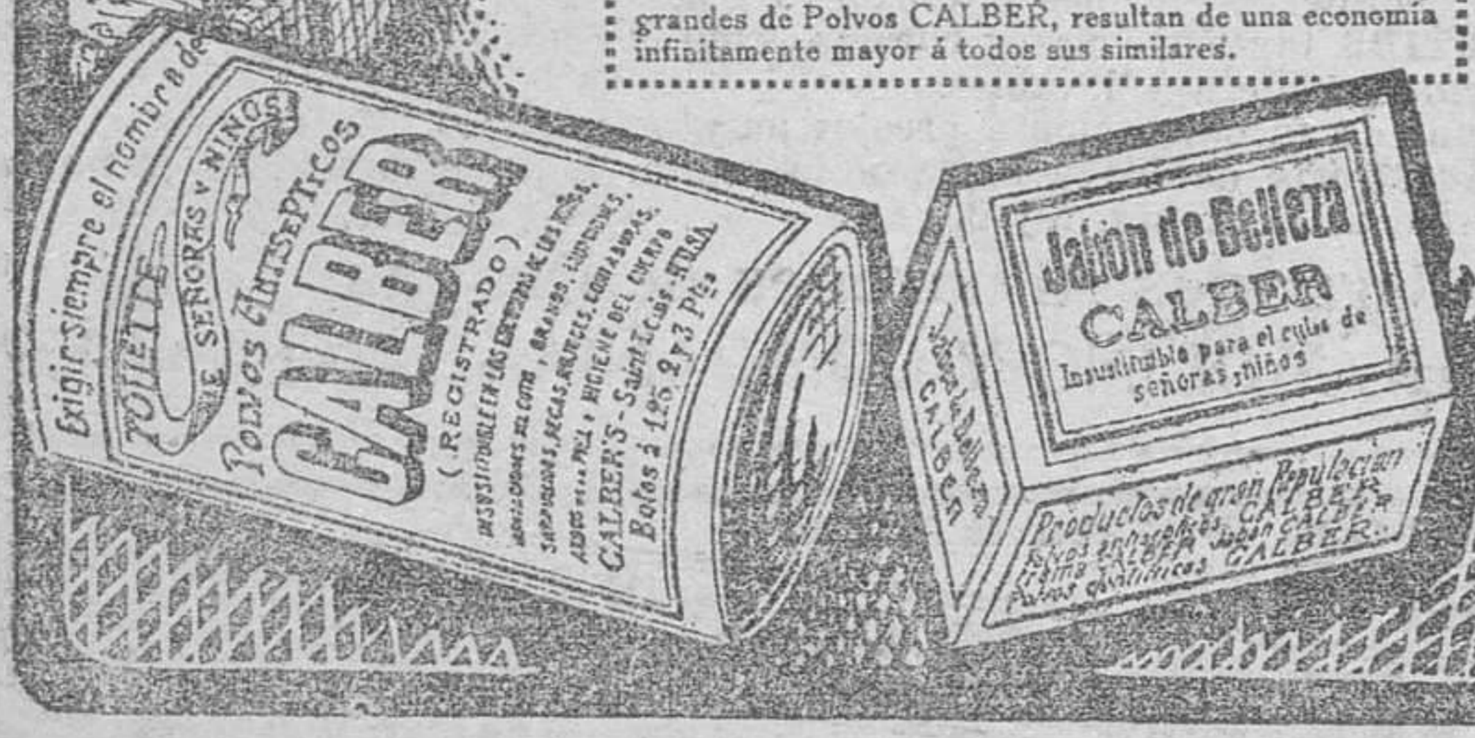
Droguerías Pérez del Molino y C. y Villafraanca y Calvo.