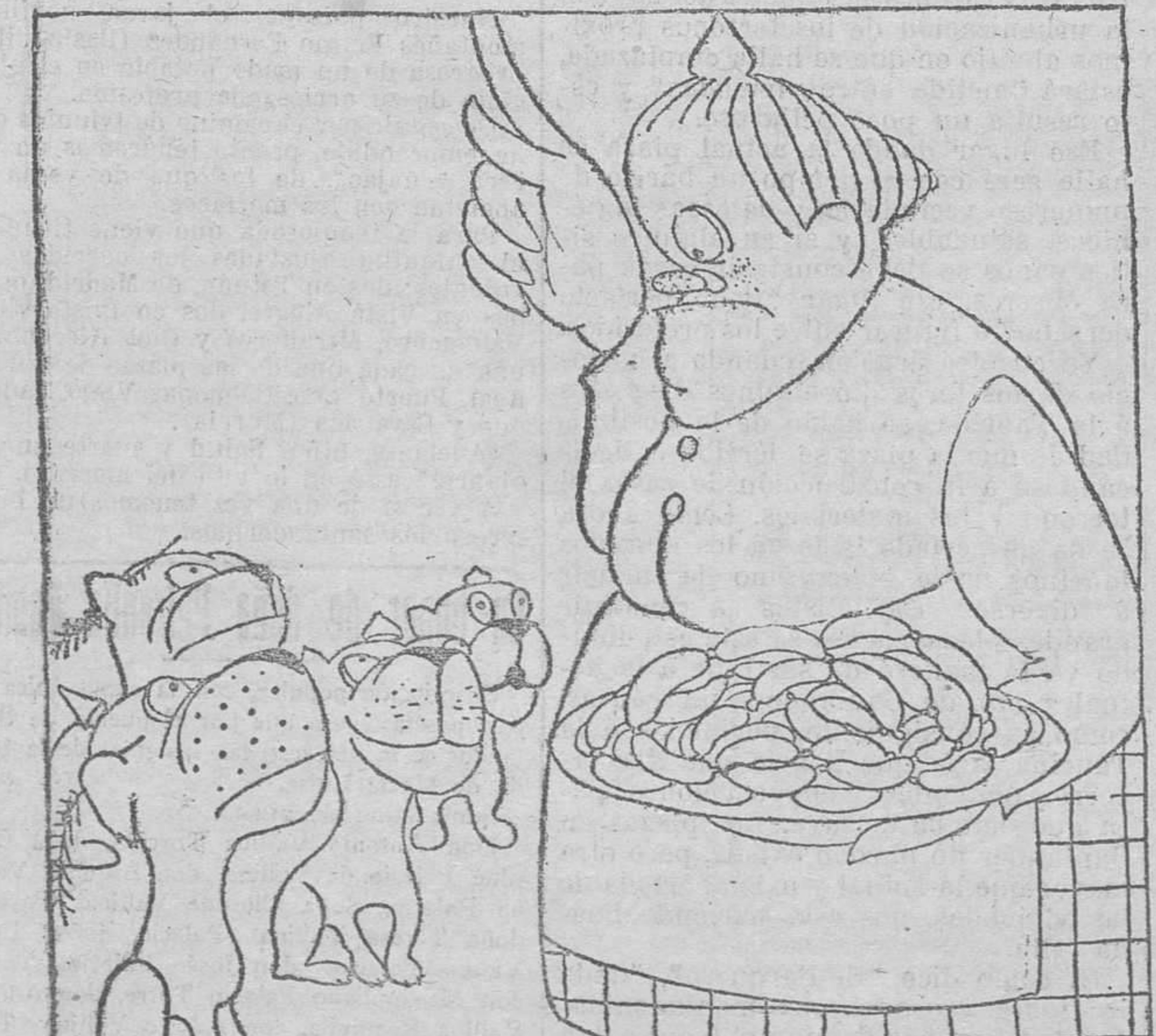
LA CRIADA DE S. A.:—Si ladráis bien y fuerte os ganaréis este gran plato de salchichas de Francfort.