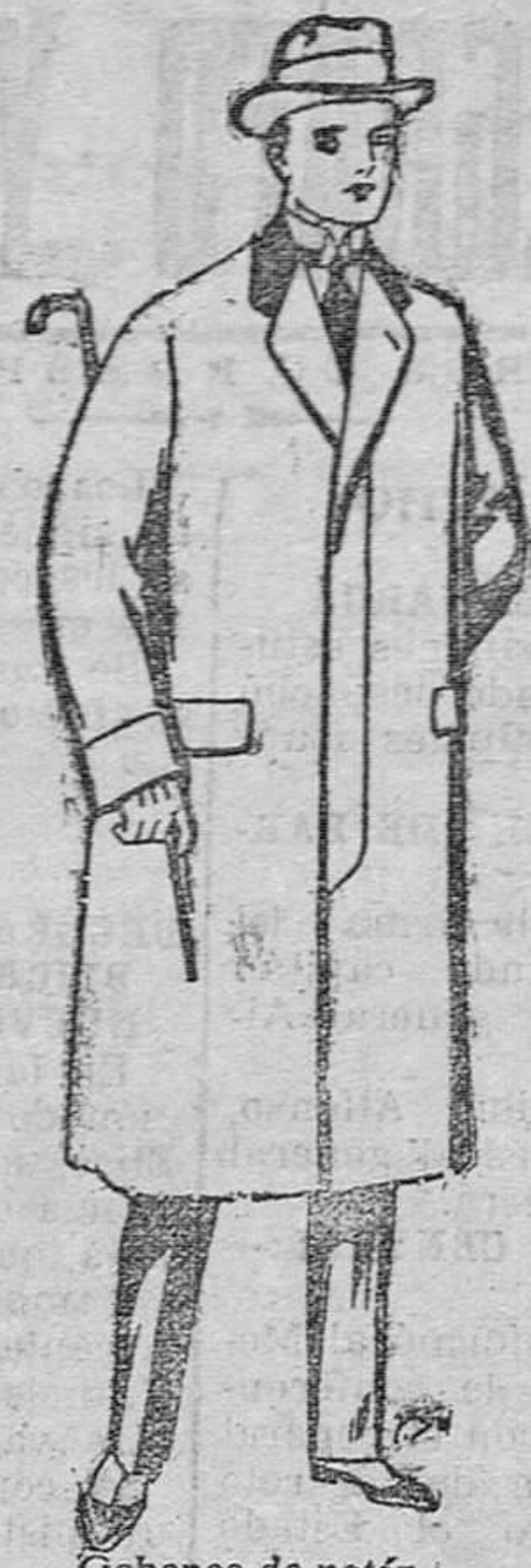
Chabanes de patén, melón y cheviot. De pesetas 25 á 100.