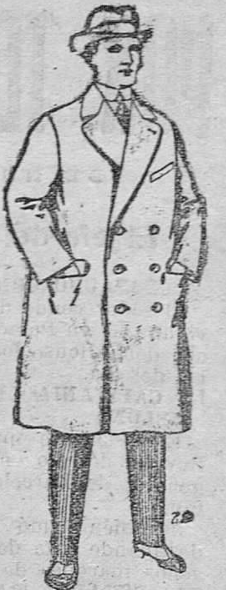
Chabanes de patén, cheviot, etc. De pesetas 55 á 110.