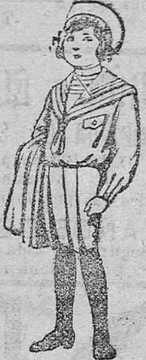
Trojes de jerga, negra ó azul, para niños de 4 á 9 años. De pesetas 5 á 10.