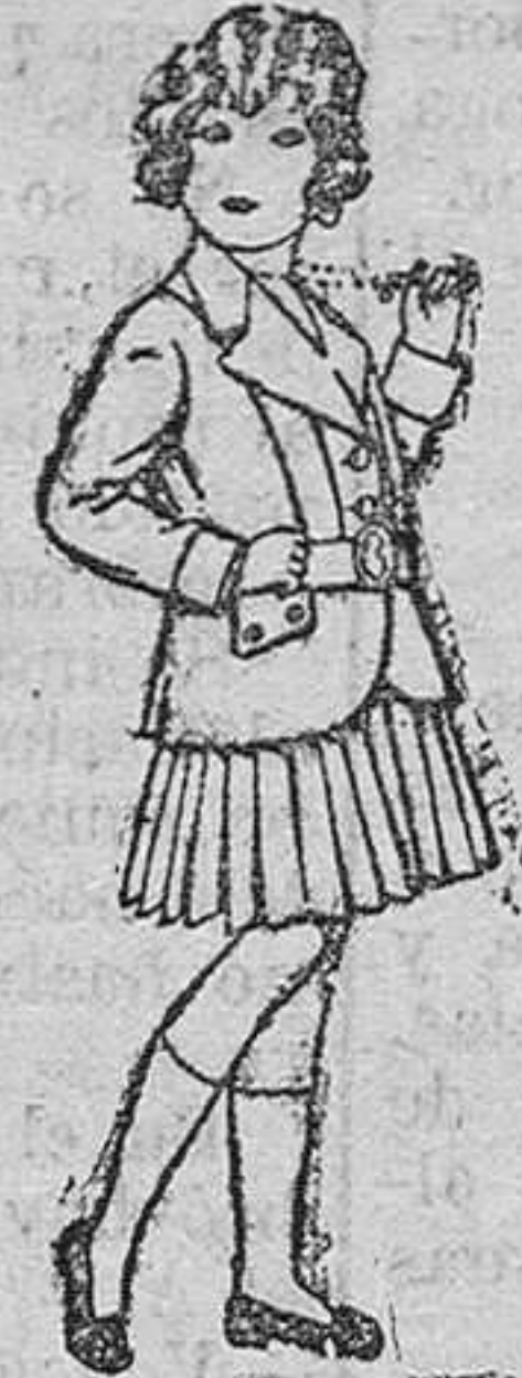
Trojes de lanilla, para niñas de 4 á 12 años. De ptas. 20 á 55.