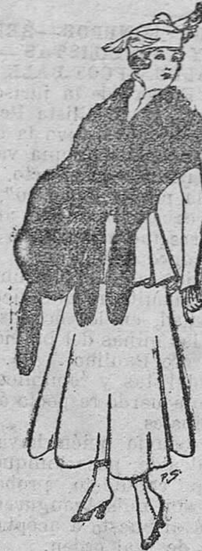
Juego de pieles, imitación perfecta al renard negro. De pesetas 40 á 45.