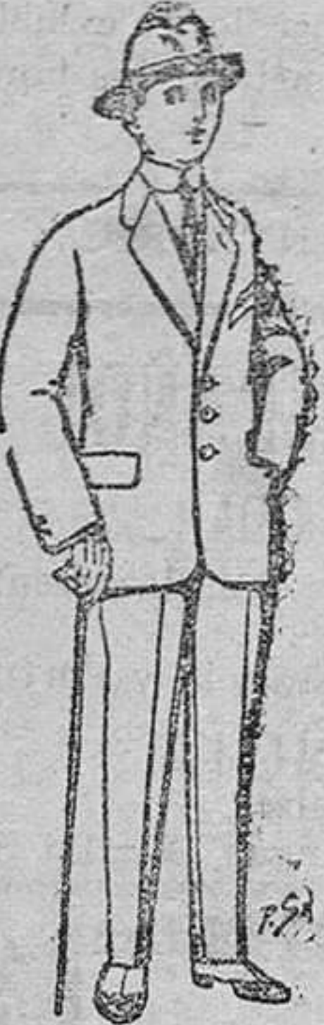
Trojes de patén, vicuña ó jerga, para niños de 10 á 16 años. De ptas. 14 á 50.