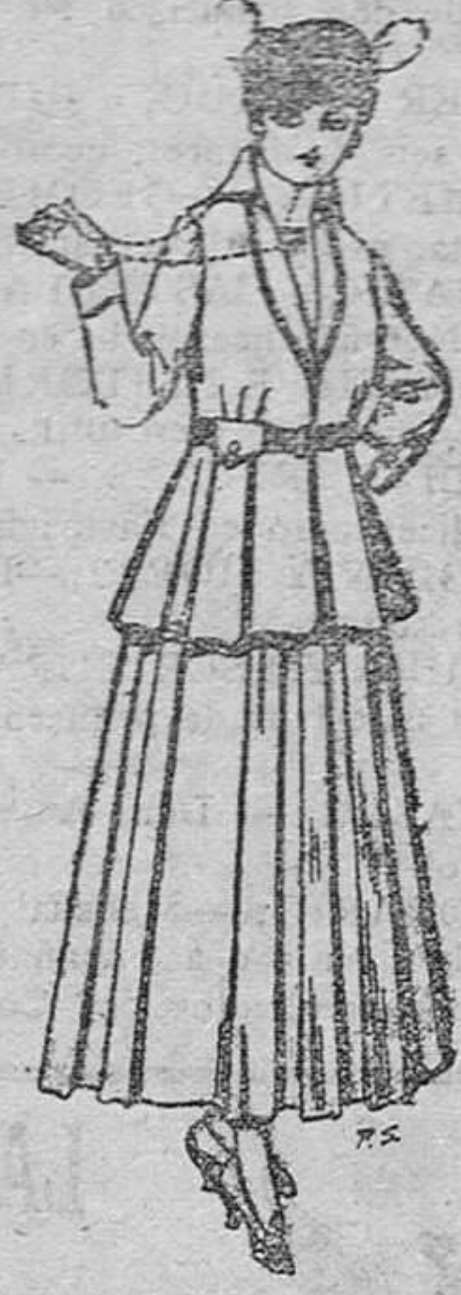
Trojes de lana negra, azul y color para señora á pesetas 65.