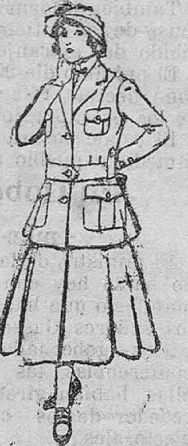
Trojes de lana, para jovencitas de 15 á 16 años. De pesetas 40 á 45.