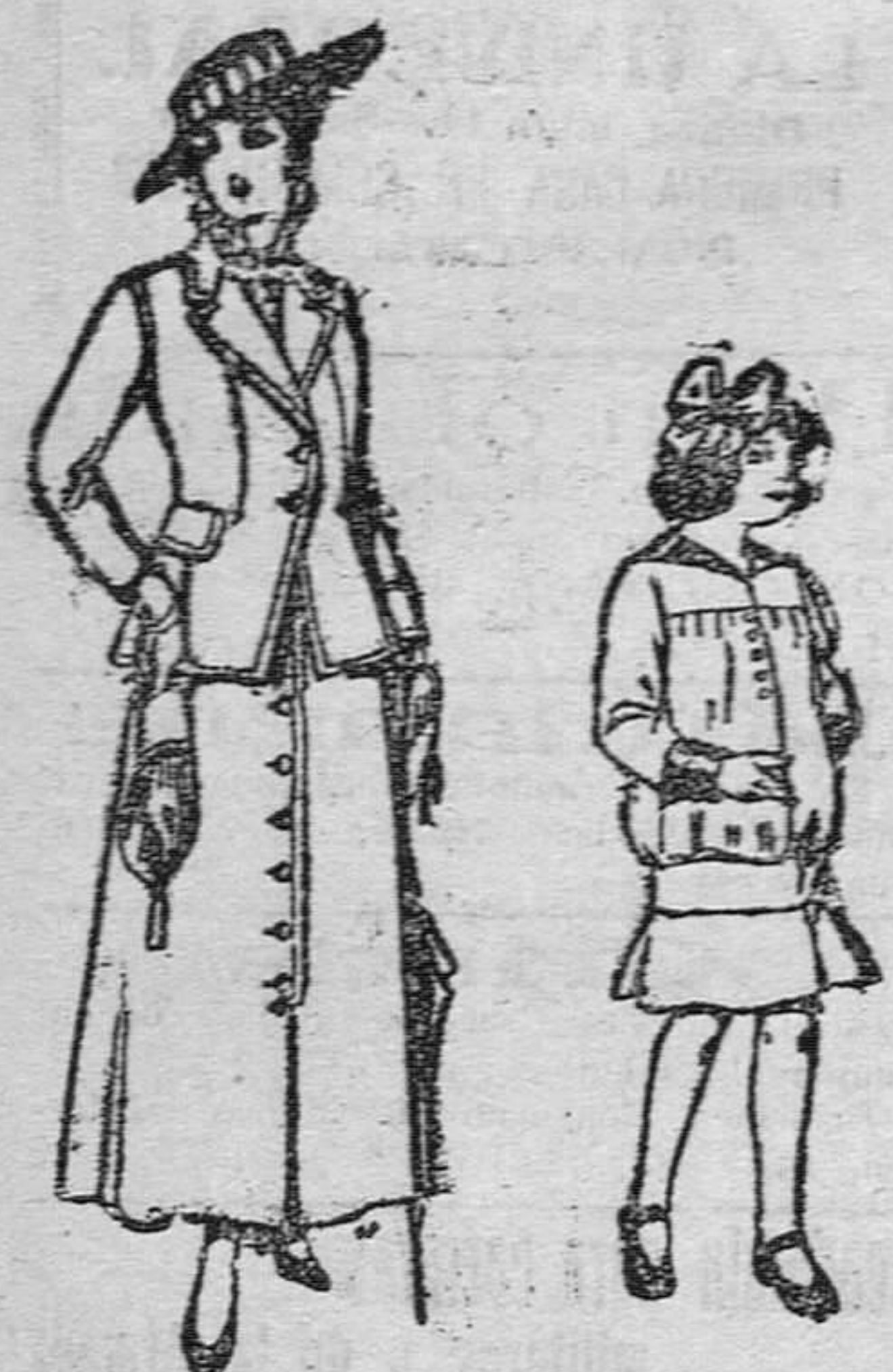
Trajes de lana negra, azul y color para señora, 4 PESETAS 40