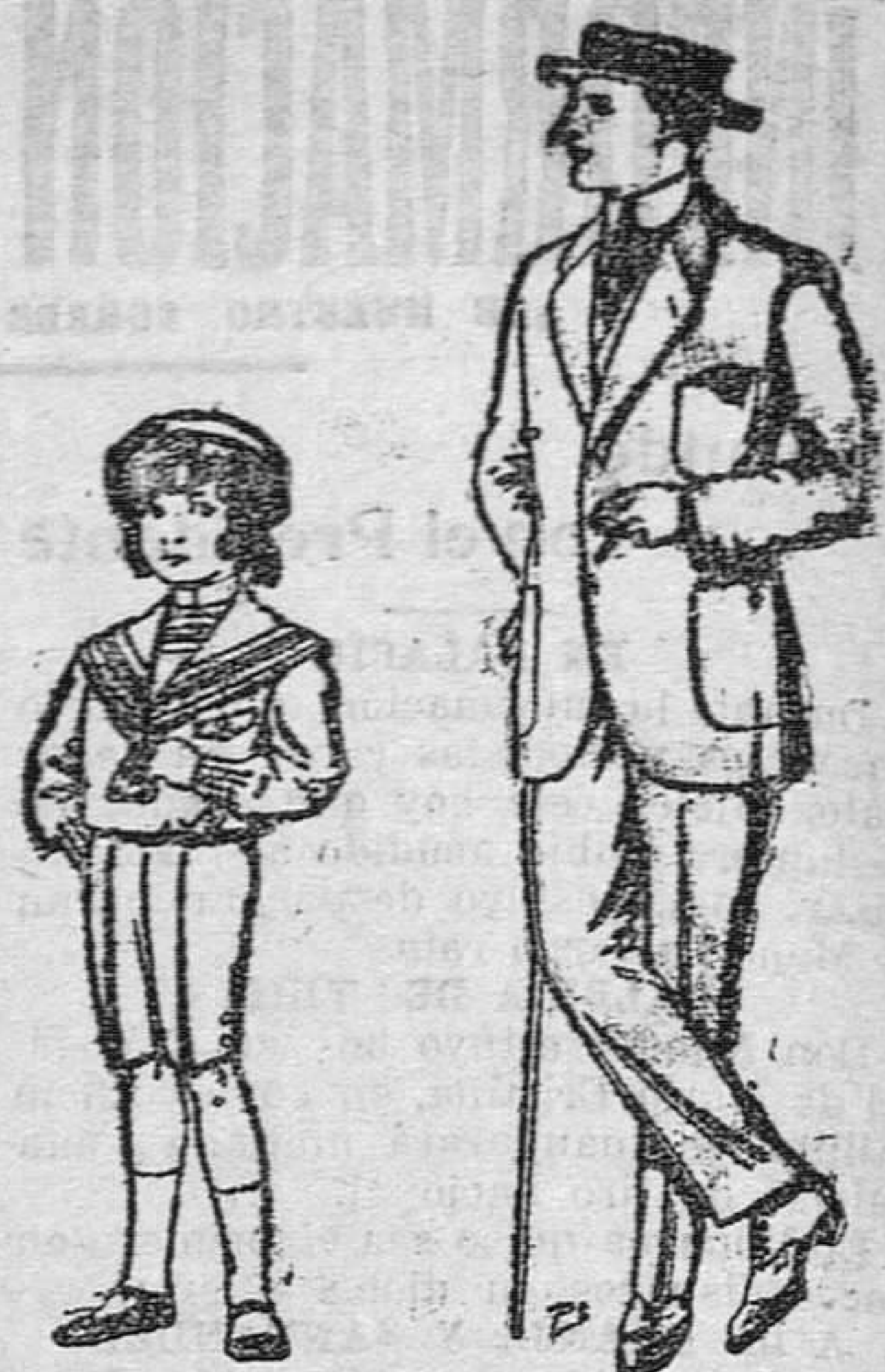
Trajes de vicuña y jerga, negros y azules, para niños de 4 a 9 años, 6 a 8 ptas. 6 a 8