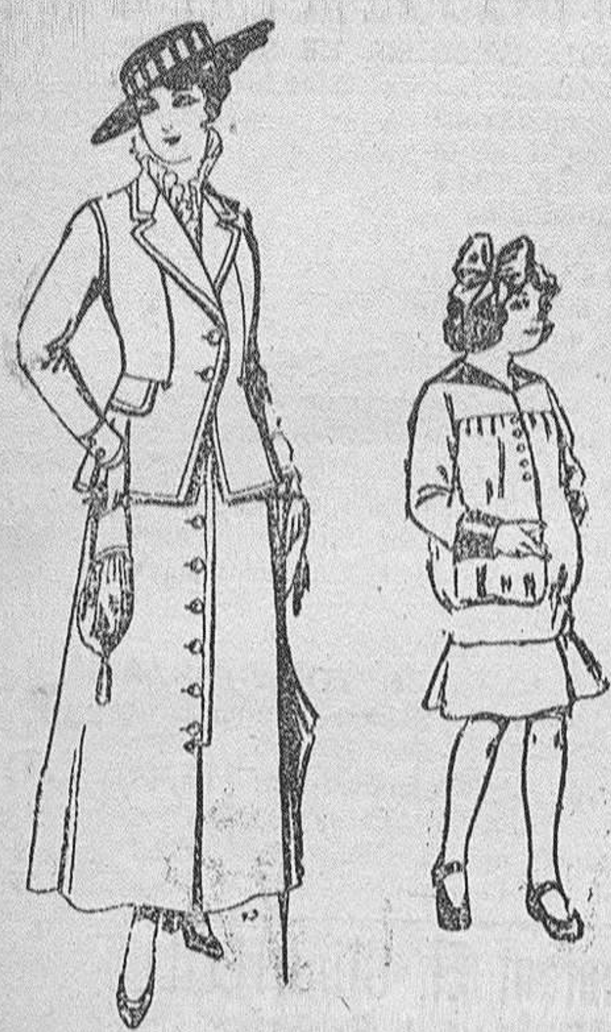
Trajes de lana negra, azul y color para señora, 4 PESETAS 40

Madrid, Barcelona, Alicante, Almería, Bilbao, Cádiz, Cartagena, Gijón, Granada, Málaga, Palma de Mallorca, Sevilla, Valencia, Valladolid y Zaragoza.