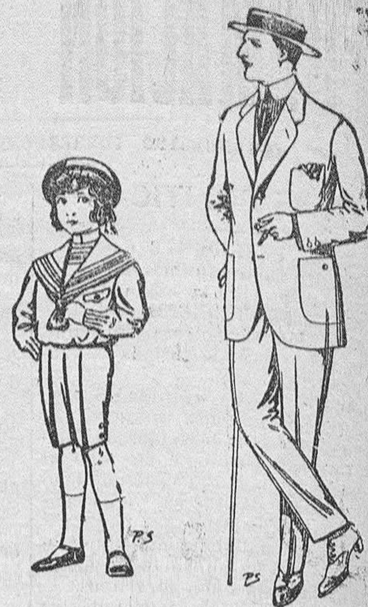
Trajes de vicuña ó lerga, negros y azules, para niños de 4 á 9 años ptas. 6 á 51