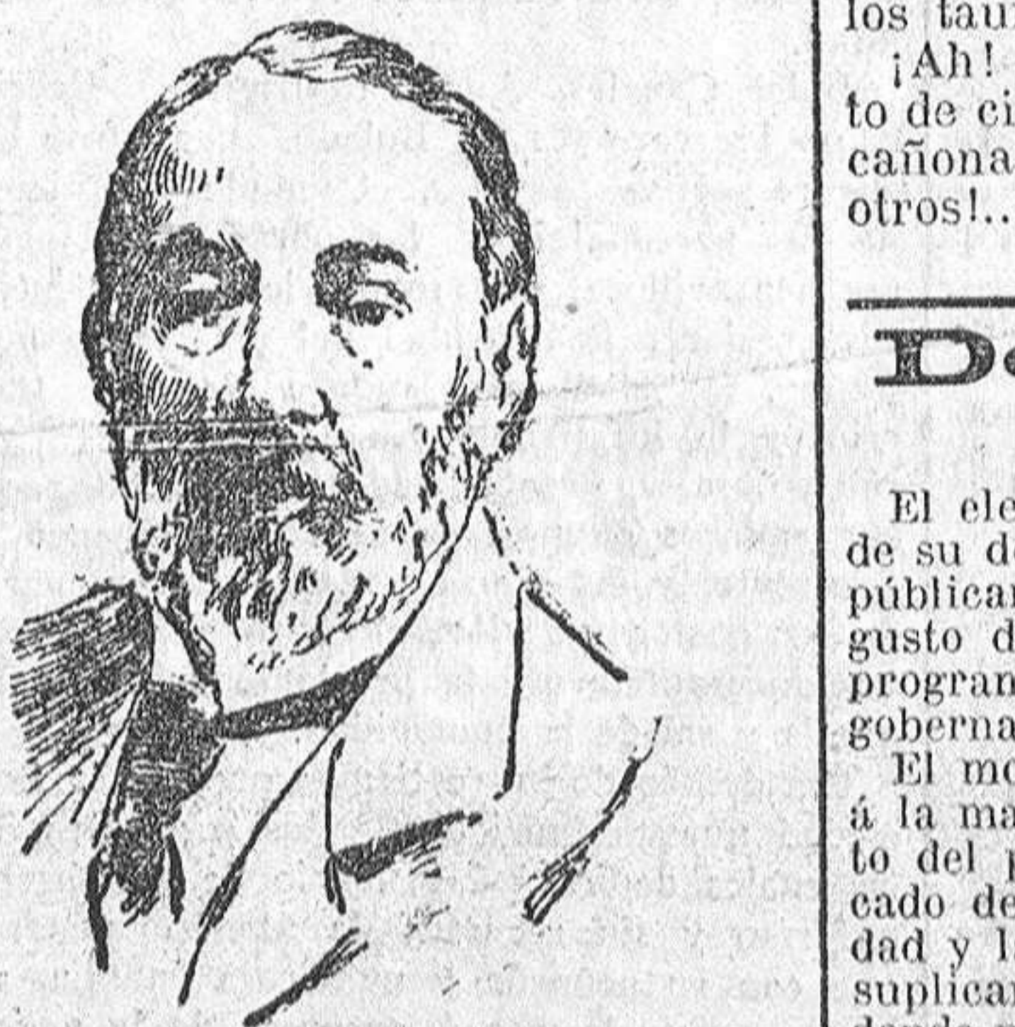
EL CONDE WHITE ilustre político y exministro ruso que acaba de fallecer en Petrogrado.

El elemento obrero llanesco, consciente de su deber, ha precedido á manifestarse públicamente cobijado bajo el lema agosto de: "Moralidad, Pan y Trabajo" programa máximo que pudiera exigir el gobernante de más austera severidad.