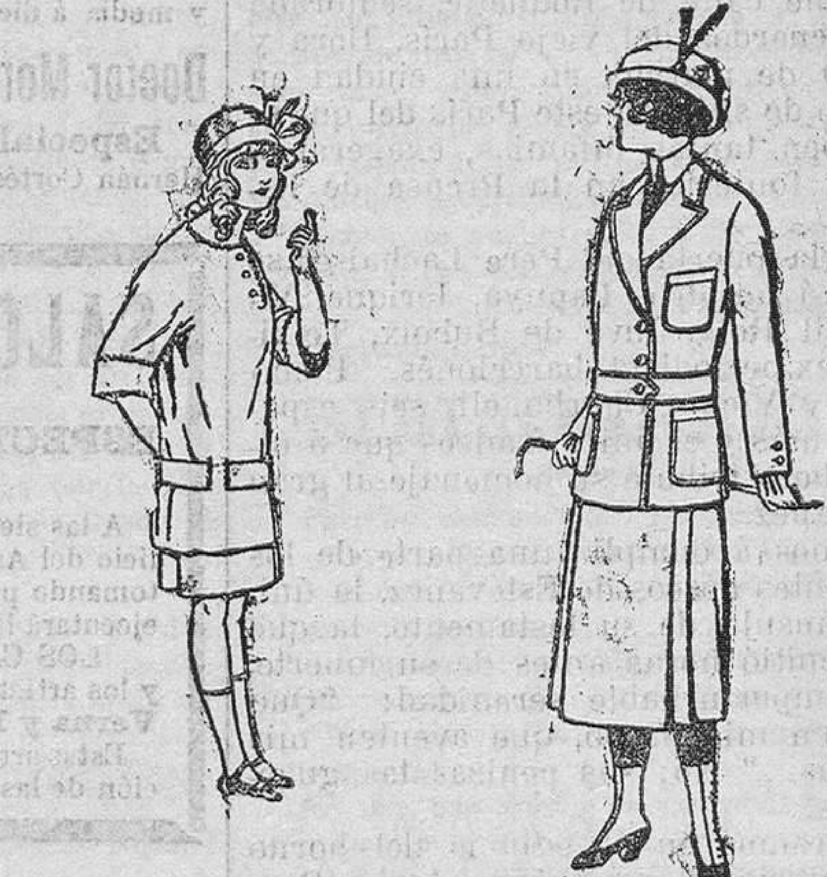
Vestidos de lanilla para niños de 4 á 12 años. De pesetas 9 á 50. Trajes de lanilla para jovencitas de 13 á 15 años. á pesetas 19.