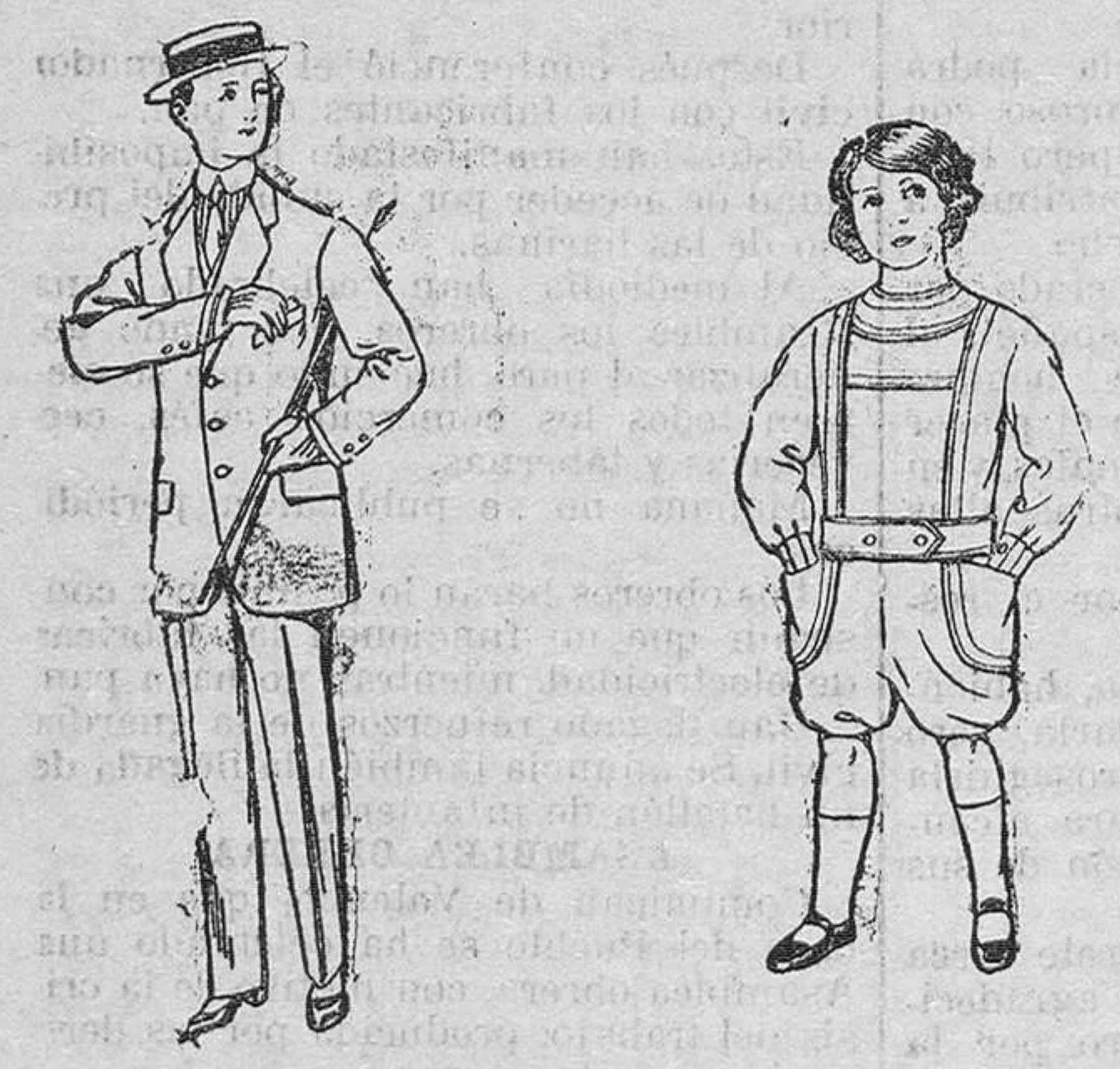
Trajes de lanilla, vicuña etc. Traje delantero de dril, color belga para niños de 10 á 16 años. y azul, para niños de 5 á 6 años. De pesetas 14 á 48. De pesetas 6 á 12.