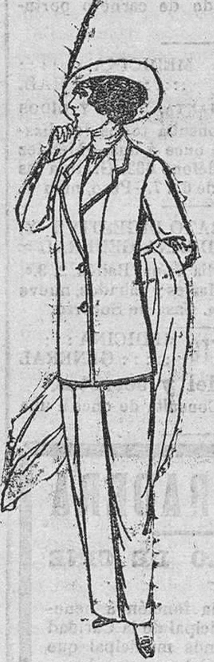
Trajes de lanilla, para señora. á pesetas 25.