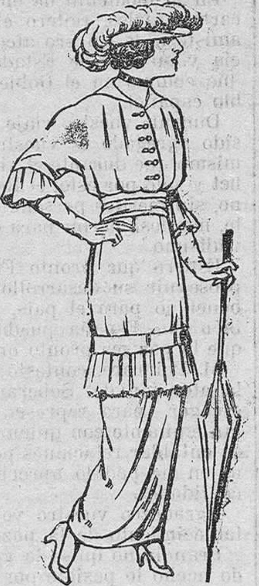
Vestidos de lanilla negra ó azul para señora. De pesetas 22 á 25.