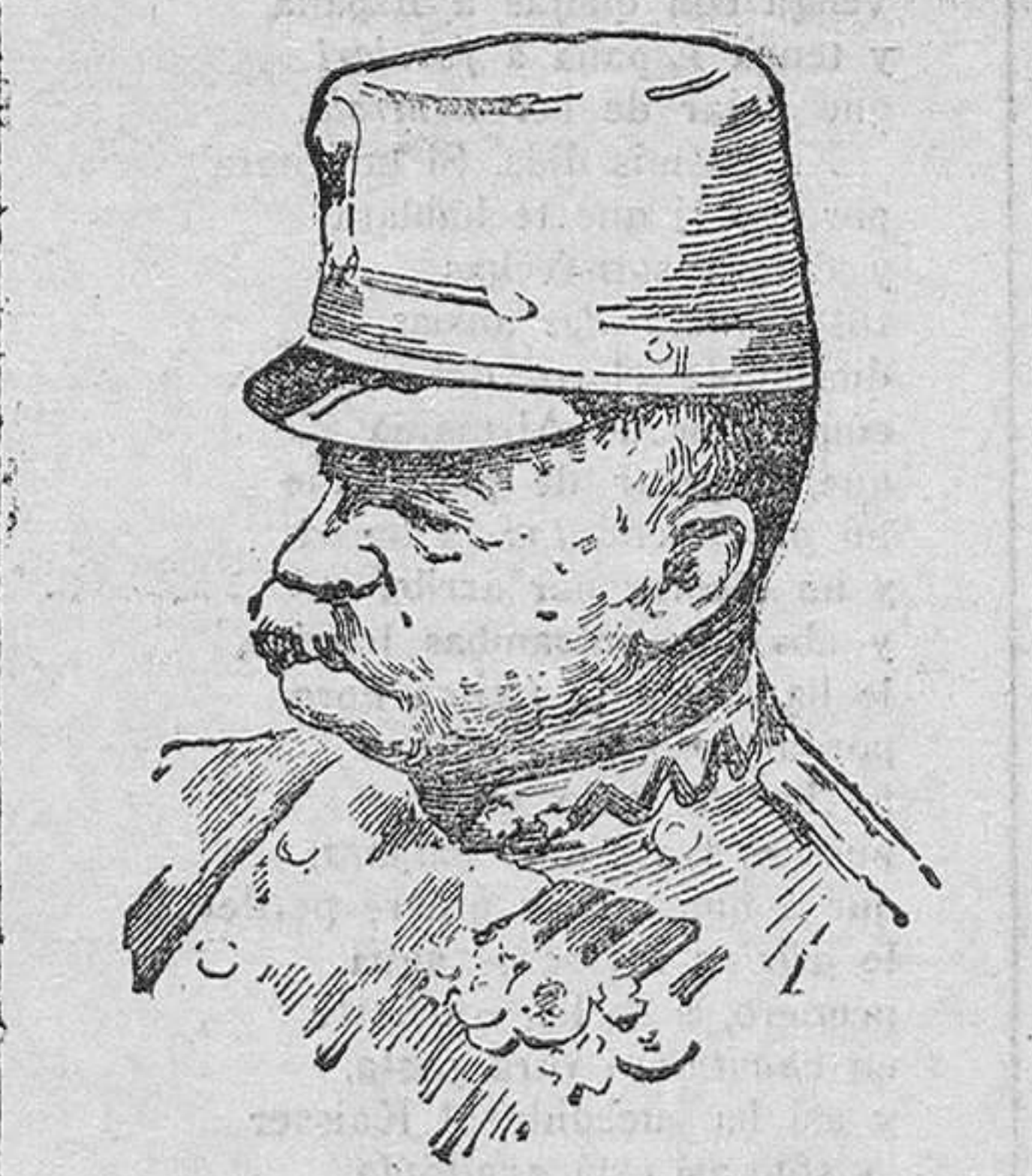
El archiduque Federico de Austria generalísimo de los ejércitos austro-húngaros.

En Vitrimont, al Sur de Nancy, á unos cuatro kilómetros, se hallaron otros cuatro mil quinientos.