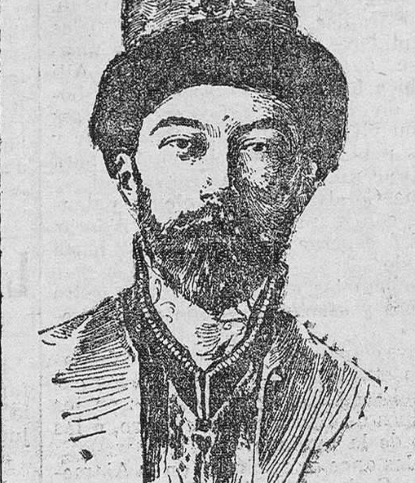
EL ZAR NICOLAS

Esta tarde repartieron los socialistas una hoja-convocatoria para un mitin