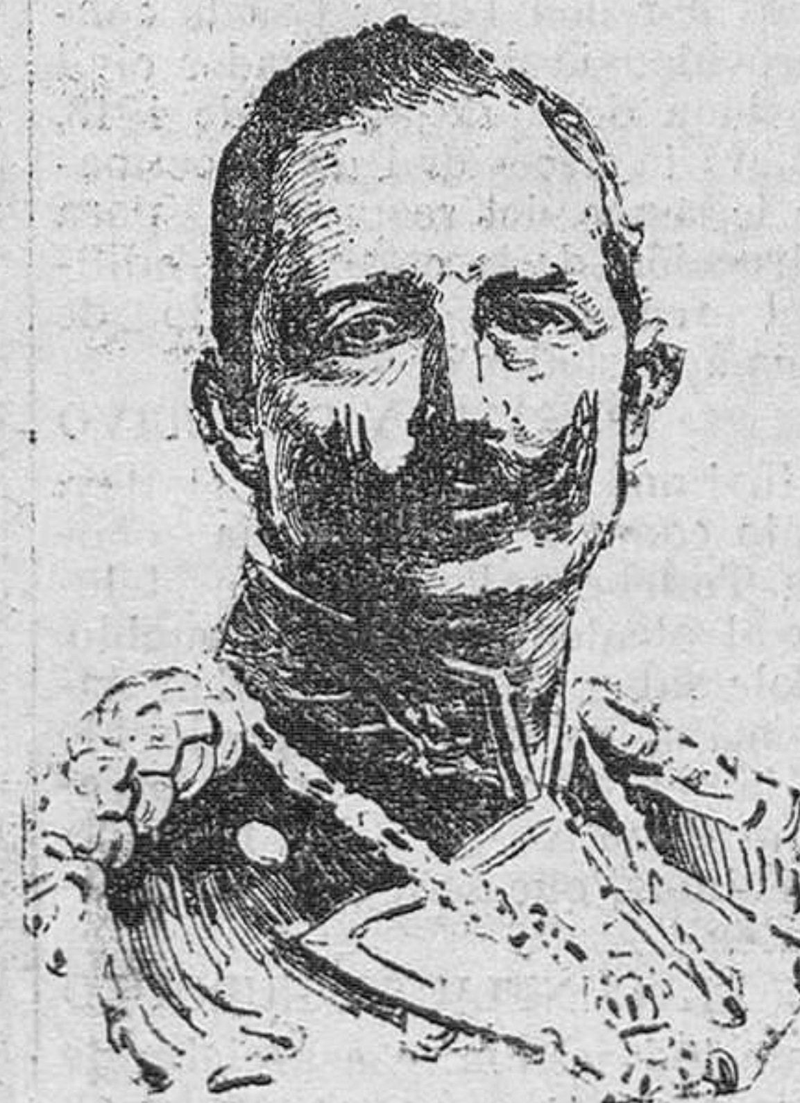
EL EMPERADOR GUILLERMO