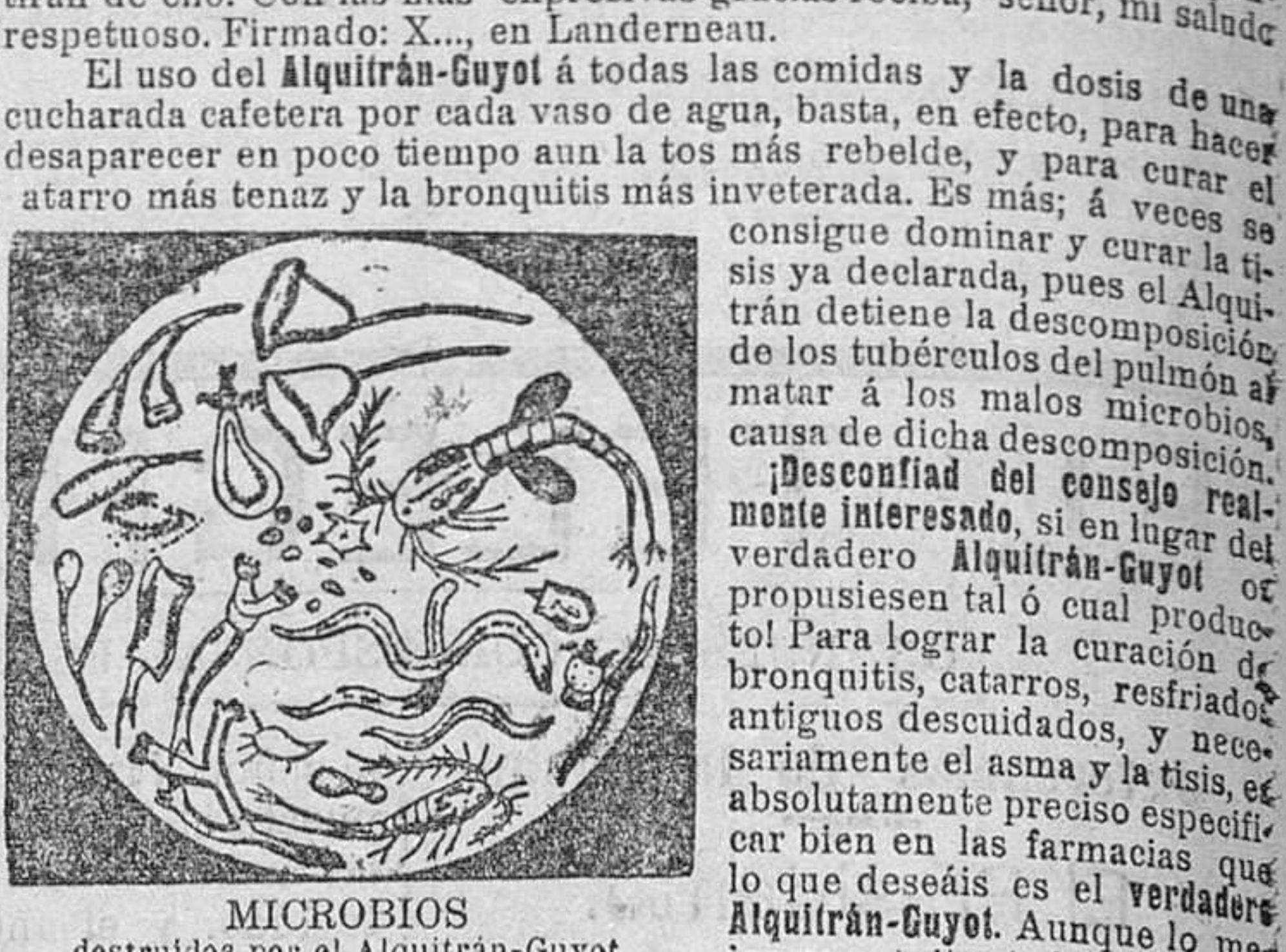
MICROBIOS destruidos por el Alquirán-Guyot.

Landerneau, 20 Junio 1907.—May señor mío: Permítame le expresar toda mi admiración por su Alquirán-Guyot; sólo llevo un mes de tratamiento y ya mi salud me ha vuelto completamente.