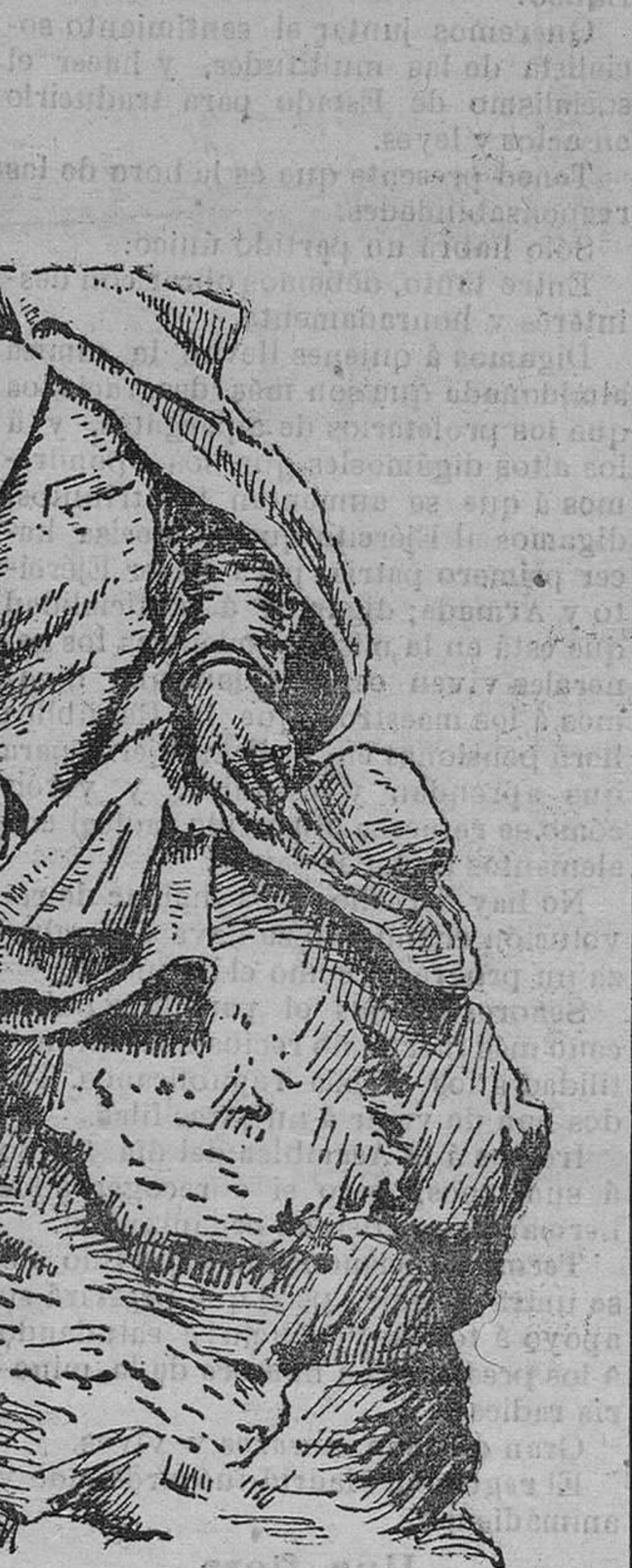
Estatua que corona al monumento.

Añade que las nuevas leyes anunciadas por Canalejas regulando el trabajo de mujeres y niños, la del seguro del obrero, la de abaratamiento de las subsistencias y otras, las aprobará también el partido liberal, pues figuran en su programa económico. Termina insistiendo en que el partido de-