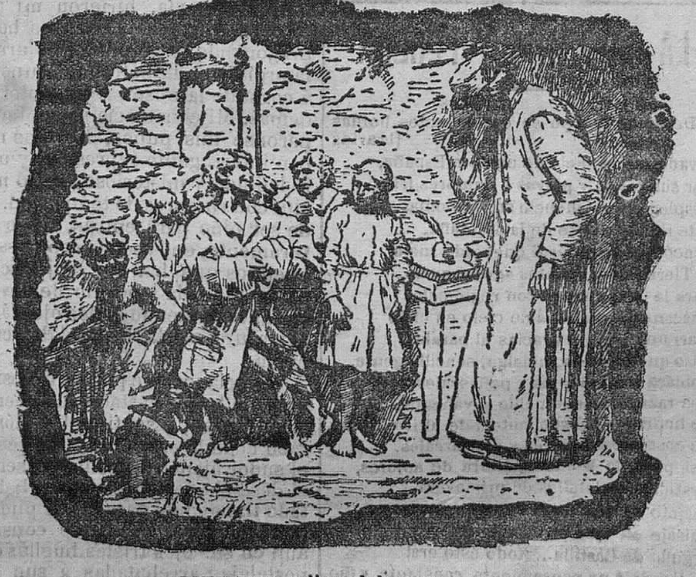
SOTILEZA, relieve del monumento.

Medroso, vacilante y encojido, con el sombrero en la temblona mano, llevo ante tí, confuso y aturdido, para cantar tu genio soberano. Y recordando tu sublime prosa, ¿cantar dije?... ¡Jesús, qué disparate! Perdóname, tozayo... ¡A cualquier cosa lo llaman las patronas chocolate! Se necesita mucho desparrajo