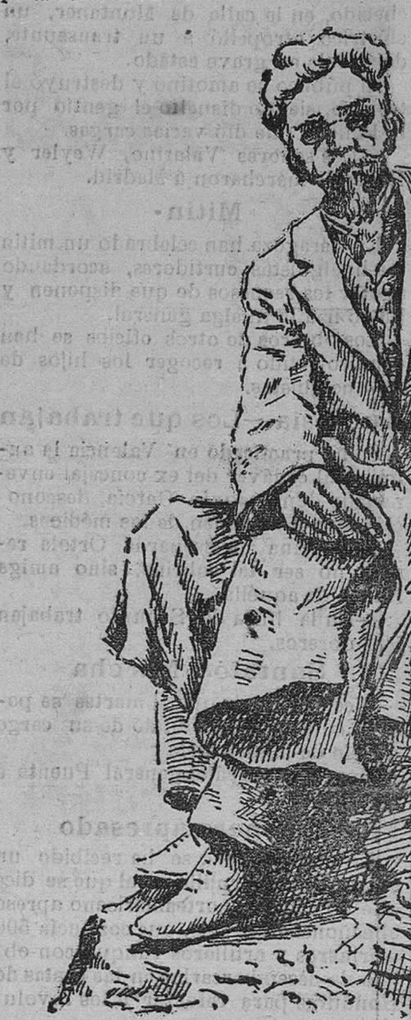
Estatua que corona al monumento.

Añade que las nuevas leyes anunciadas por Canalejas regulando el trabajo de mujeres y niños, la del seguro del obrero, la de abaratamiento de las subsistencias y otras, las aprobará también el partido liberal, pues figuran en su programa económico. Termina insistiendo en que el partido de-