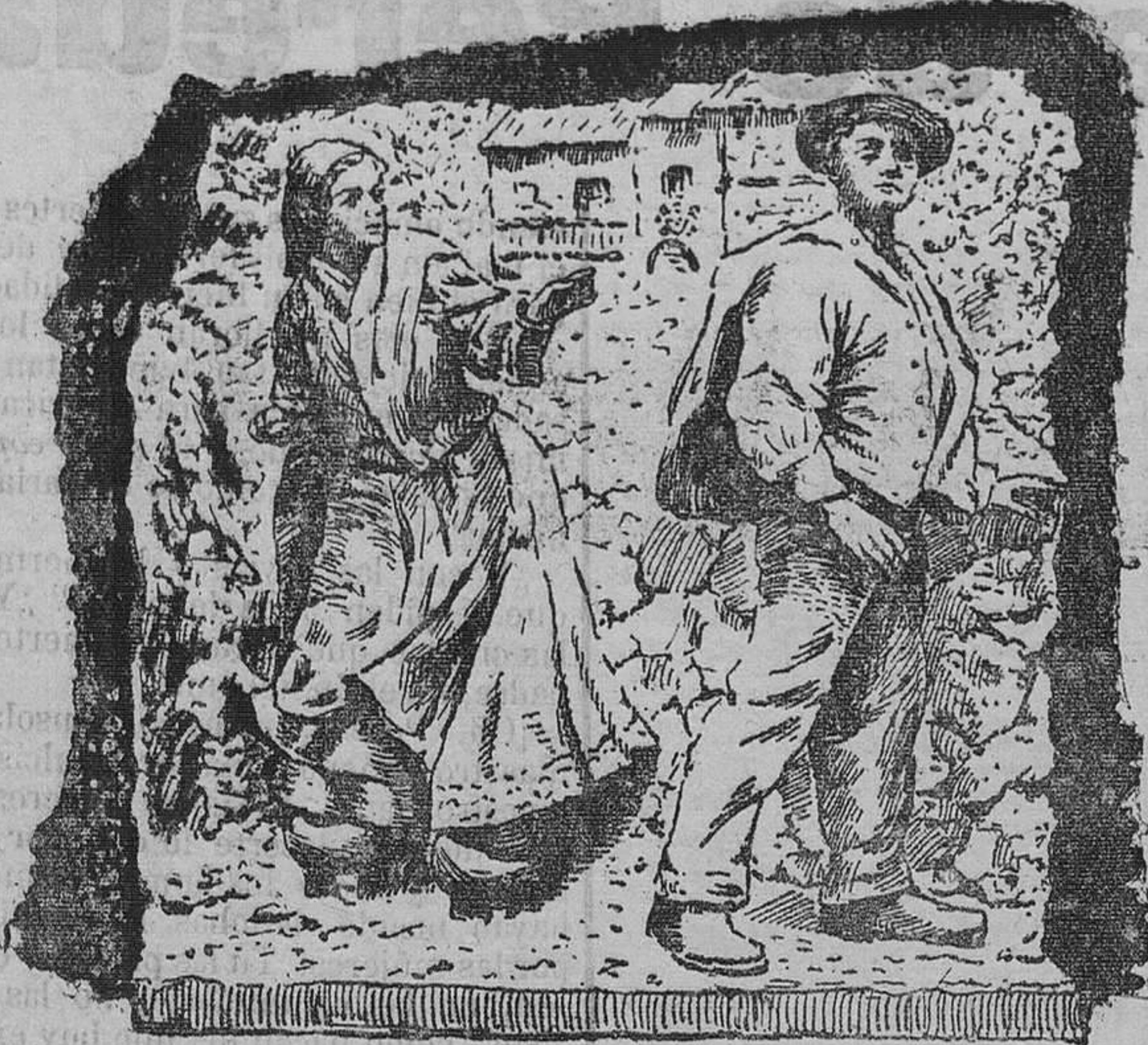
EL SABOR DE LA TIERRUCA, relieve del monumento.