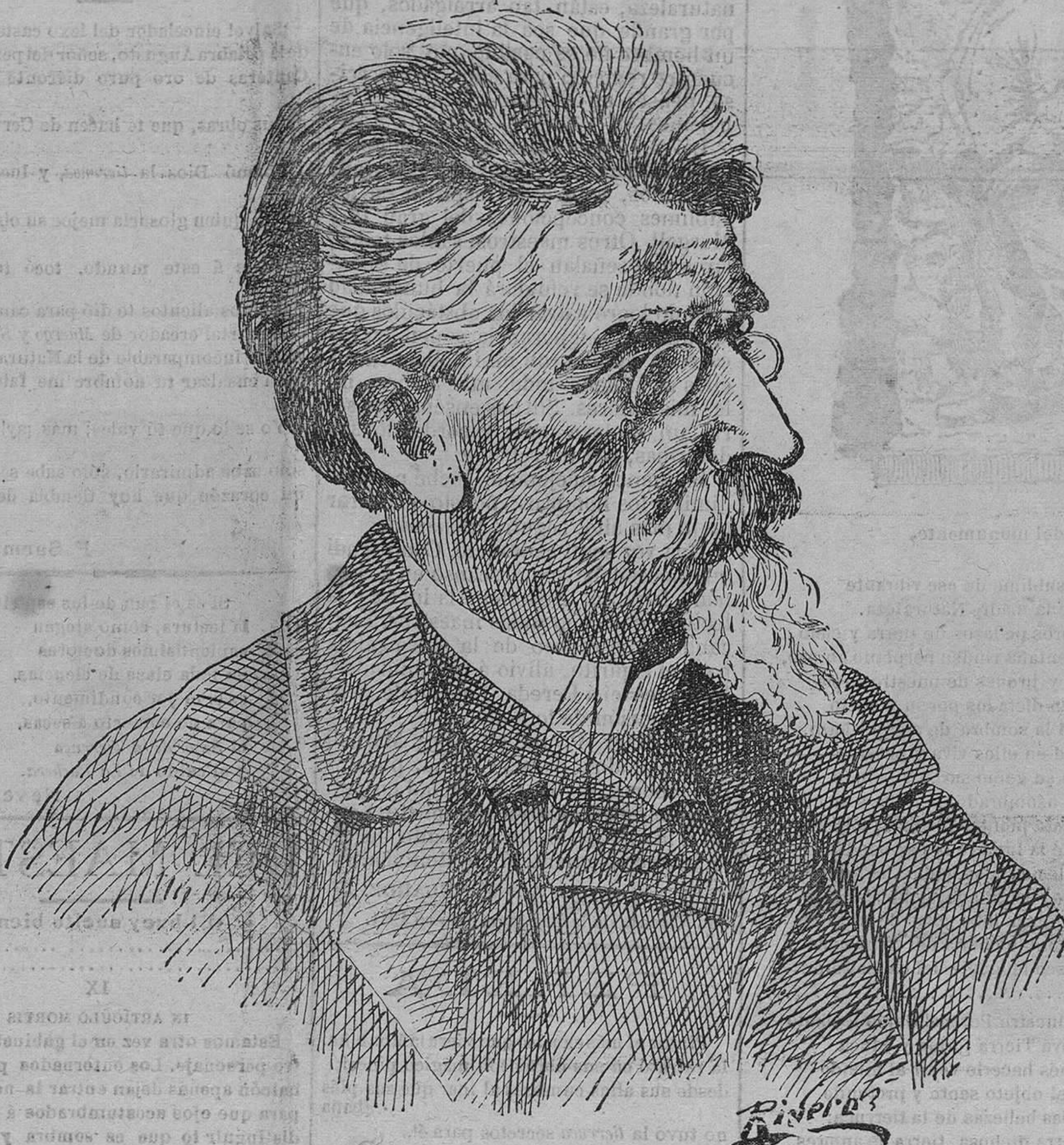
Don José María de Pereda

Si fuese viable ó, cuando menos, digna de ensayo mi idea, y para ello debiese darse principio, aunque en pe-