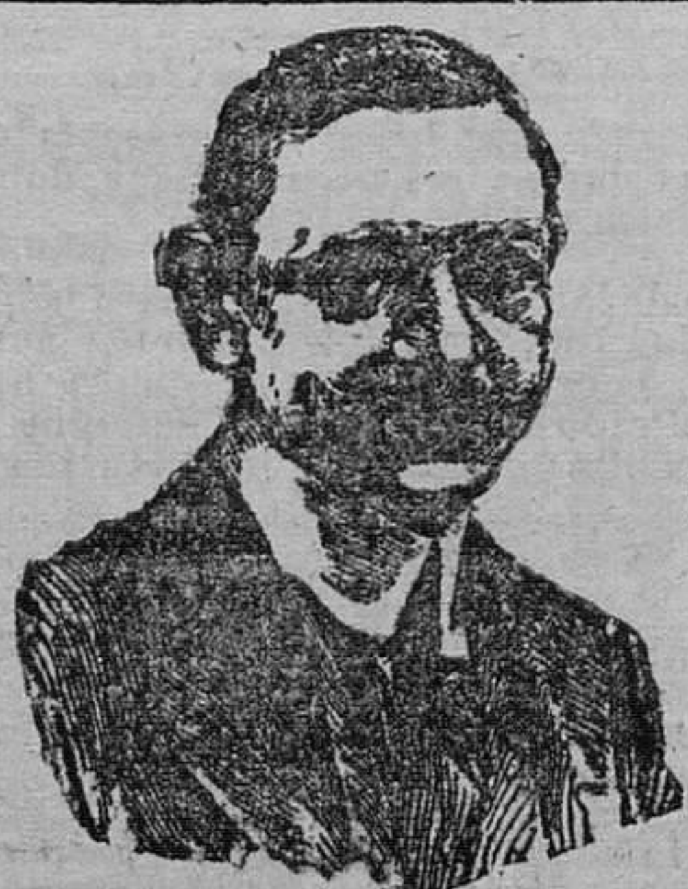
Don Manuel Garcia Prieto ministro de Estado

El desgraciado dejó en el mayor desamparo mujer y ocho hijos.