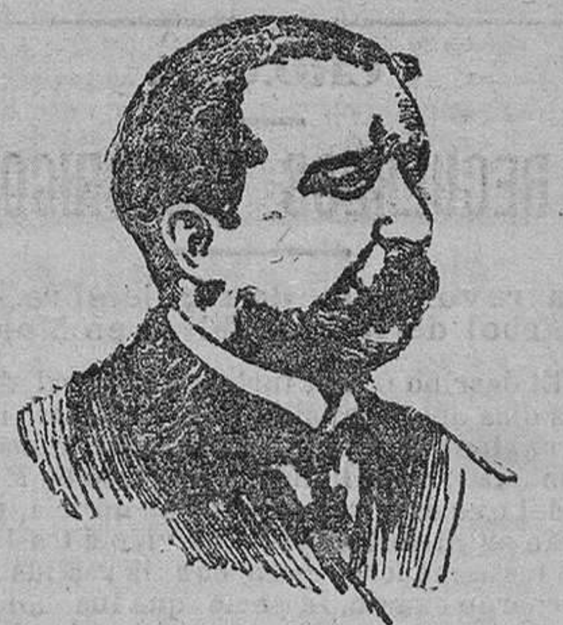
Don Trinitario Ruiz Valarino ministro de Gracia y Justicia

También la Sociedad El Automóvil dará esta noche, y mañana por tarde y noche, bailes de máscaras que prometen estar animadísimos.