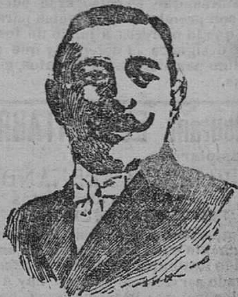
Don Fernando Merino ministro de Gobernación

Mas aun cuando discretamente nos coloquemos en tal actitud, nos parece oportuno recordar que existe una grandísima necesidad de fomentar el espíritu liberal del país. Dejando á un lado cómo vino al Poder el señor Canalejas y cómo descendió del mismo el señor Moret, es incuestionable que si no se quiere anular aquel espíritu, si no se quiere matar los grandes ideales de la democracia y del liberalismo en nuestra España, hay que emprender una activa campaña de propaganda que lleve á todos los rincones de la nación el querer liberal y el poder, para que nuestra sociedad no sea una excepción en Europa y se afirme sobre inconvertibles cimientos la supremacía del Poder civil sobre todos los demás que integran la nacionalidad española.