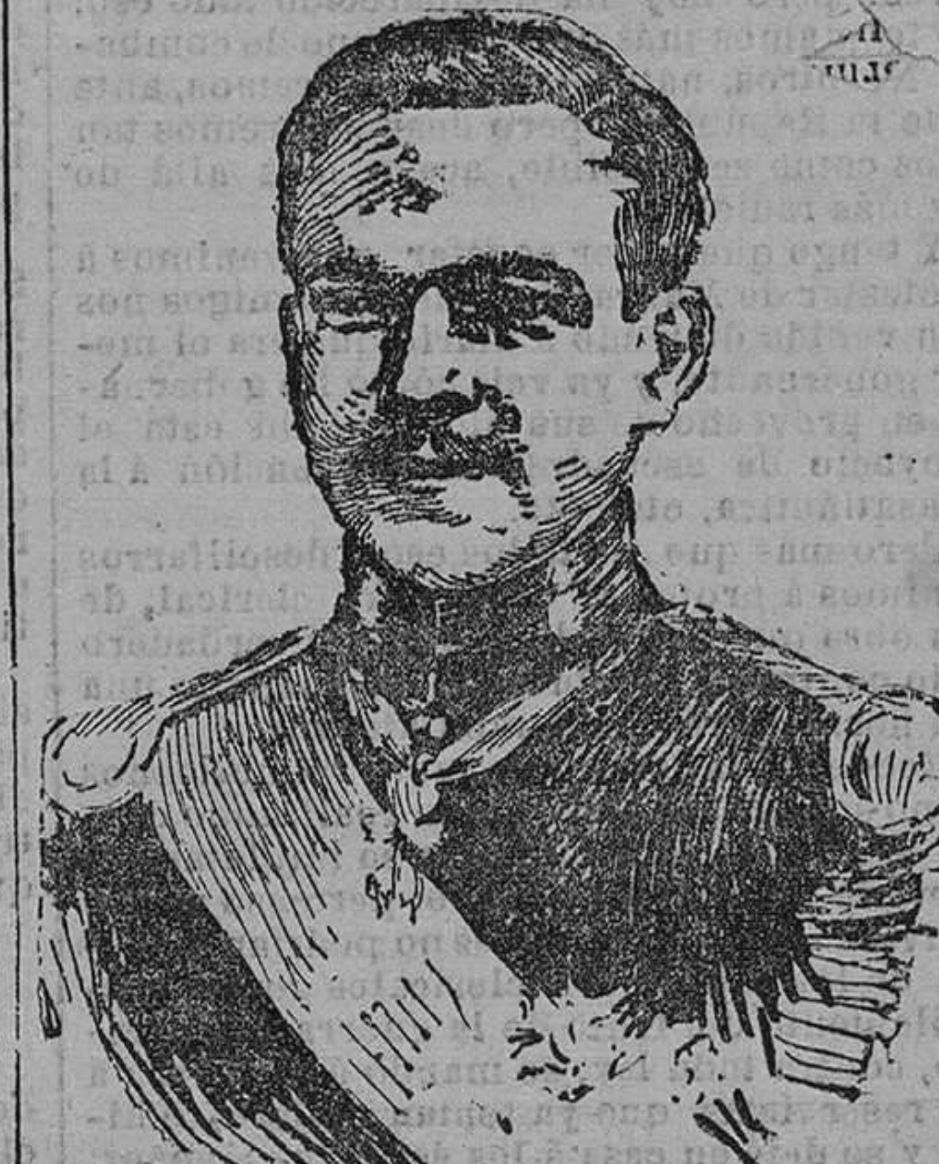
El Rey de Portugal don Manuel II