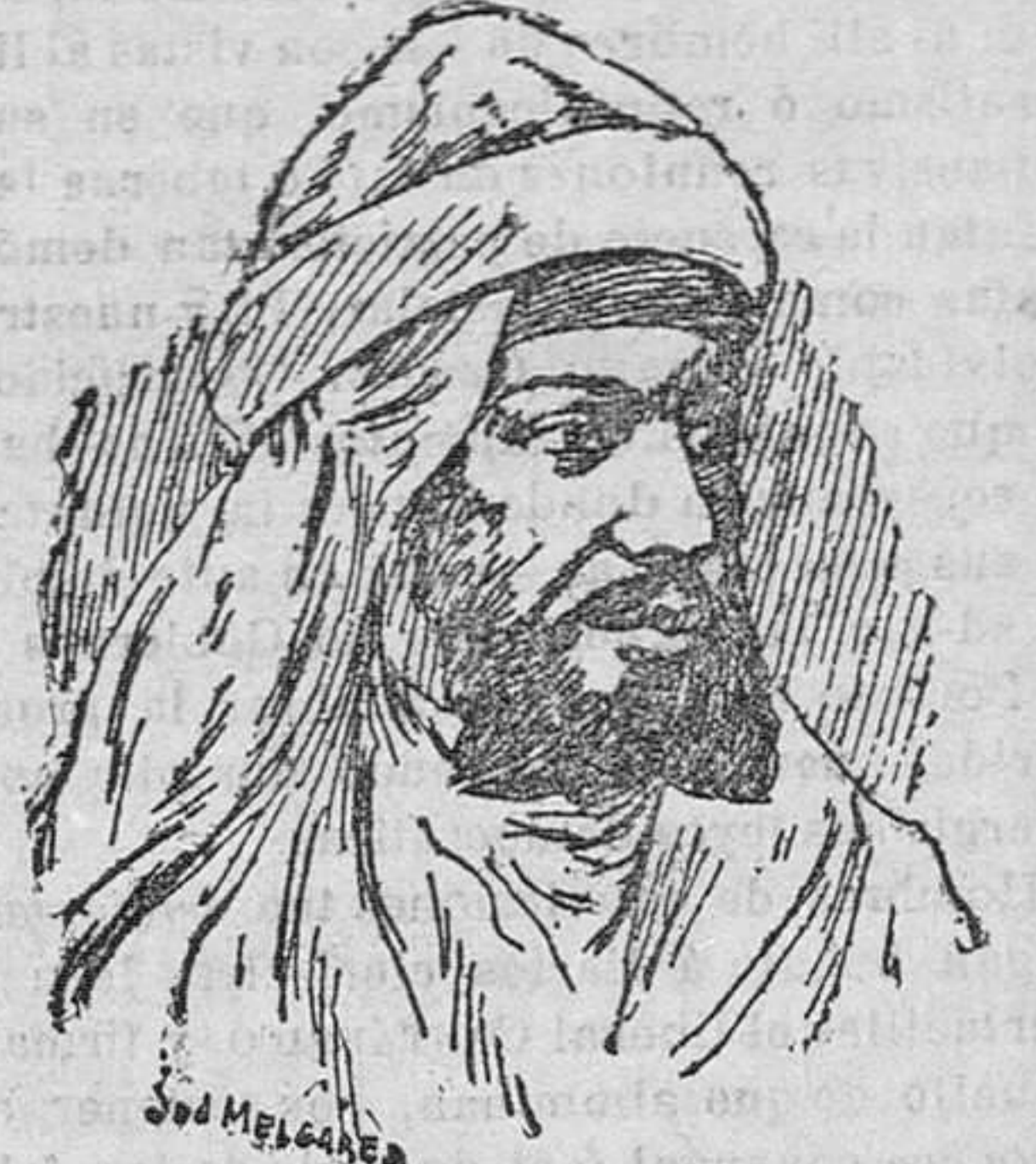
Verdadero retrato del célebre Raisul, aventurero hoy en desgracia