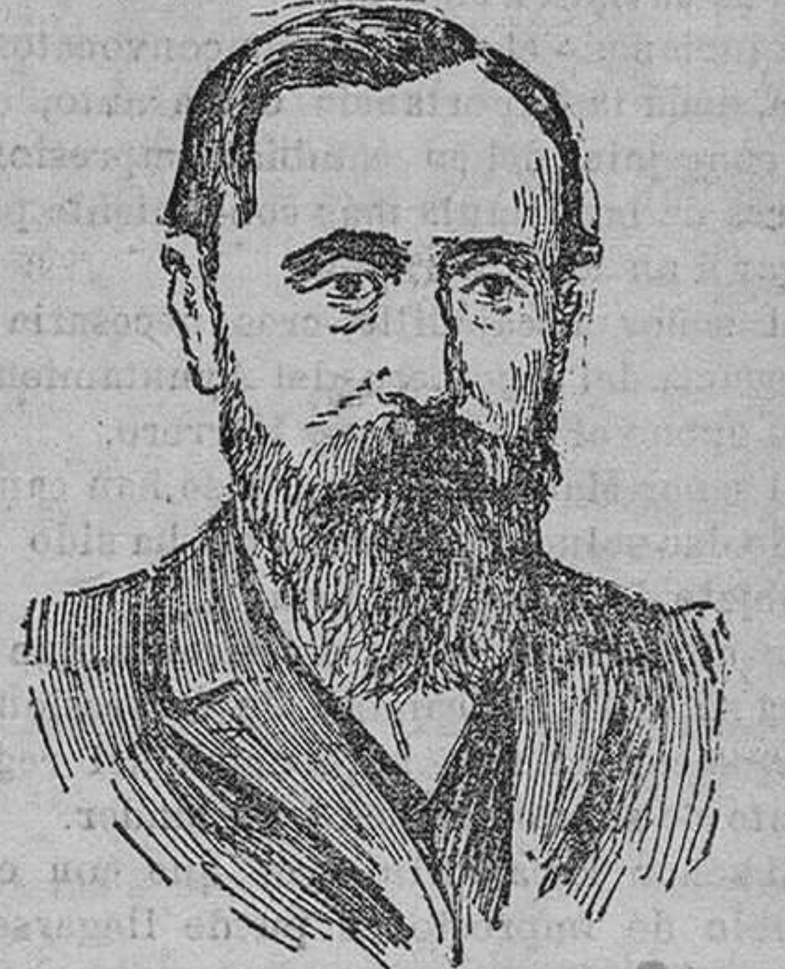
CHAKOUSKOI, primer secretario de la Duma.