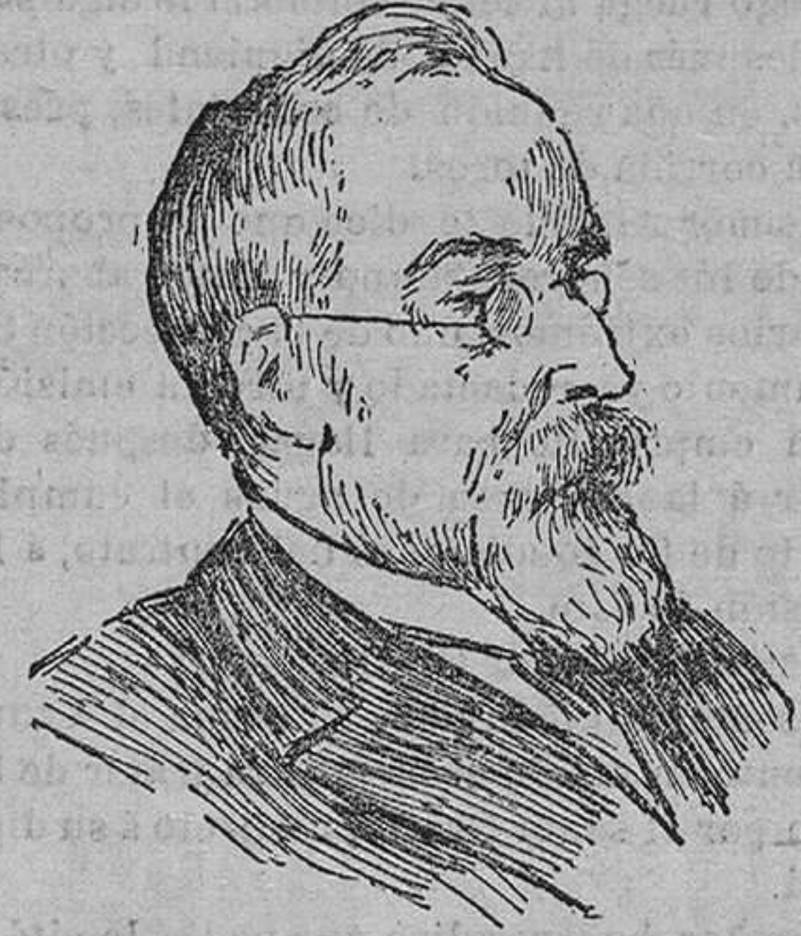
MOUROUTZEF, presidente de la Duma.

No ha sido así el Zar deja pesar su criterio en el patillo que en la balanza de la situación moscovita inclina el fiel á su favor, sin ver que el equilibrio del otro mantenido hasta ahora por Mouroutzef, Chakouskoi y la Duma misma, está á punto de perderse.