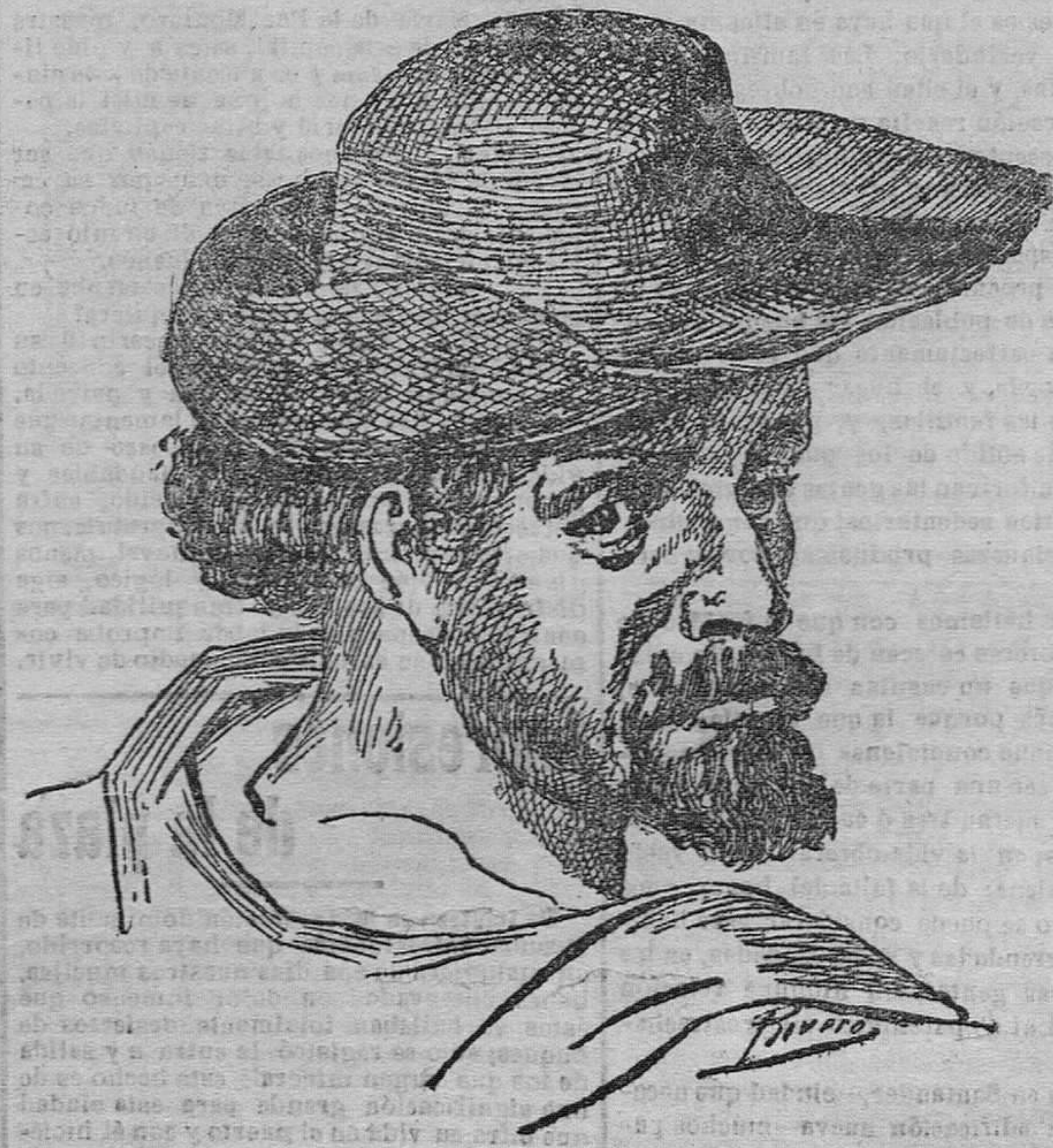
Retrato de Cervantes

Si este es un símbolo, y en cierto modo no puede negarse que para nosotros lo sea y que en él estribe una gran parte del interés humano y profundo del Quijote , para su autor no fue tal símbolo, sino criatura viva, llena de belleza espiritual, hijo predilecto de su fantasía romántica y poética que se complace en él y le adorna con las más exceles cualidades del ser humano. Cervantes no compuso ó elaboró a Don Quijote por el procedimiento frío y mecánico de la alegoría, sino que le vio con la súbita iluminación del genio, siguió sus pasos atraído y hechizado por él, y llegó al símbolo sin buscarle, agotando el riquísimo contenido psicológico que en su héroe había. Cervantes contempló y amó la belleza, y todo lo demás le fue dado por añadidura. De este modo una risueña y amena fábula que había comenzado por ser parodia literaria, y no de todo el género caballeresco sino de una particular forma de él, y que luego por necesidad lógica fue sátira del ideal histórico que en esos libros se manifestaba, prosiguió desarrollándose en una serie de antítesis, tan bellas como inesperadas, y no sólo llegó a ser la representación total y armónica de la vida nacional en su